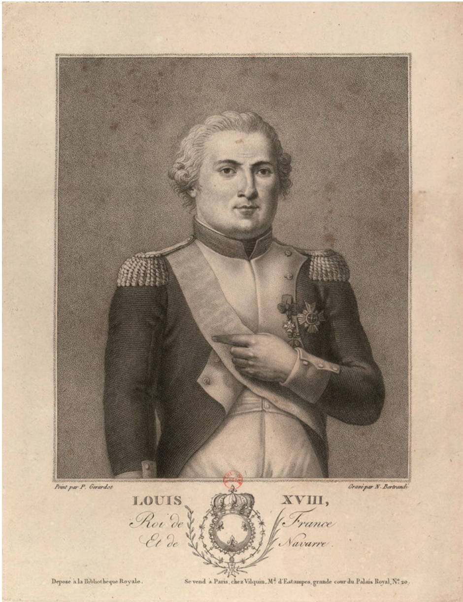
Abb. 3: N. Bertrandi / P. Gérardot: Louis XVIII, Roi de France et de Navarre, Paris 1814. Collection de Vinck, 9853.