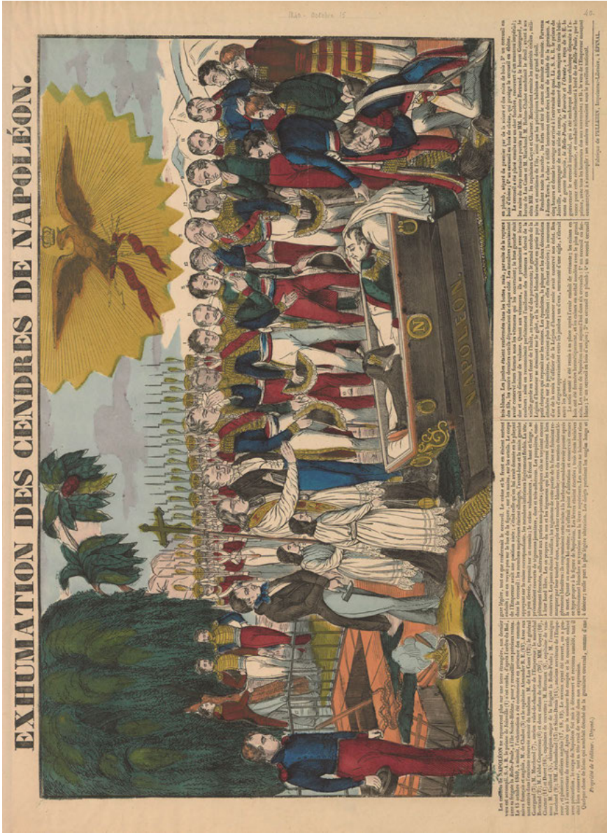
Abb. 10: Fabrique de Pellerin: Exhumation des cendres de Napoléon, Épinal o. J. Collection Michel Hennin, 14731.