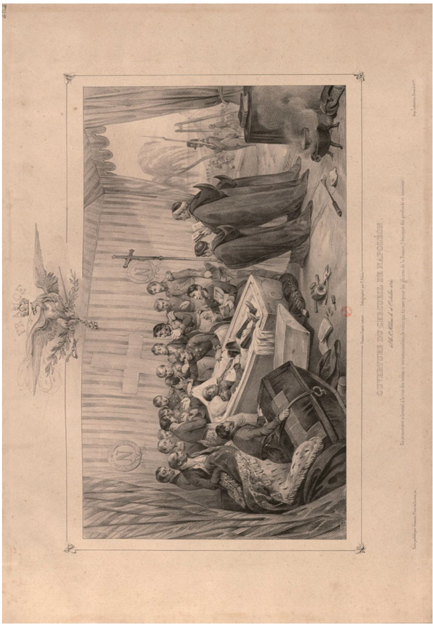
Abb. 9: Victor Adam: Ouverture du cercueil de Napoléon à l'île Ste. Hélène le 16 [sic] Octobre 1840, Paris o. J.