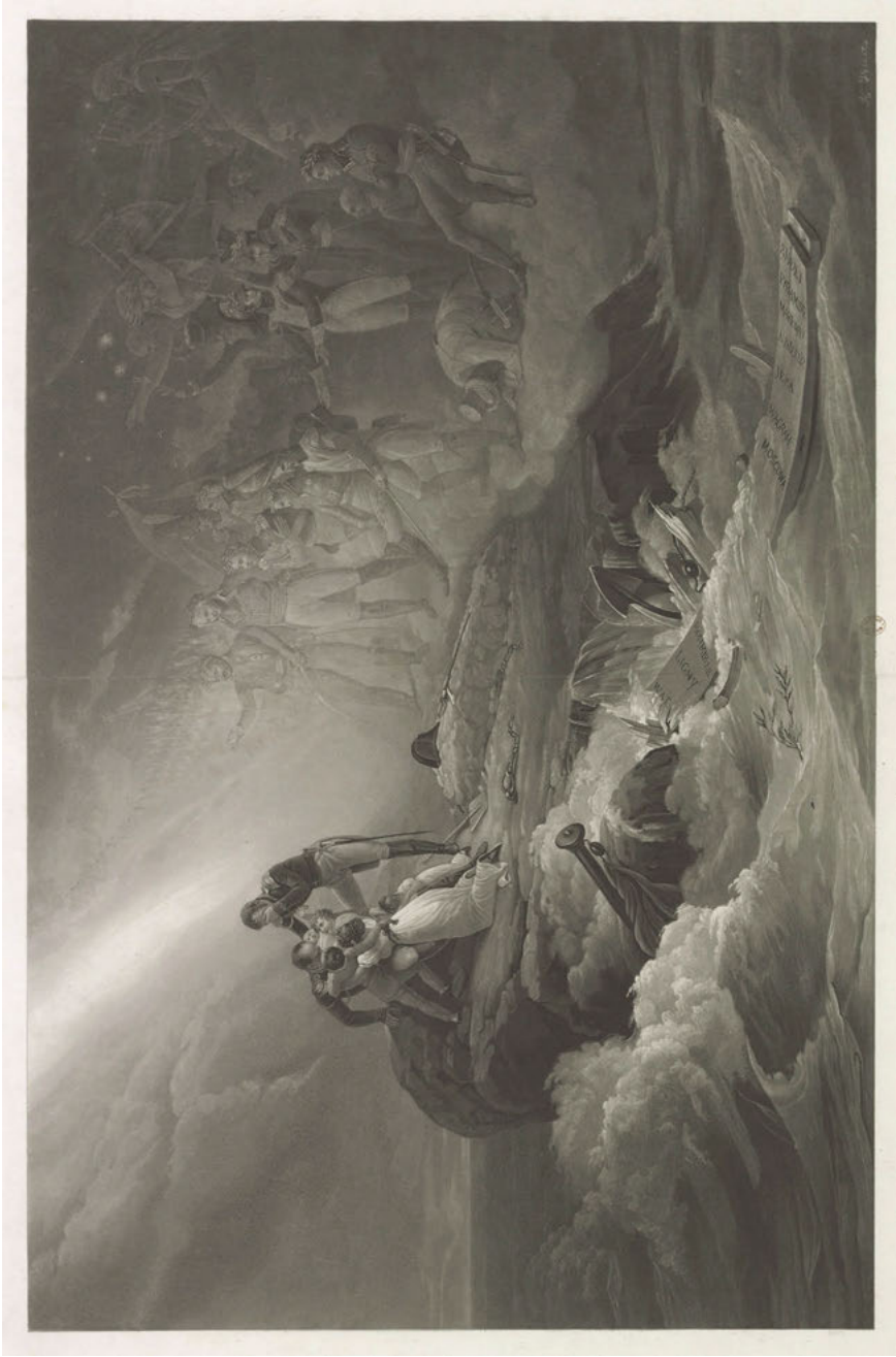
Abb. 1: Jean-Pierre-Marie Jazet / Horace Vernet: Apotheose de Napoléon (1821), Brüssel o.J. Collection Michel Hennin, 14173.