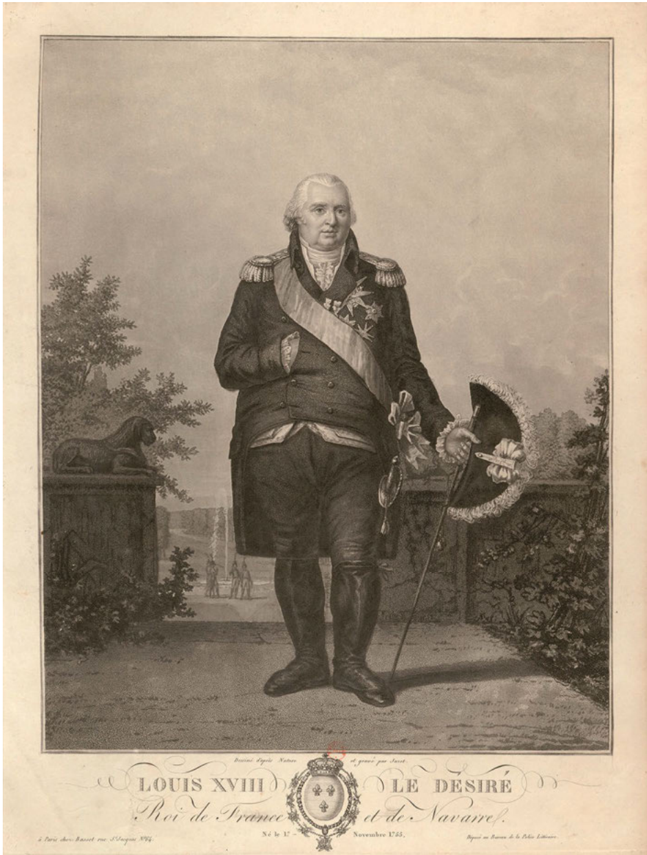
Abb. 4: Jean-Pierre-Marie Jazet / Canu: Louis XVIII le Désiré. Roi de France et de Navarre, Paris 1814. Collection de Vinck, 9868.