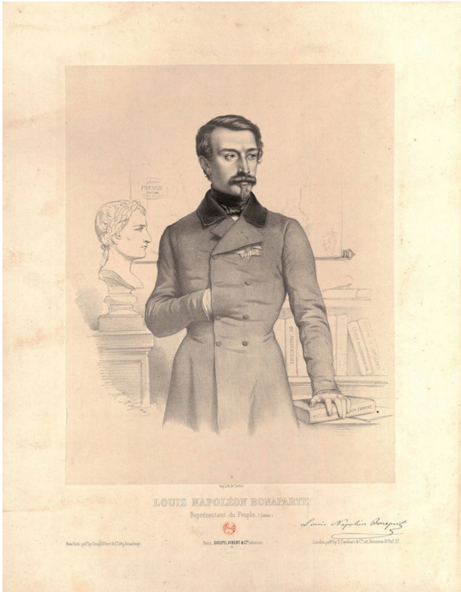
Abb. 12: Marie-Alexandre Alophe: Louis Napoléon Bonaparte, Représentant du Peuple (Seine), Paris 1848. Collection de Vinck, 14953.