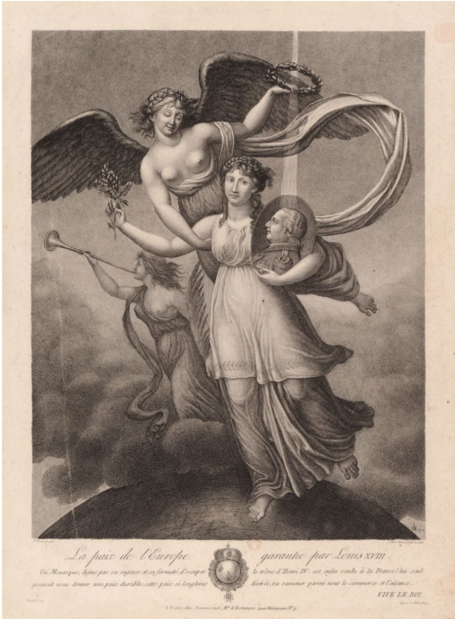
Abb. 5: Jean Baptiste Louis Massard: La paix de l'Europe garantie par Louis XVIII, Paris 1814. Collection Michel Hennin, 13656.