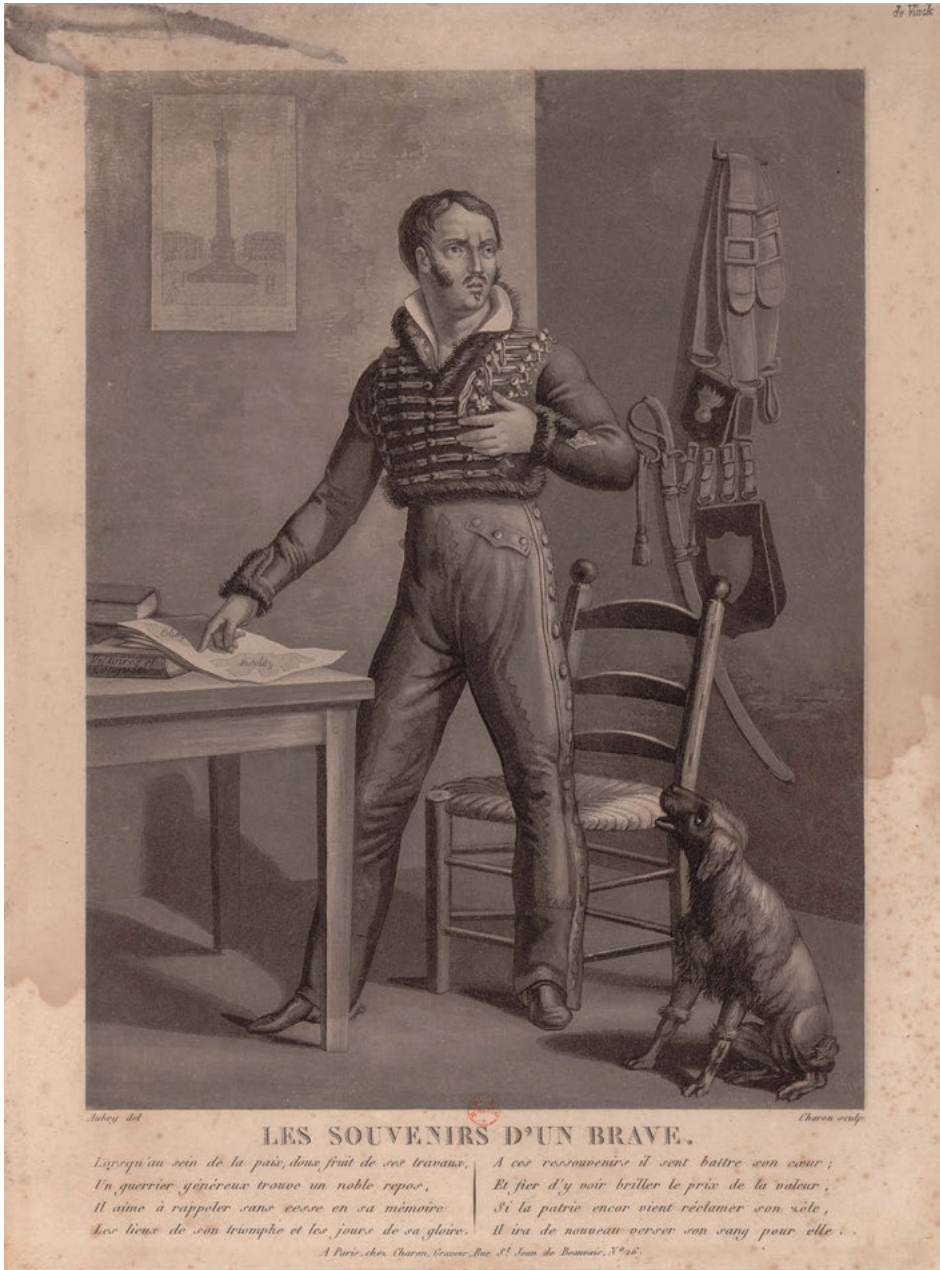
Abb. 2: Louis-François Charon / Aubry: Les Souvenirs d'un brave, Paris 1821. Collection de Vinck, 9078.