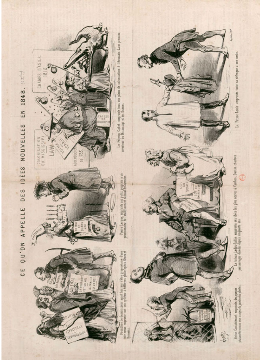
Abb. 13: Cham: Ce qu'on appelle des idées nouvelles en 1848, Paris 1848. Collection de Vinck, 14121.