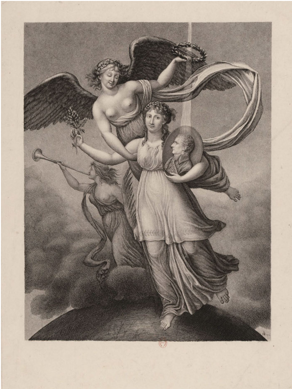
Abb. 6: Jean Baptiste Louis Massard: Portrait de Napoléon Bonaparte, en buste, de profil dirigé à gauche dans un médaillon ovale porté par la Paix précédée de la Rénommée, la Victoire tient une couronne au-dessus de la tête de Bonaparte, o. O., o. J. Collection Michel Hennin, 12755.