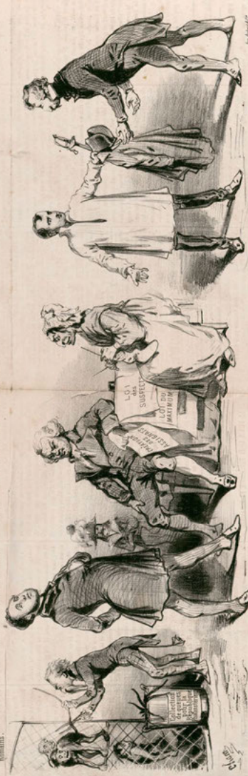
Le Prince Louis emprunte toute sa doctrine à son maître.