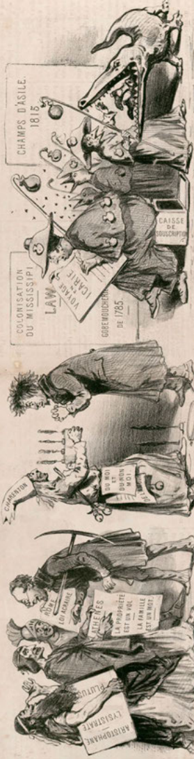
Proudhon le démolisseur veut être propriétaire d'une idée avant d'être propriétaire d'un homme.