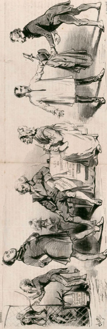
Le tyran Ledru-Rollin emprunte ses idées les plus neuves à Cambon, Duranton et autres personnages décriés depuis cinquante ans.