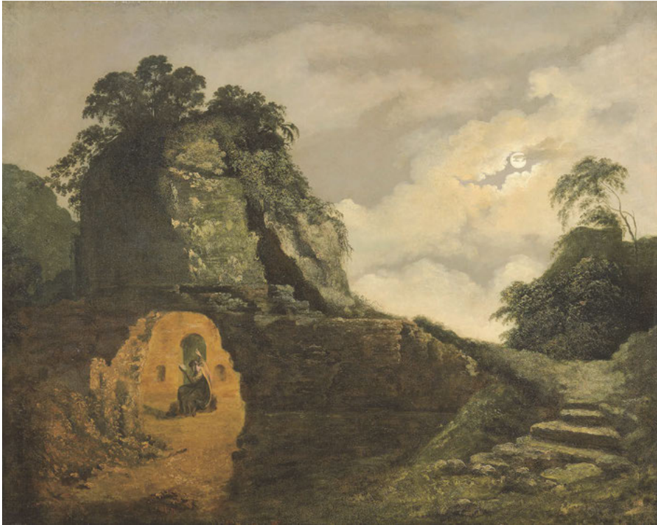
Abb. 3: Joseph Wright of Derby, Virgil's Tomb by Moonlight, with Silius Italicus , 1779, New Haven, Yale Center for British Art, Paul Mellon Collection, Inv. B1973.1.68.