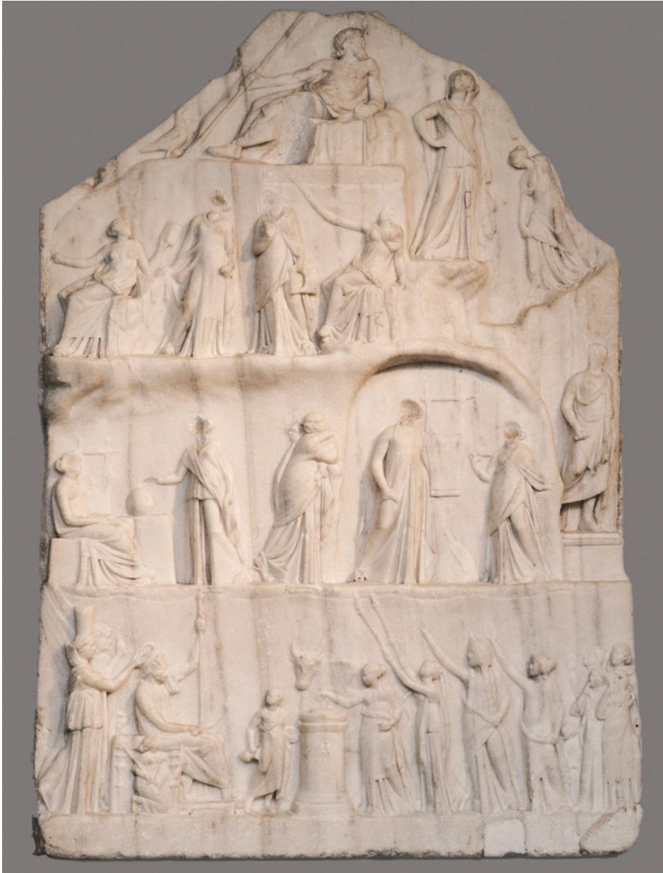
Abb. 2: Archelaos von Priene, Apotheose des Homer , Marmor, 3. Jh. v. Chr., London, British Museum, Inv. 1819,0812.1.

Heroische in der neueren kulturhistorischen Forschung. Ein kritischer Bericht, in: H-Soz-Kult, Kapitel 4.1. Antike, 28. Juli 2015, www.hsozkult.de/literaturereview/id/forschungsberichte-2216 , 14. November 2018.