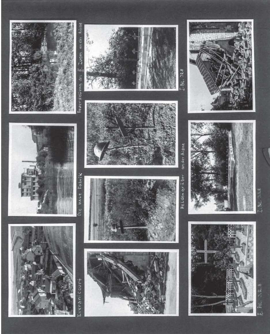
Abb. 2: Album Hans-Georg Schulz, Album I , Albumblatt, Frankreich 1940.