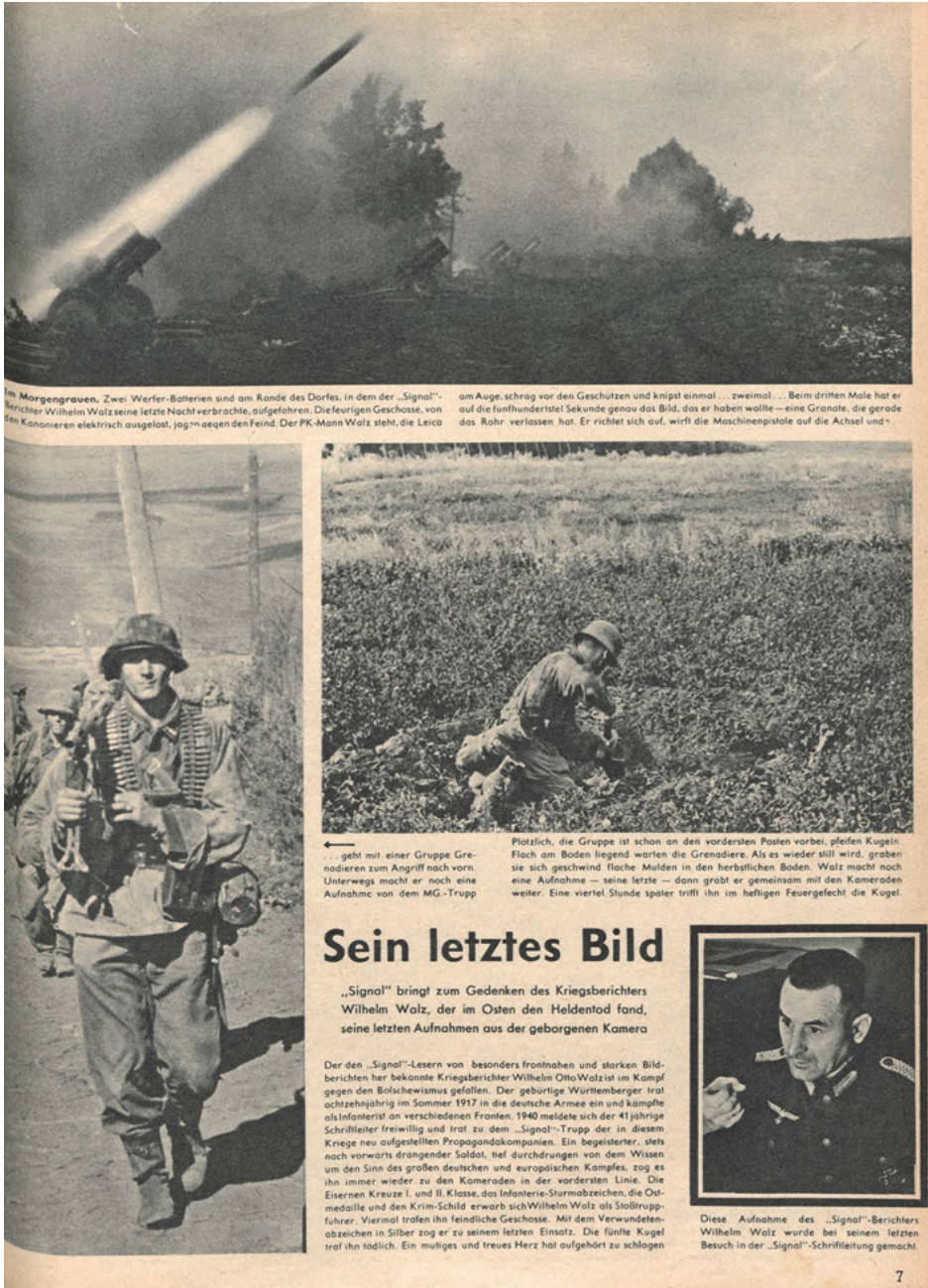
Abb. 1: Sein letztes Bild. Signal 22, 1943, S. 7.