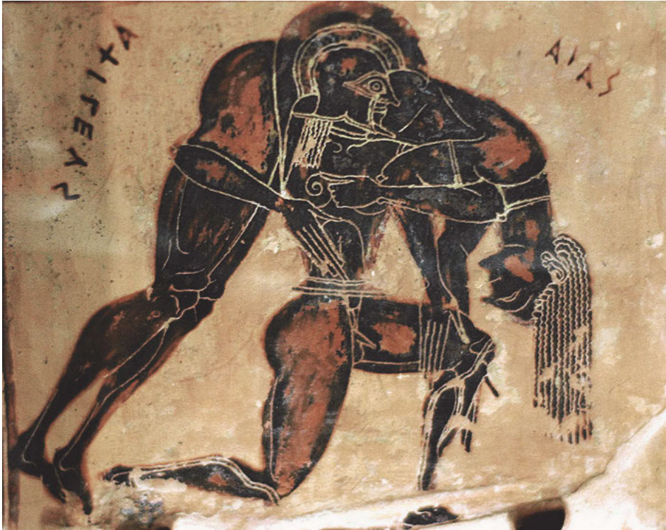
Abb. 2: Aias trägt die Leiche Achills, Henkelbild des attisch-schwarzfigurigen Volutenkraters des Klitias und Ergotimos, um 560 v. Chr., Florenz, Museo Archaeologico, Inv. 4209.

Kriegers, der Helm und Brustpanzer tragen kann. Keine Namen sind den Figuren beigeschrieben, keine konkrete Geschichte ist erkennbar, nur die deskriptive Imagination eines offenbar als bedeutsam erachteten Vorganges in vielen Kriegen: Die Bergung eines Gefallenen durch einen Kameraden.