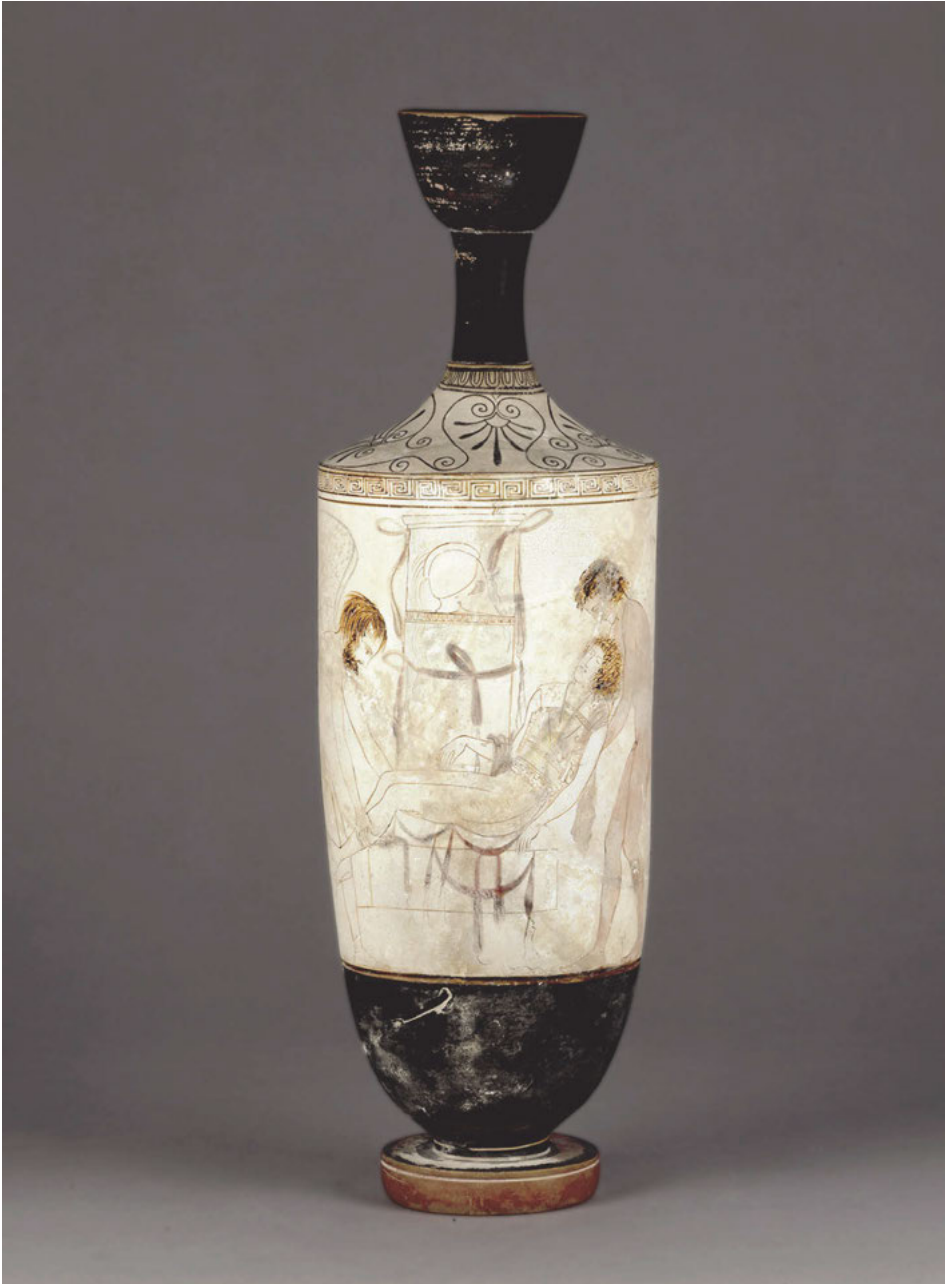
Abb. 6: Hypnos und Thanatos bergen die Leiche eines Verstorbenen, attisch-weißgrundige Lekythos, um 440 v. Chr., London, British Museum, Inv. D 58.