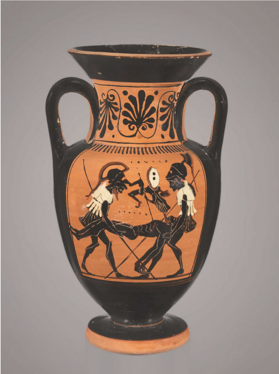
Abb. 5: Hypnos und Thanatos (?) tragen die Leiche Sarpedons vom Schlachtfeld, attisch-schwarzfigurige Halsamphora, um 500 v. Chr., New York, Metropolitan Museum of Art, Inv. 56.171.25.