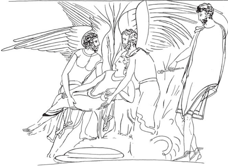
Abb. 7: Hypnos und Thanatos bergen die Leiche einer Verstorbenen, attisch-weißgrundige Lekythos, um 420 v. Chr., Athen, Archäologisches Nationalmuseum, Inv. 12783.

gerüstet erscheinen, keine Krieger mehr sind. Ihre Flügel jedoch sind vergrößert dargestellt worden; so werden sie zugleich der realen Welt weiter entrückt. Ein Hinweis auf Gefallene als Verstorbene liegt nur noch vereinzelt vor. Vielmehr können die beiden nun auch Kinder und Frauen davontragen. Eine Lekythos in Athen (Abb. 7) verbindet dies sogar mit einer Hermesfigur, die den göttlichen Totengeleiter ins Bild holt. 35 Bürger, Frauen und Kinder werden mithin so dargestellt wie vorher Krieger. Schließlich kann es so weit kommen, dass die Szene mit Hypnos und Thanatos auf einer Lekythos als Aufsatz eines Grabmales dargestellt wird, als imaginiertes steinernes Erinnerungsmal am Grab. 36 Leider nahm die spätere Konzeption großer attischer Grabmäler aus Stein, die gegen 430 v. Chr. wieder einsetzen, andere Wege, als solche Szenen zu zeigen. Die neuen Grabbilder ignorierten