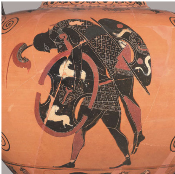
Abb. 3a–b: Krieger trägt die Leiche eines Kameraden (Aias und Achill?), Vorder- und Rückseite einer attisch-schwarzfigurigen Halsamphora des Exekias, um 540/30 v. Chr. München, Staatliche Antikensammlungen, Inv. 1470.