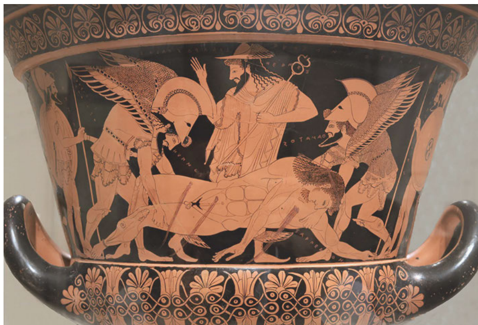
Abb. 4: Hypnos und Thanatos tragen die Leiche Sarpedons vom Schlachtfeld, attisch-rotfiguriger Kelchkrater des Euphronios, um 520/10 v. Chr., Rom, Museo Villa Giulia, Inv. L.2006.10.

Krieger mit Namen Akamas. Wenig später verändert derselbe Maler das Thema auf einem der prächtigsten Weinmischgefäße, die wir kennen (Abb. 4): Der Krater ist fast fünfzig Zentimeter hoch und befindet sich heute ebenfalls in der Villa Giulia. 20 Hier heben Thanatos von rechts und Hypnos von links den riesigen Leichnam auf. Sie sind geflügelt. Hinter dem nackten Sarpedon steht Hermes, der Gott der Wege und Reisen, der Totengeleiter.