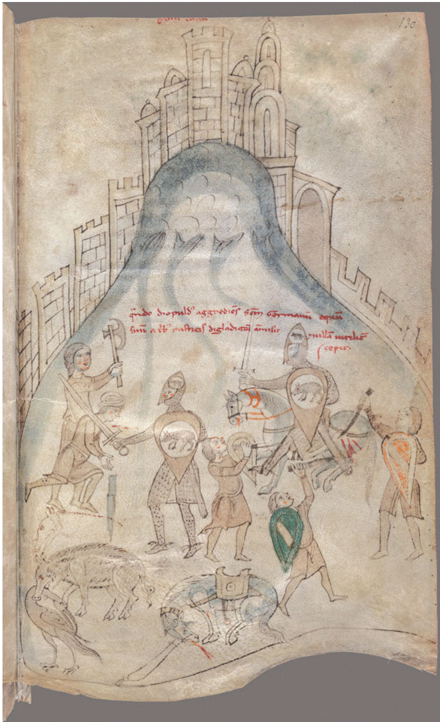
Abb. 4: Petrus de Ebulo: Liber ad honorem Augusti sive de rebus Siculis , F. 130 r .