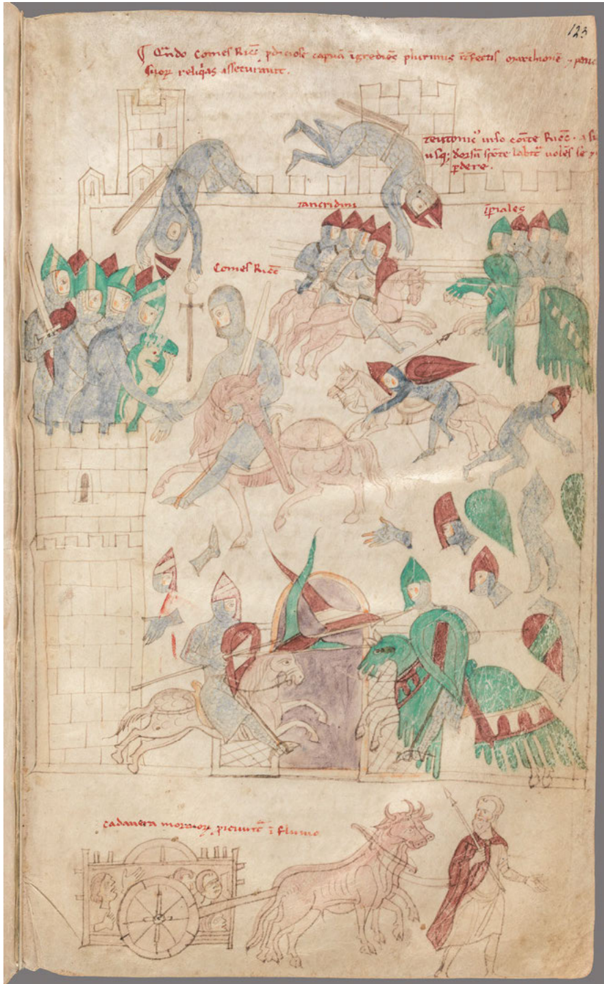
Abb. 1: Petrus de Ebulo: Liber ad honorem Augusti sive de rebus Siculis , F. 123 r .