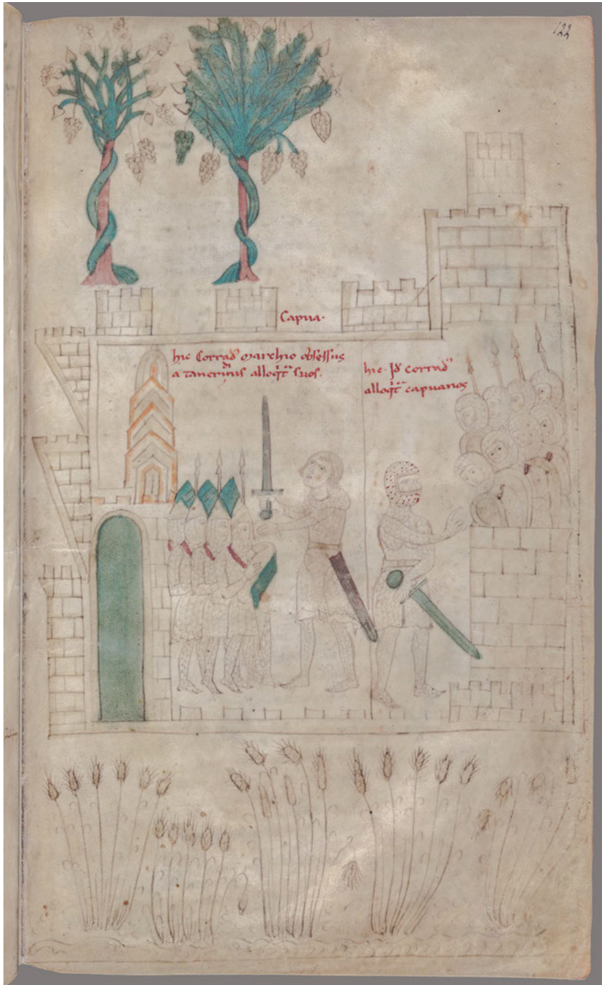
Abb. 3: Petrus de Ebulo: Liber ad honorem Augusti sive de rebus Siculis , F. 122r.