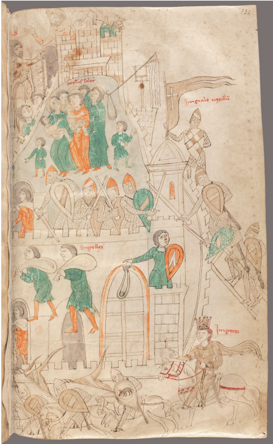
Abb. 5: Petrus de Ebulo: Liber ad honorem Augusti sive de rebus Siculis , F. 132 r .