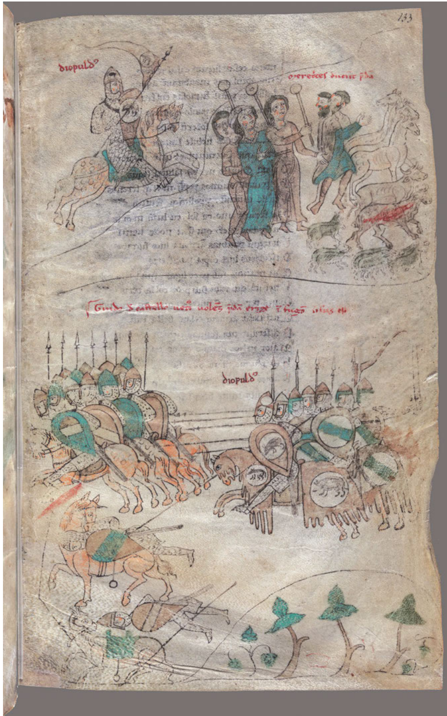
Abb. 6: Petrus de Ebulo: Liber ad honorem Augusti sive de rebus Siculis , F. 133 r .