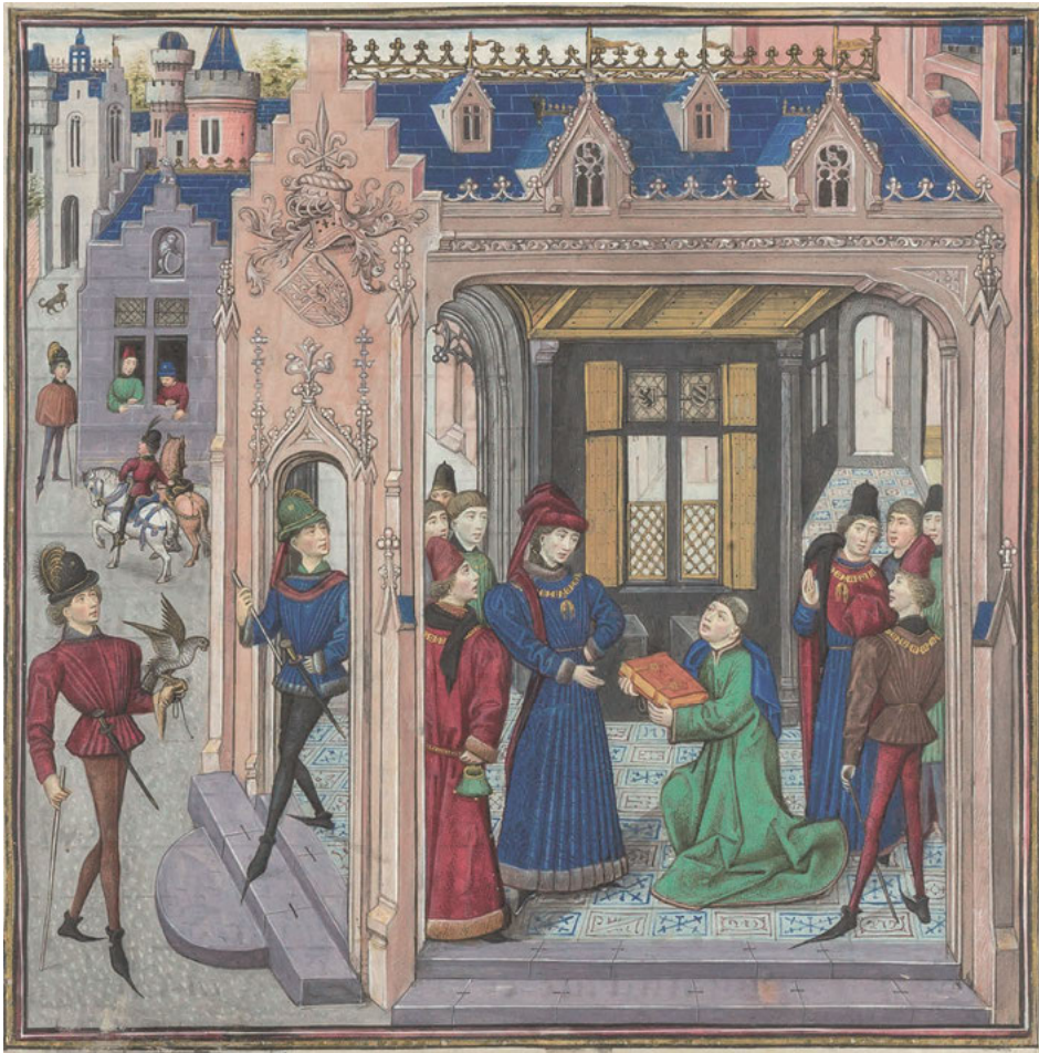
Abb. 4: Jean Wauquelin überreicht Philipp dem Guten sein Werk, Jean Wauquelin: Les Faicts et les Conquestes d'Alexandre le Grand , 1467, Petit Palais, Musée des Beaux-Arts de la Ville de Paris, Paris, Inv. Nr. ms. Dutuit 456, Fol. 7 r .

deren Dedikationsminiaturen explizit Philipp als Empfänger der Schrift zeigen (vgl. Abb. 3 und 4). Ferner hatte der Autor bereits seit 1445 diverse Übersetzungen für den Herzog und dessen unmittelbares Umfeld ausgearbeitet, so etwa die partielle Übertragung der Annales Hannoniae von Jacques de Guise, 79 weshalb die Erteilung eines neuerlichen, vergleichbaren Auftrags sicherlich nahelag. Nicht zuletzt jedoch nennt Jean Wauquelin im Prolog des zweiten Teils des Werkes „ Philippe, par la grasse de Dieu duc de Bourgogne “ als seinen Auftraggeber, 80 auf dessen Betrei-