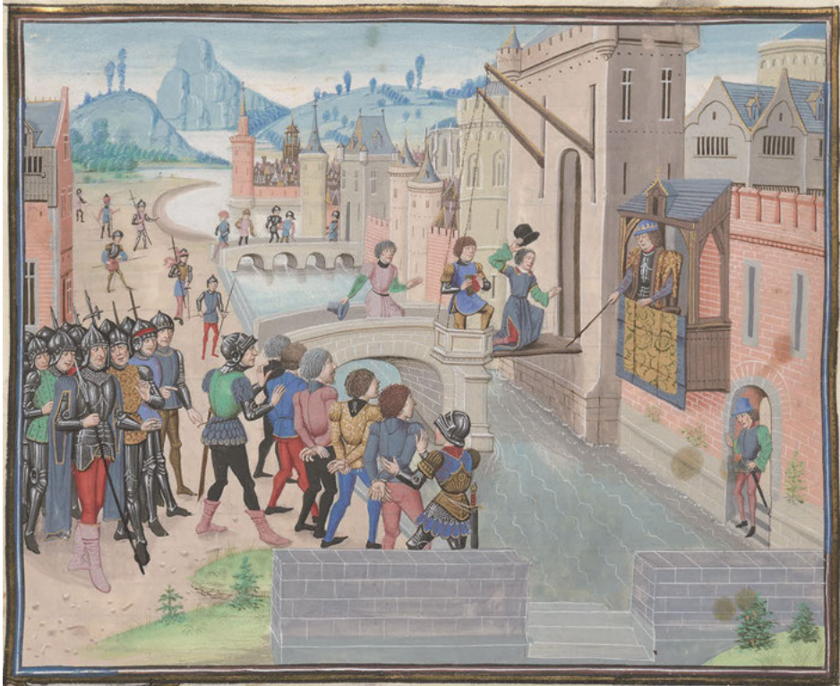
Abb. 16: Alexander bestraft Aufständische, Vasco de Lucena: Les Faictz et Gestes d'Alexandre le Grand , um 1470, Bibliothèque nationale de France, Paris, Inv. Nr. ms. Fr. 22547, Fol. 254 v .

cher im Streit mit seinem Vater nur knapp dessen geworfenem Schwert entrinnt. 42 Dadurch tritt neben die bereits bestehende homonymische Relation beider Vaterfiguren 43 eine besonders auf den Herzog zugeschnittene Ebene, denn auch Philipp der Gute „ tira une dague [...] et le [Karl] en eut feru s'il ne se en fut fuy “. 44 Hinzu kommt, dass sich nach den negativen Veränderungen des Helden Parallelen in der Herrschaftspraxis des Herzogs und Alexanders ausmachen lassen, wozu etwa der bereits angeführte Umgang mit Aufständischen zu zählen ist. Ist die Bestrafung der rebellierenden Makedonen zwar der Darstellung des Quintus Curtius entnommen, so fügt Vasco de Lucena hinzu, Alexander „ les fist noyer en ung fleuve “ 45 (vgl. dazu auch Abb. 16). Diese Szenerie scheint unmittelbar an die Rache angepasst, die Karl an den aufständischen Bürgern Lüttichs in Flandern nahm. Deren Anführer muss-