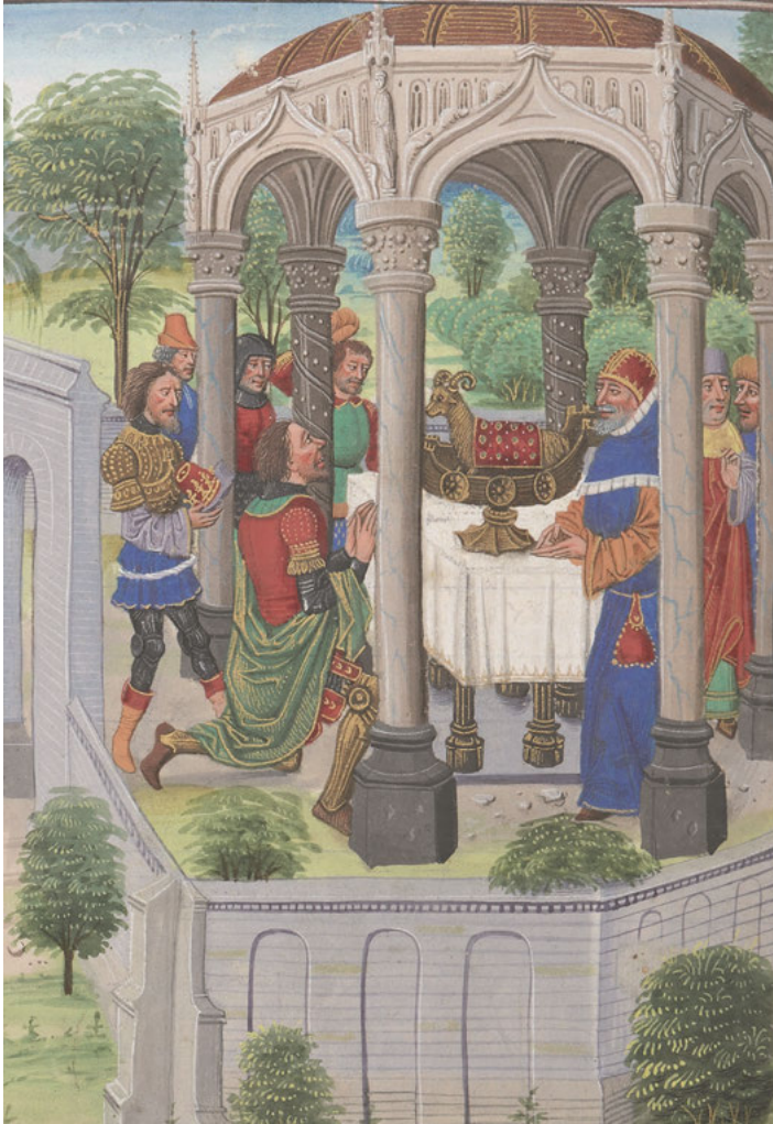
Abb. 14: Alexander in Anbetung des Jupiter Ammon (Ausschnitt), Vasco de Lucena: Les Faictz et Gestes d'Alexandre le Grand , um 1470, Bibliothèque nationale de France, Paris, Inv. Nr. ms. Fr. 22547, Fol. 73 v .

ge des italienischen Humanisten Poggio Bracciolini. Vasco de Lucena wiederholt hier noch einmal die Charaktermängel Alexanders, welcher „ incontinent que par orgueil, aigreur et cruauté “, „wankelmütig durch seinen Stolz, seine Reizbarkeit und seine Grausamkeit“, gewesen sei. Cyrus dagegen erscheint als „ plus hardy [...], plus grant conquereur, plus eureulx [...], que Alexandre “, „kühner [...], größerer Eroberer, vom Glück Begünstigter [...] als Alexander“. Dennoch stellt der Autor fest, dass, obwohl „ vous [Karl] ressemblez ledit Cyrus en tant de choses “, „Ihr Cyrus in so vielen Dingen ähnlich scheint“, Karl deutlich milder handle und „ les estatus et ordonances dudit Cyrus [...], de plus grant [...], austerité “, „die Gesetze und Befehle jenes Cyrus [...] von größerer [...] Strenge“ als die Karls gewesen seien, vgl. Vasco de Lucena: L'histoire Cirus, roy de Perse, composée par Xenophon le philozophe et intitulée de la tresbonne monarchie , 1470 (BNF ms. 9736), Fol. 1.