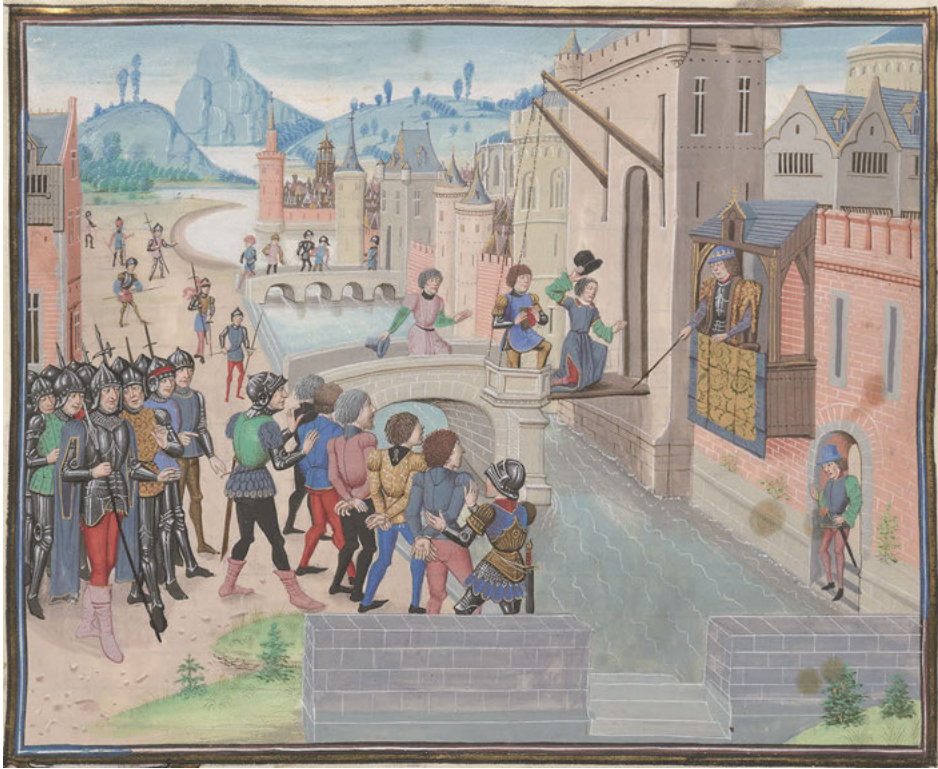
Abb. 16: Alexander bestraft Aufständische, Vasco de Lucena: Les Faictz et Gestes d'Alexandre le Grand , um 1470, Bibliothèque nationale de France, Paris, Inv. Nr. ms. Fr. 22547, Fol. 254 v .

cher im Streit mit seinem Vater nur knapp dessen geworfenem Schwert entrinnt. 42 Dadurch tritt neben die bereits bestehende homonymische Relation beider Vaterfiguren 43 eine besonders auf den Herzog zugeschnittene Ebene, denn auch Philipp der Gute „ tira une dague [...] et le [Karl] en eut feru s'il ne se en fut fuy “. 44 Hinzu kommt, dass sich nach den negativen Veränderungen des Helden Parallelen in der Herrschaftspraxis des Herzogs und Alexanders ausmachen lassen, wozu etwa der bereits angeführte Umgang mit Aufständischen zu zählen ist. Ist die Bestrafung der rebellierenden Makedonen zwar der Darstellung des Quintus Curtius entnommen, so fügt Vasco de Lucena hinzu, Alexander „ les fist noyer en ung fleuve “ 45 (vgl. dazu auch Abb. 16). Diese Szenerie scheint unmittelbar an die Rache angepasst, die Karl an den aufständischen Bürgern Lüttichs in Flandern nahm. Deren Anführer muss-