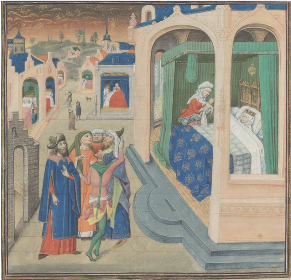
Abb. 9: Die Geburt Alexanders, Jean Wauquelin: Les Faicts et les Conquestes d'Alexandre le Grand , 1467, Petit Palais, Musée des Beaux-Arts de la Ville de Paris, Paris, Inv. Nr. ms. Dutuit 456, Fol. 10 r .

venir a quelque mal fin . 154 Wird im Folgenden „ Fortune [...] instable “ 155 für den frühen Tod Alexanders verantwortlich gemacht, so kann dies dementsprechend nicht einer Rückkehr in das ursprüngliche Heidentum des Helden, sondern vielmehr der Erklärungsnot Jean Wauquelins für das vorzeitige Ableben eines derart frommen Helden zugeschrieben werden. 156 Überantwortet Alexander somit seine „ ame a Dieu son Createur “, besteht für den Autor „ nulle doubte, [...] qu'il estoit amez