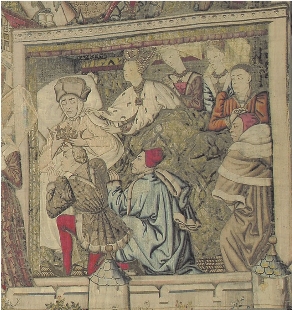
Abb. 25: Der sterbende Philipp von Makedonien krönt Alexander, Die Jugend Alexanders (Ausschnitt), Tapisserie, um 1460, Palazzo del Principe, Sammlung Doria-Pamphilj, Genua.

Königsinsignien aufweist. 172 Philipp trug bei seinem Einzug in die Stadt einen standesgemäßen Herzogshut, der, obgleich „ de pris non extimable “ 173 mit einer Vielzahl von Edelsteinen besetzt, 174 keine Krone war. Dennoch suggerierte die Präsentation Alexanders zumindest eine symbolische Krönung des Herzogs beziehungs-