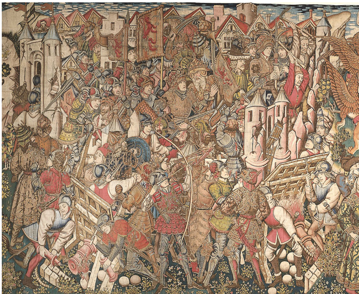
Abb. 38: Die Abenteuer Alexanders im Orient, Tapisserie, um 1460, Palazzo del Principe, Sammlung Doria-Pamphilj, Genua.