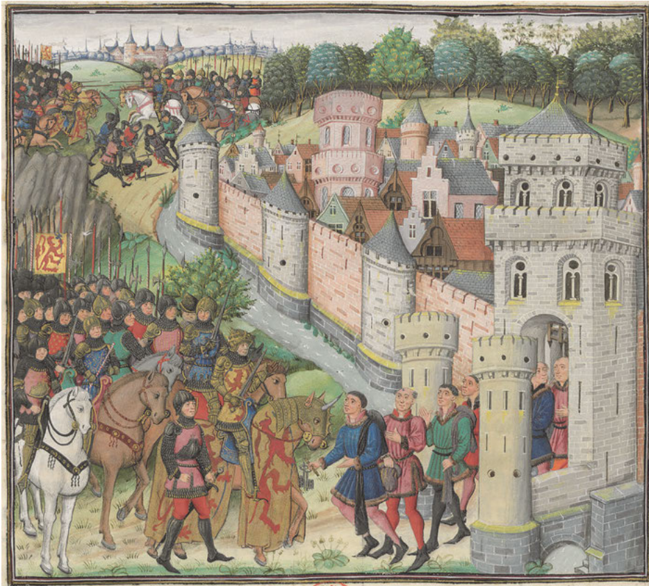
Abb. 30: Unterwerfung Babylons unter Alexander, Jean Wauquelin: Les Faicts et les Conquestes d'Alexandre le Grand , 1448, Bibliothèque nationale de France, Paris, Inv. Nr. ms. Fr. 9342, Fol. 199 v .

dass sich der Herzog nicht nur als exzellenter Feldherr inszenieren wollte, sondern spezifisch auf die Unterwerfung einer Stadt anspielte. So sind auf dem zweiten Doriateppich (vgl. Abb. 32 und 38) und auf einer der Londoner Zeichnungen (vgl. Abb. 33) explizit die Eroberung einer Stadt sowie die Schlüsselübergabe durch die besiegten Bürger dargestellt. Karl wollte so seine Machtansprüche gegenüber den Gentern zum Ausdruck bringen. 210 Dafür spricht sicherlich der demütigende Empfang der Bürger, welche sich Karl nicht nur „à coutes et à genoux“, 211 „criant tous ensemble et unanimiter très humblement merchy“ 212 nähern mussten, sondern zu-