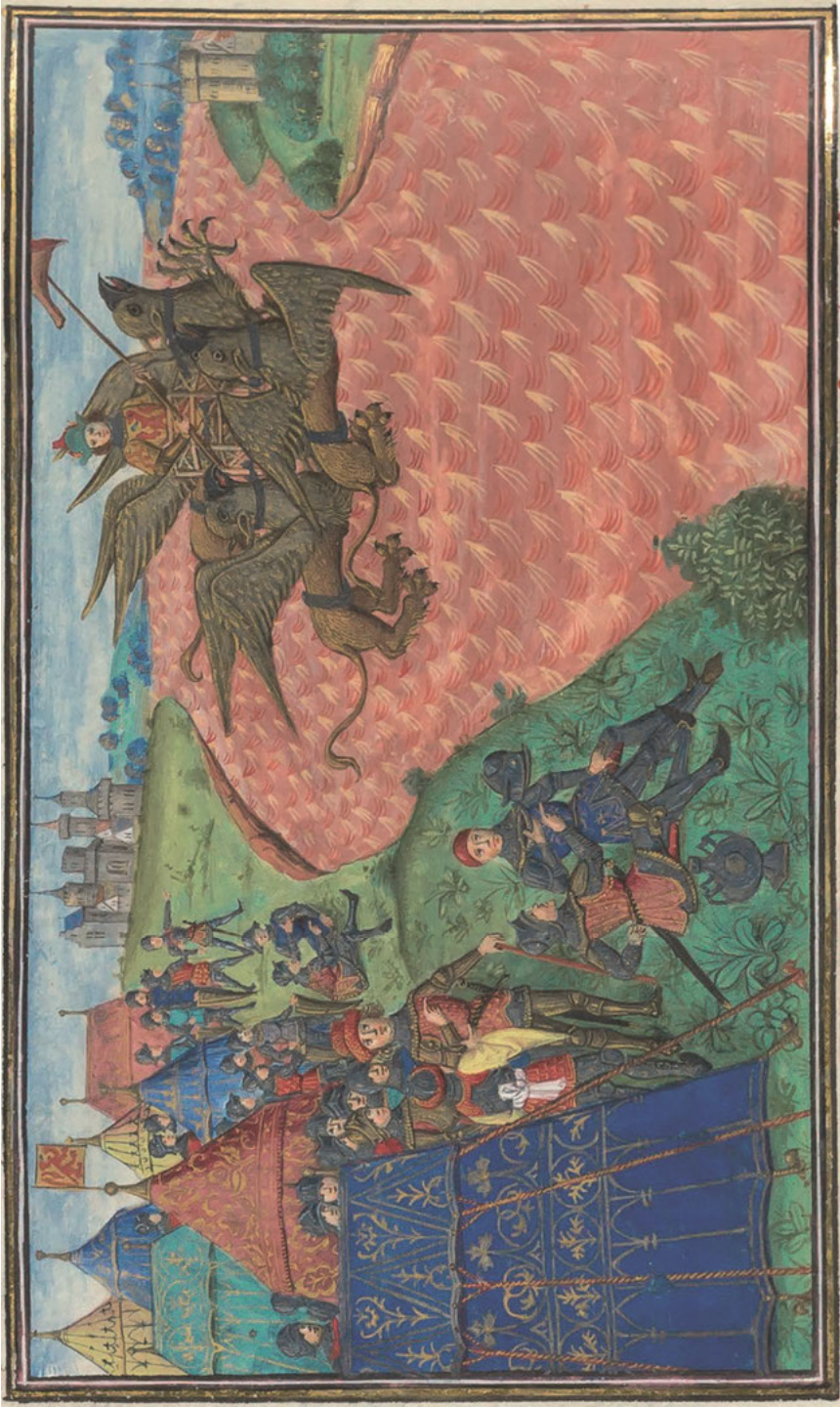
Abb. 18: Alexanders Lufreise, Jean Wauquelin: Les Faits et les Conquestes d'Alexandre le Grand , 1467, Petit Palais, Musée des Beaux-Arts de la Ville de Paris, Inv. Nr. ms. Dutuit 456, Fol. 257.