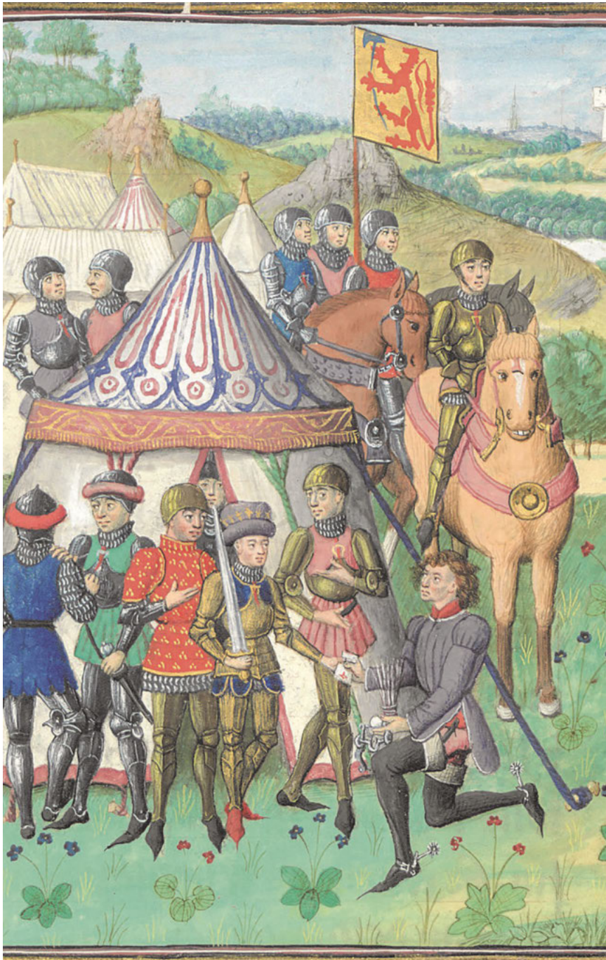
Abb. 7: Alexander empfängt eine Botschaft des persischen Königs Dareios (Ausschnitt), Jean Wauquelin: Les Faits et les Conquestes d'Alexandre le Grand , 1448, Bibliothèque nationale de France, Inv. Nr. ms. Fr. 9342, Fol. 23 v .