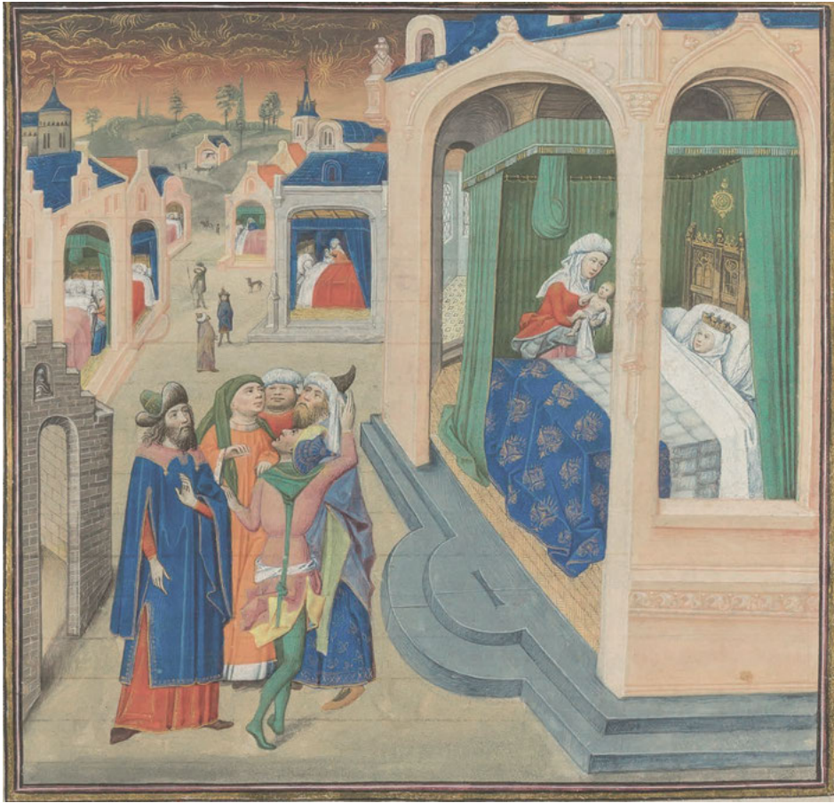
Abb. 9: Die Geburt Alexanders, Jean Wauquelin: Les Faicts et les Conquestes d'Alexandre le Grand , 1467, Petit Palais, Musée des Beaux-Arts de la Ville de Paris, Paris, Inv. Nr. ms. Dutuit 456, Fol. 10 r .

venir a quelque mal fin . 154 Wird im Folgenden „ Fortune [...] instable “ 155 für den frühen Tod Alexanders verantwortlich gemacht, so kann dies dementsprechend nicht einer Rückkehr in das ursprüngliche Heidentum des Helden, sondern vielmehr der Erklärungsnot Jean Wauquelins für das vorzeitige Ableben eines derart frommen Helden zugeschrieben werden. 156 Überantwortet Alexander somit seine „ ame a Dieu son Createur “, besteht für den Autor „ nulle doubte, [...] qu'il estoit amez