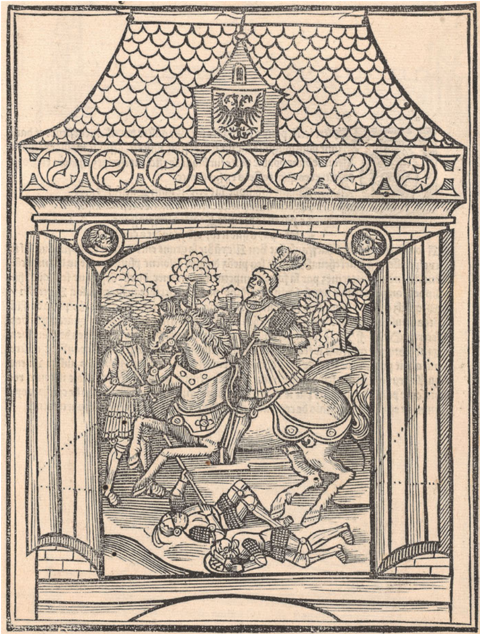
Abb. 36: Philipp von Makedonien steht staunend neben Alexander, Holzschnitt auf Papier, 1515, Bibliothèque royale de Belgique, Brüssel, Inv. Nr. B. 1553, Fol. C6.