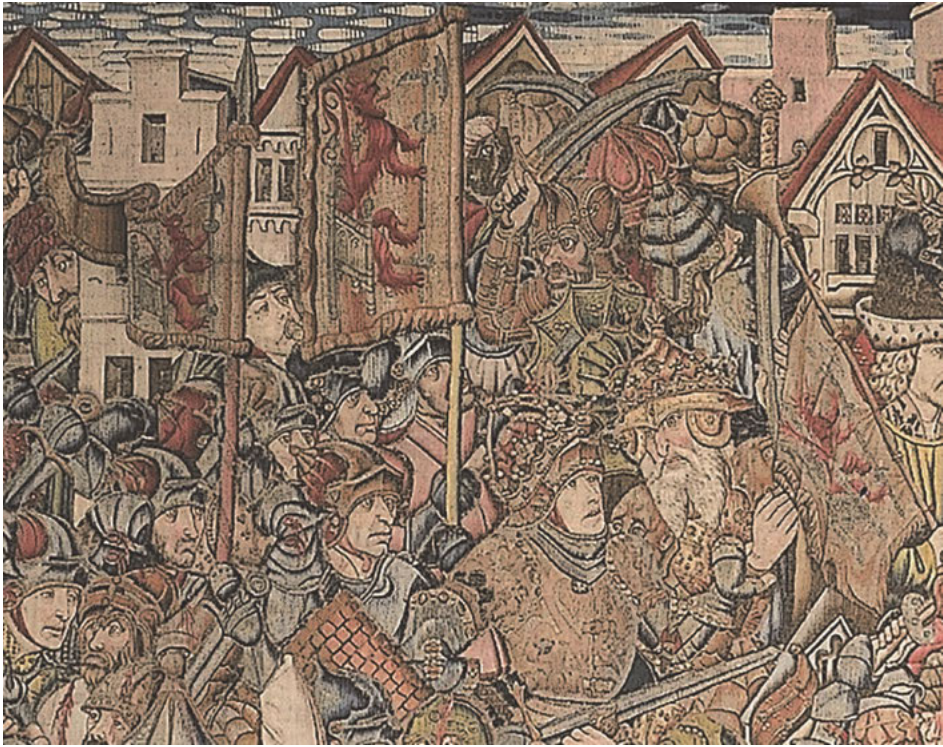
Abb. 27: Ein orientalisch gekleideter Adliger ergibt sich Alexander, Die Abenteuer Alexanders im Orient (Ausschnitt), Tapiserie, um 1460, Palazzo del Principe, Sammlung Doria-Pamphilj, Genua.

für einen Kreuzzug auszugehen, zumal dies gleichermaßen im weiteren Umfeld Philipps so wahrgenommen wurde. 180