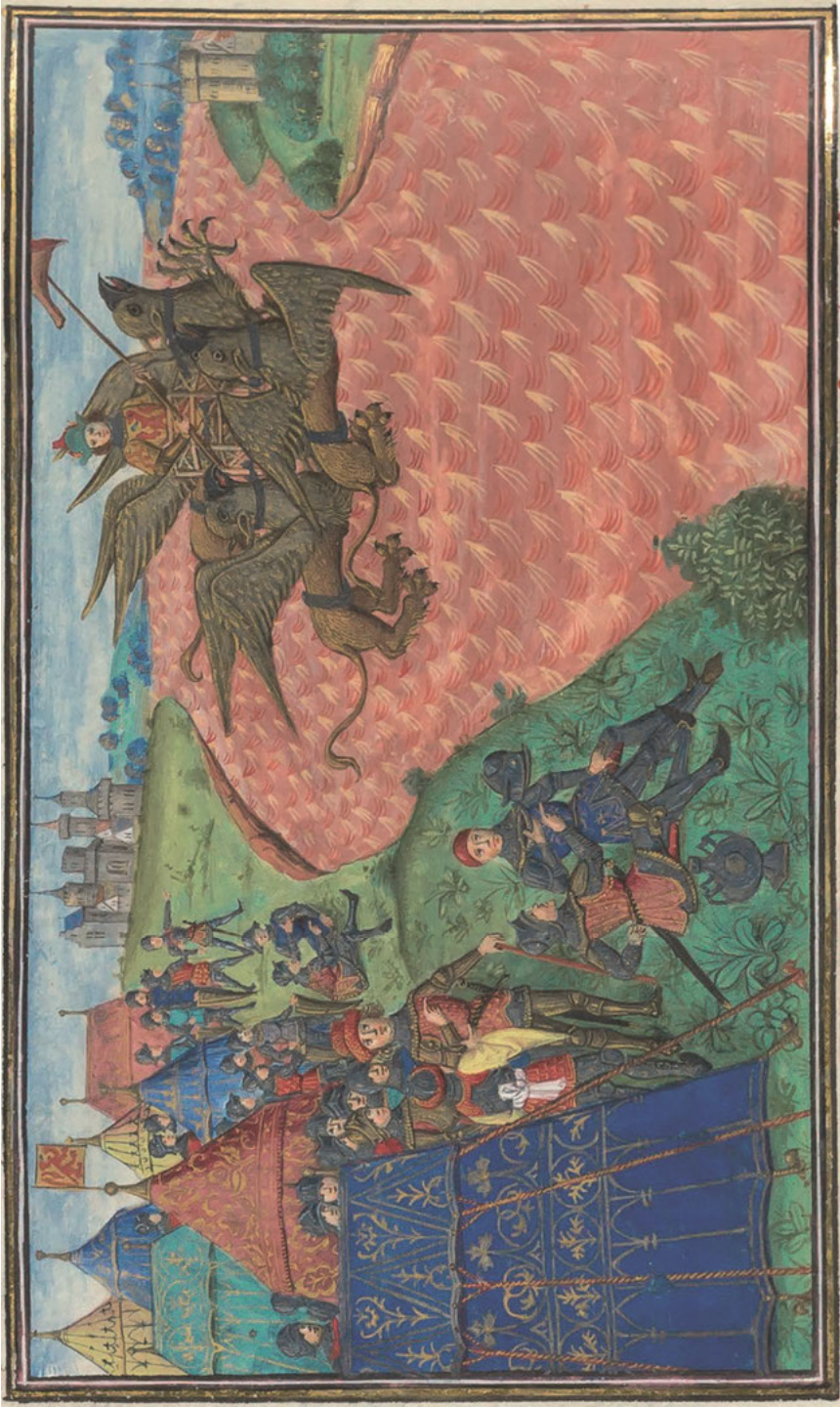
Abb. 18: Alexanders Luftreise, Jean Wauquelin: Les Faits et les Conquistes d'Alexandre le Grand , 1467, Petit Palais, Musée des Beaux-Arts de la Ville de Paris, Inv. Nr. ms. Dutuit 456, Fol. 257.