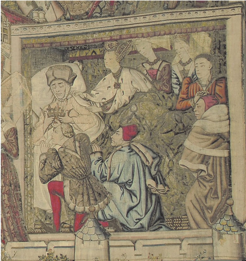
Abb. 25: Der sterbende Philipp von Makedonien krönt Alexander, Die Jugend Alexanders (Ausschnitt), Tapissierie, um 1460, Palazzo del Principe, Sammlung Doria-Pamphilj, Genua.

Königsinsignien aufweist. 172 Philipp trug bei seinem Einzug in die Stadt einen standesgemäßen Herzogshut, der, obgleich „ de pris non extimable “ 173 mit einer Vielzahl von Edelsteinen besetzt, 174 keine Krone war. Dennoch suggerierte die Präsentation Alexanders zumindest eine symbolische Krönung des Herzogs beziehungs-