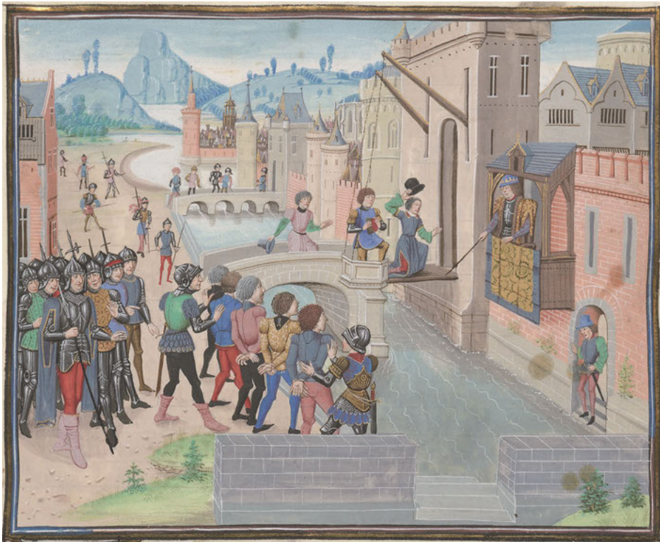
Abb. 16: Alexander bestraft Aufständische, Vasco de Lucena: Les Faictz et Gestes d'Alexandre le Grand , um 1470, Bibliothèque nationale de France, Paris, Inv. Nr. ms. Fr. 22547, Fol. 254 v .

cher im Streit mit seinem Vater nur knapp dessen geworfenem Schwert entrinnt. 42 Dadurch tritt neben die bereits bestehende homonymische Relation beider Vaterfiguren 43 eine besonders auf den Herzog zugeschnittene Ebene, denn auch Philipp der Gute „ tira une dague [...] et le [Karl] en eut feru s'il ne se en fut fuy “. 44 Hinzu kommt, dass sich nach den negativen Veränderungen des Helden Parallelen in der Herrschaftspraxis des Herzogs und Alexanders ausmachen lassen, wozu etwa der bereits angeführte Umgang mit Aufständischen zu zählen ist. Ist die Bestrafung der rebellierenden Makedonen zwar der Darstellung des Quintus Curtius entnommen, so fügt Vasco de Lucena hinzu, Alexander „ les fist noyer en ung fleuve “ 45 (vgl. dazu auch Abb. 16). Diese Szenerie scheint unmittelbar an die Rache angepasst, die Karl an den aufständischen Bürgern Lüttichs in Flandern nahm. Deren Anführer muss-