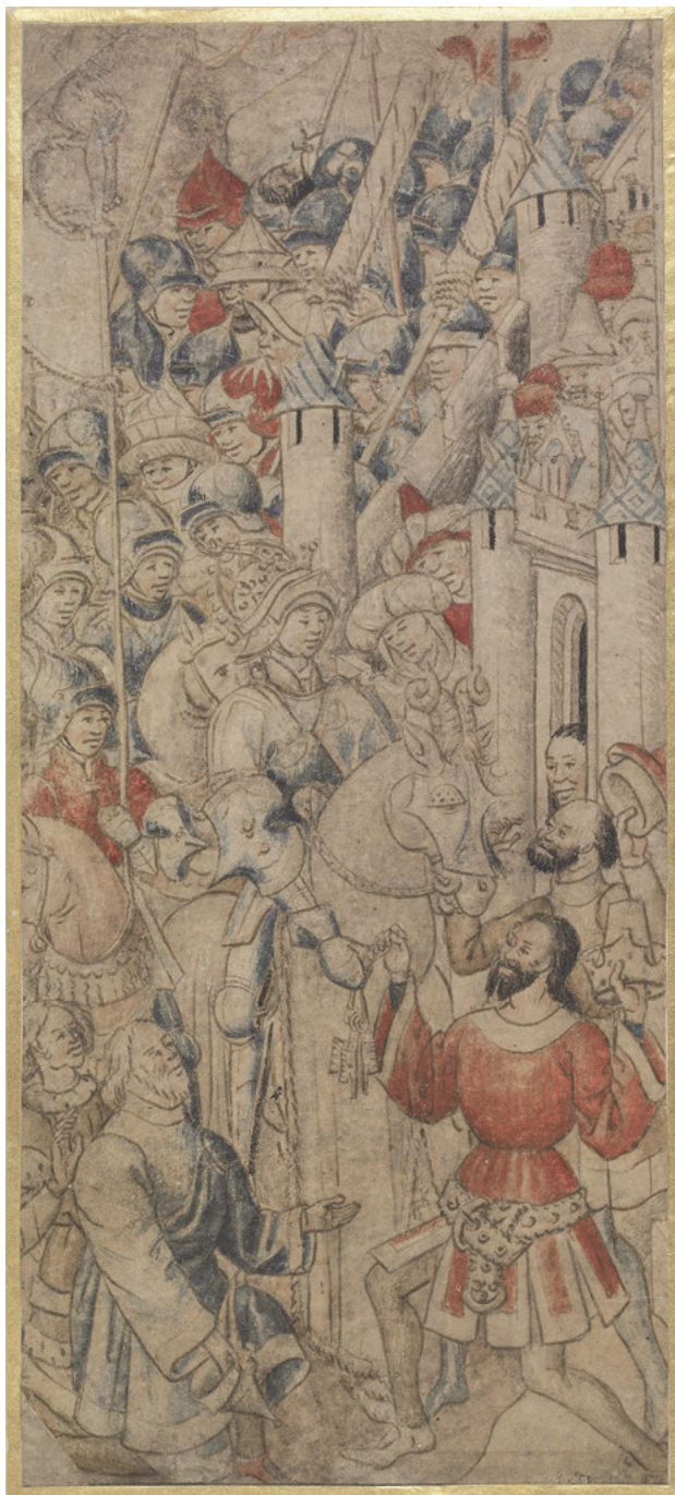
Abb. 33: Der triumphale Einzug Alexanders in Babylon, Zeichnung, um 1460, London, British Museum, Inv. Nr. 1895,0915.893.a.