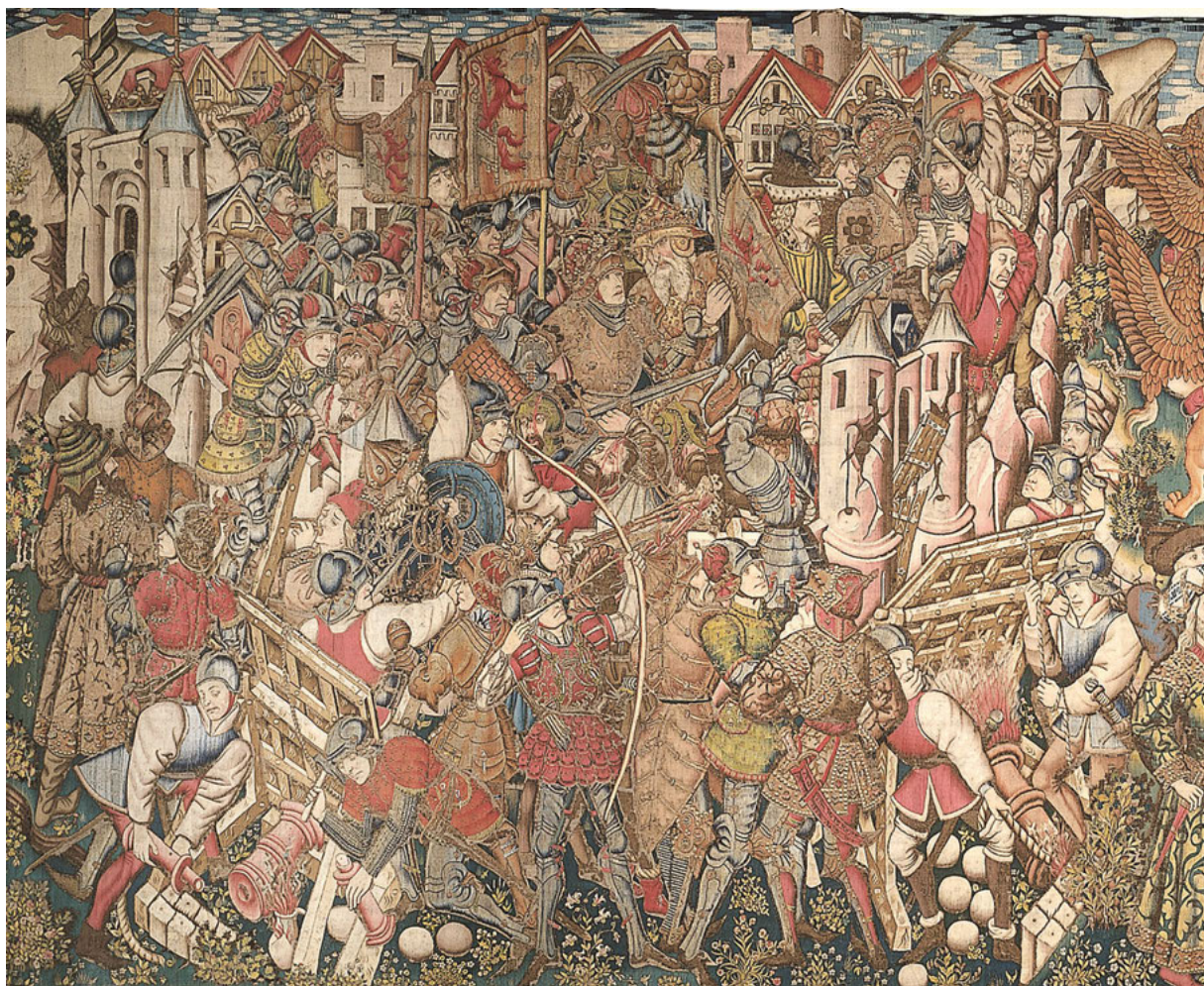
Abb. 38: Die Abenteuer Alexanders im Orient, Tapiserie, um 1460, Palazzo del Principe, Sammlung Doria-Pamphilj, Genua.