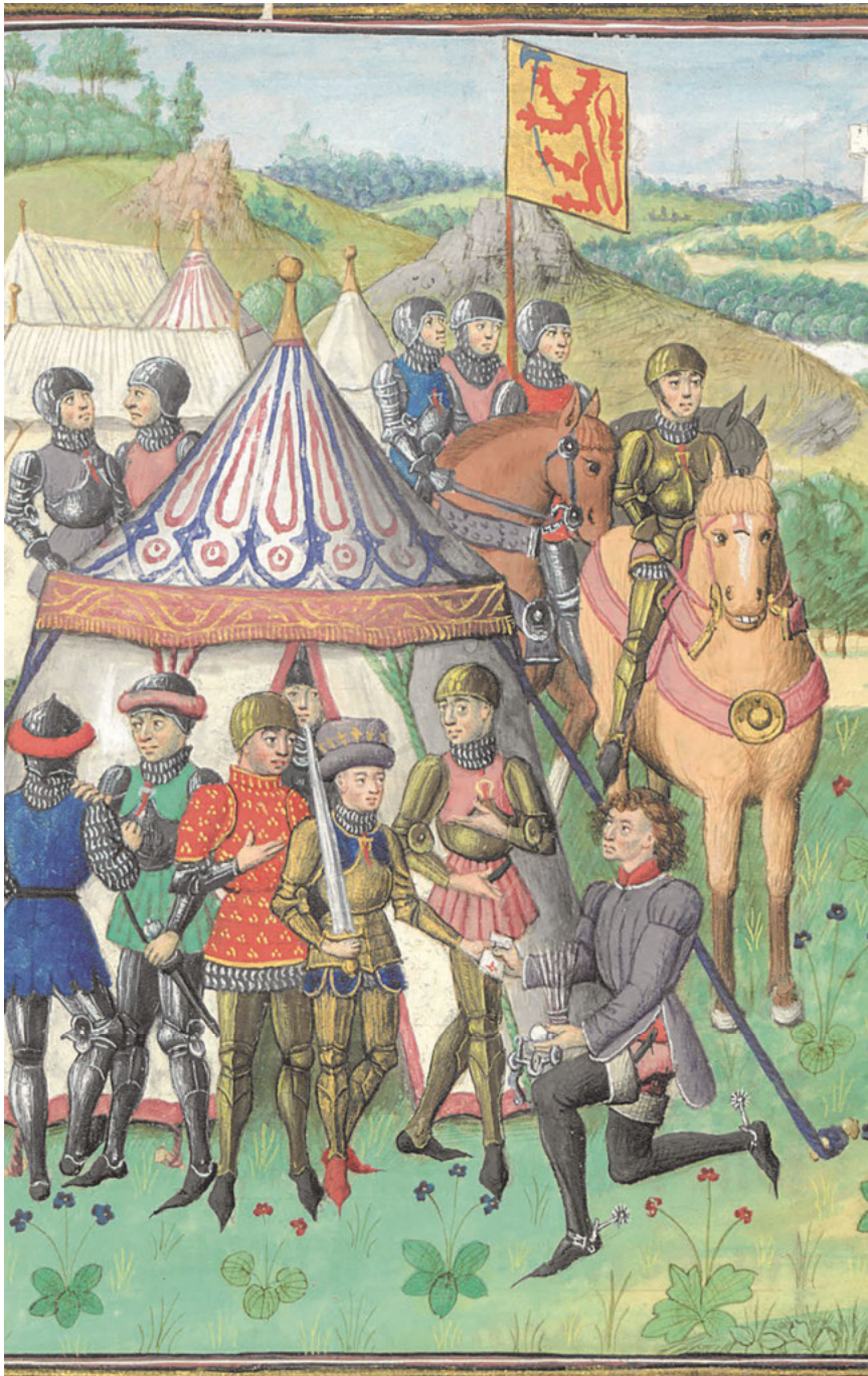
Abb. 7: Alexander empfängt eine Botschaft des persischen Königs Dareios (Ausschnitt), Jean Wauquelin: Les Faits et les Conquestes d'Alexandre le Grand , 1448, Bibliothèque nationale de France, Inv. Nr. ms. Fr. 9342, Fol. 23 v .