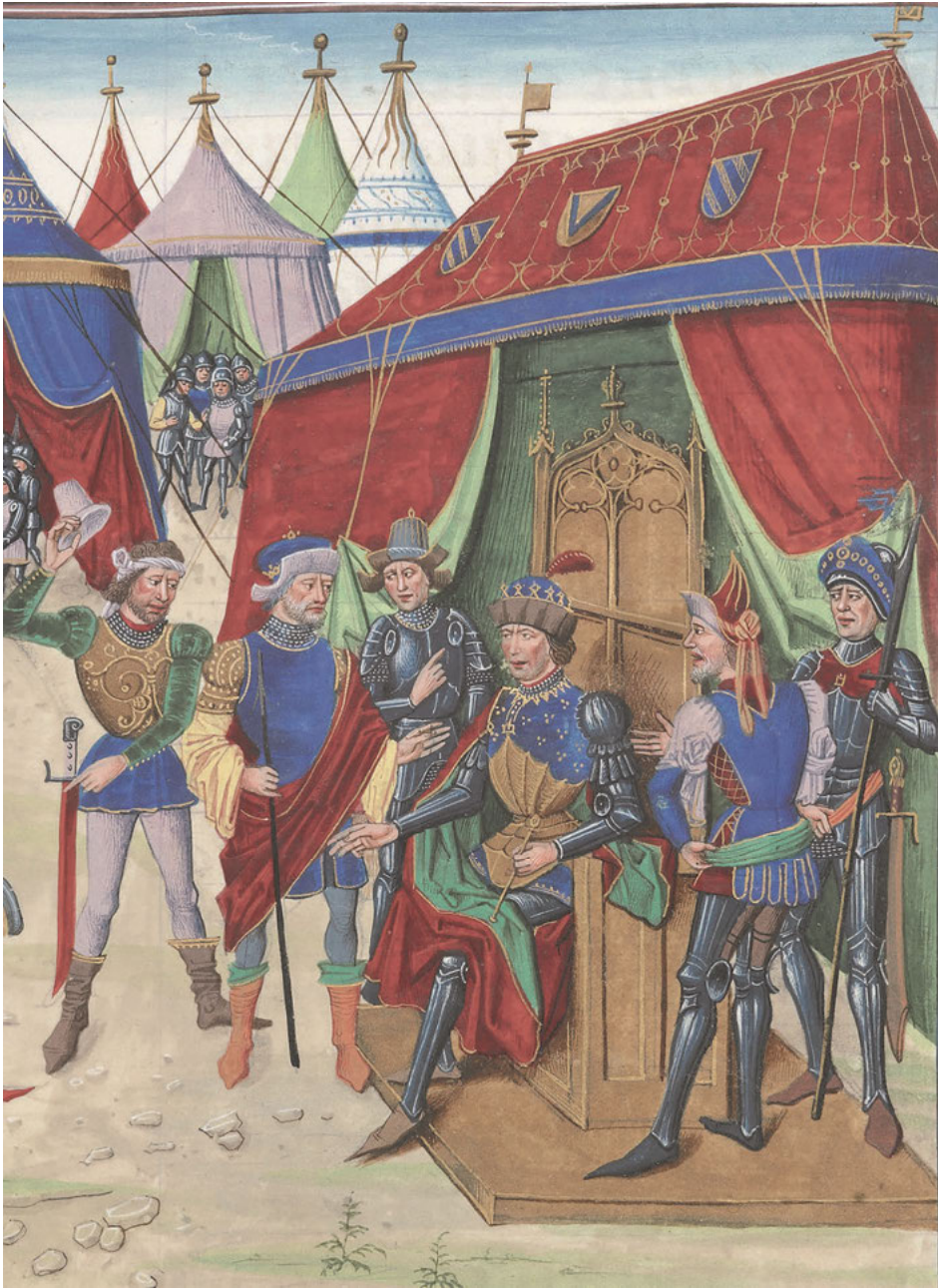
Abb. 12: Alexander vor seinem Zelt (Ausschnitt), Vasco de Lucena: Les Faictz et Gestes d'Alexandre le Grand , um 1470, Bibliothèque nationale de France, Paris, Inv. Nr. ms. Fr. 22547, Fol. 180r.