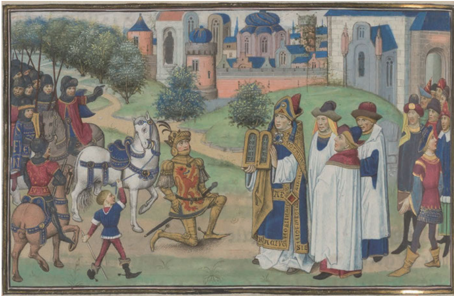
Abb. 8: Alexander trifft auf jüdische Schriftgelehrte, Jean Wauquelin: Les Faicts et les Conquestes d'Alexandre le Grand , 1467, Petit Palais, Musée des Beaux-Arts de la Ville de Paris, Paris, Inv. Nr. ms. Dutuit 456, Fol. 140 v .

rung als Gott bei den Persern 137 ergänzt wird, abwendet. Der Autor lässt Alexander selbst die Apotheose seiner Person in Form des Psalmes 115 untersagen und betonen, dass er und seine Frau wie die Anwesenden „ morteulz et corruptibles “ 138 seien.