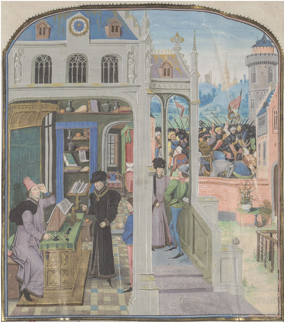
Abb. 1: Philipp der Gute überwacht die Anfertigung der Histoire de Charles Martel et de ses successeurs , David Aubert: Histoire de Charles Martel et de ses successeurs , 1463, Bibliothèque royale de Belgique, Brüssel, Inv. Nr. ms. 6, Fol. 9 r .

bevor er diese für die Illumination und Aufnahme in die fürstliche Bibliothek empfahl. 8