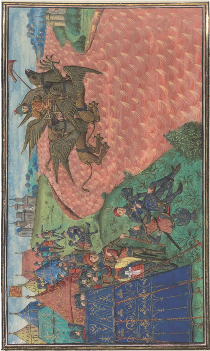
Abb. 18: Alexanders Luftreise, Jean Wauquelin: Les Faits et les Conquestes d'Alexandre le Grand , 1467, Petit Palais, Musée des Beaux-Arts de la Ville de Paris, Inv. Nr. ms. Dutuit 456, Fol. 257.