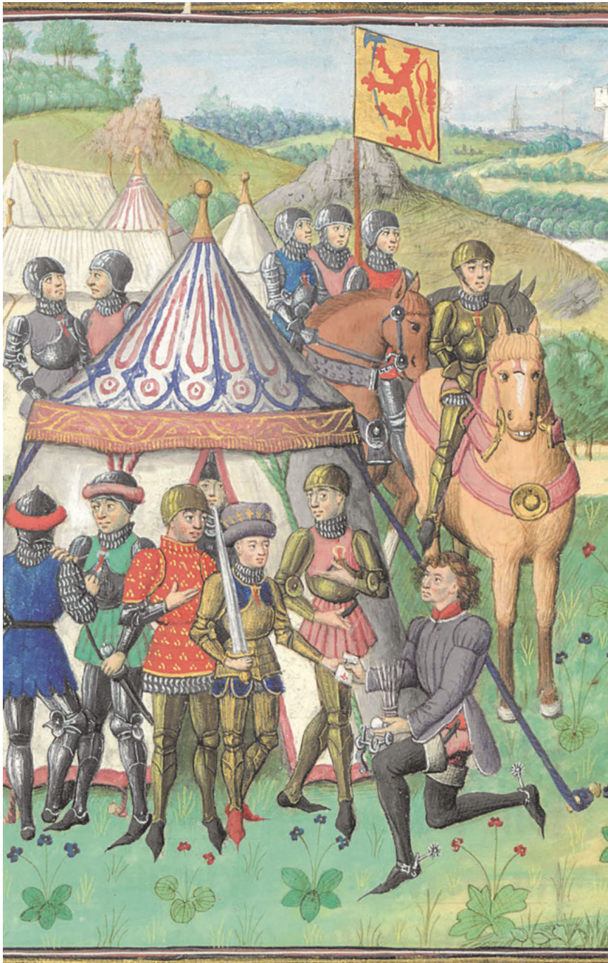
Abb. 7: Alexander empfängt eine Botschaft des persischen Königs Dareios (Ausschnitt), Jean Wauquelin: Les Faits et les Conquestes d'Alexandre le Grand , 1448, Bibliothèque nationale de France, Inv. Nr. ms. Fr. 9342, Fol. 23 v .