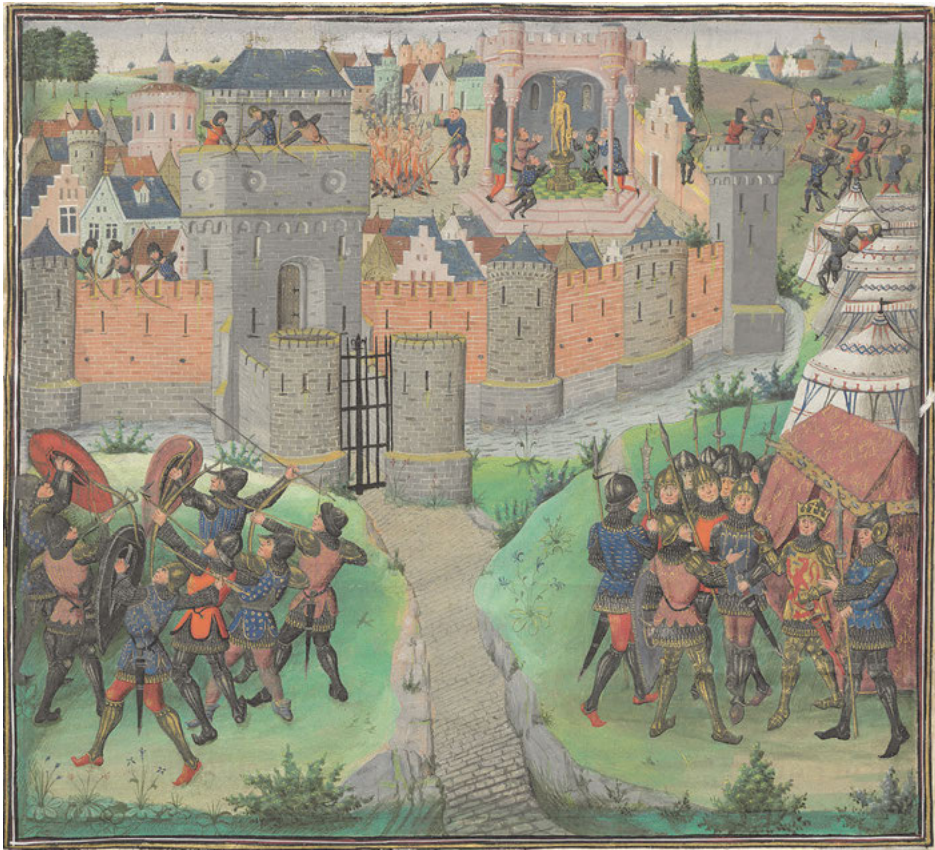
Abb. 6: Alexander überwacht die Schlacht um Babylon, Jean Wauquelin: Les Faicts et les Conquestes d'Alexandre le Grand , 1448, Bibliothèque nationale de France, Paris, Inv. Nr. ms. Fr. 9342, Fol. 194 v .

Ehrgefühl, das sich im Rahmen ritterlich-höfischer Interpretationen bewegt. Jener rächt nicht nur den Tod seines Vaters und die Bedrängnis seiner Mutter an Pausanias in Form eines turnierähnlichen Kampfes, sondern lässt seinen im Zweikampf besieigten Gegner Poros, Herrscher von Indien, ehrenhaft begraben. Er veranlasst sogar, dass die Mörder seines Feindes, des Regenten der Perser, Dareios, hingerichtet werden. 117 Diese Tendenzen setzen sich in der Darstellung der weisen und gerechten Herrschaft Alexanders fort, wobei dies nicht zuletzt der in Form einer Interpolation aus der Alexandreide des Gautier de Châtillon akzentuierten Ausbildung des Helden „ en toute science liberale et morale “ 118 geschuldet zu sein scheint. Er