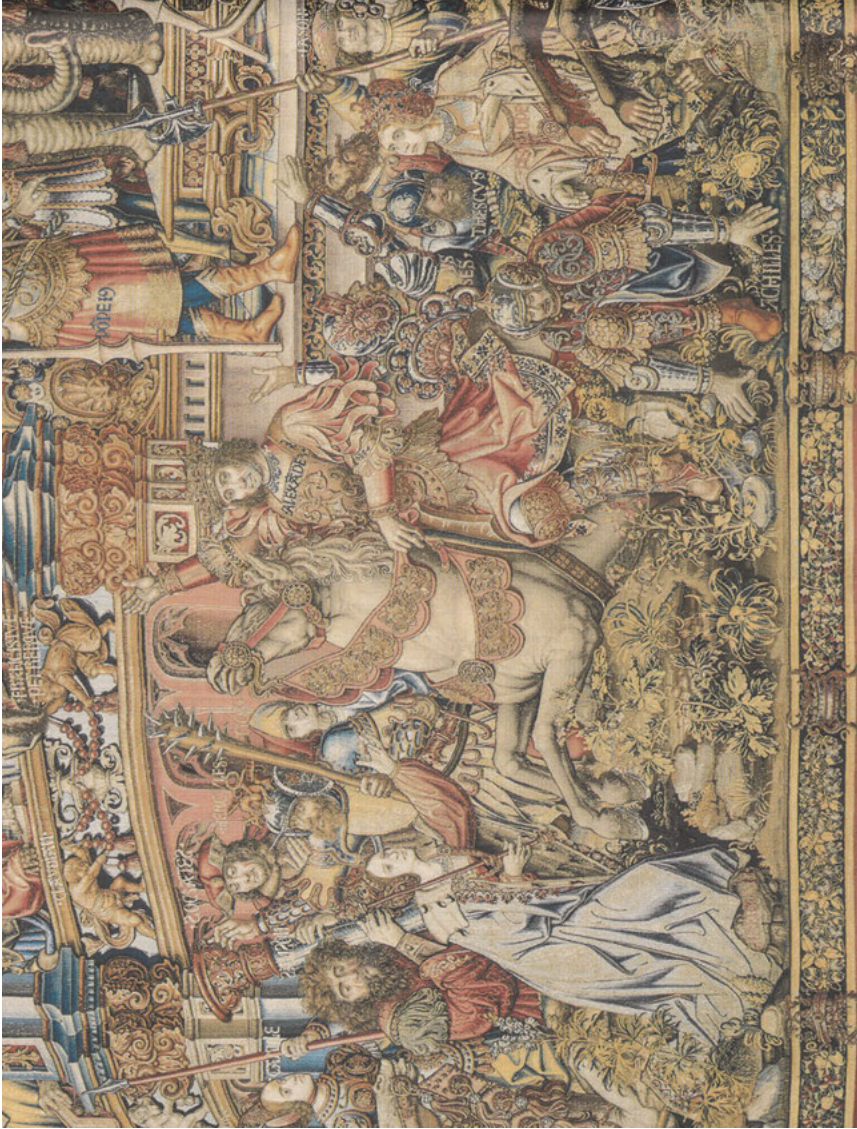
Abb. 35: Alexander reitet auf Bukephalos, Fama (Ausschnitt), Tapisserie, 1520–1523, Museo de Tapices, Palacio Real de la Granja de San Ildefonso, Segovia, Inv. Nr. 10026280.