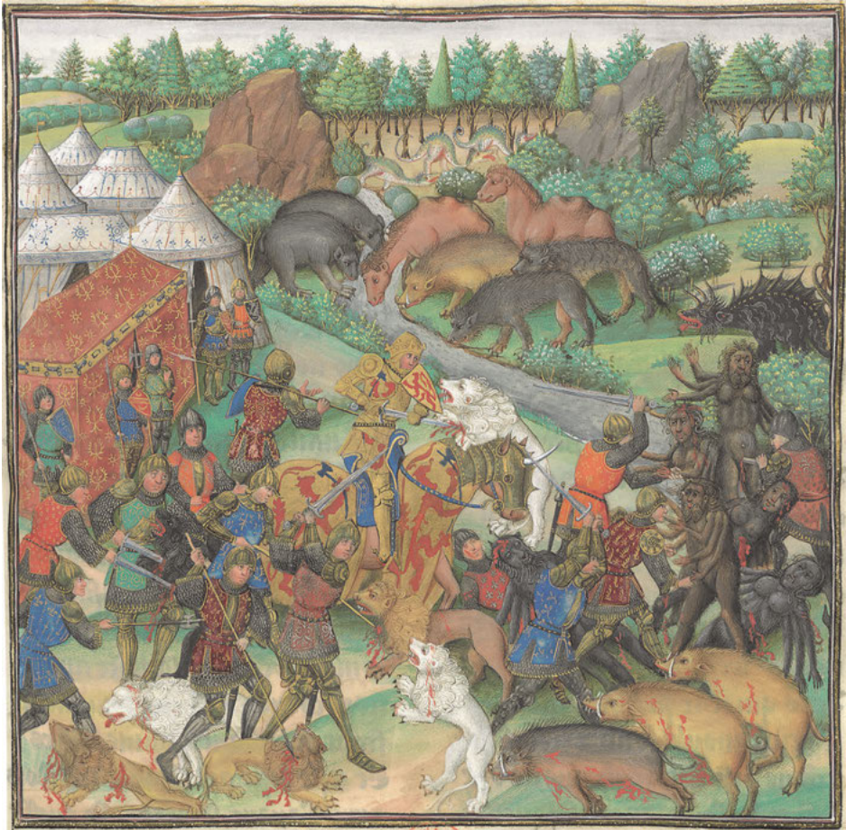
Abb. 5: Alexander kämpft gegen Ungeheuer, Jean Wauquelin: Les Faicts et les Conquestes d'Alexandre le Grand , 1448, Bibliothèque nationale de France, Paris, Inv. Nr. ms. Fr. 9342, Fol. 142 r .

Preux bei, welche explizit als besonders fähige Krieger ausgezeichnet werden (vgl. Abb. 7). 114 Darüber hinaus scheint Jean Wauquelin bemüht, diese Zuschreibung mithilfe einer Reduktion der eigentlichen Kampfhandlungen 115 auf der diegetischen Ebene um weitere positive Eigenschaften anreichern zu wollen. So wird vielfach die Kampfbeschreibung direkt auf das erfolgreiche Ende des Kampfes fokussiert. 116 Damit wollte Jean Wauquelin wohl eine eindimensionale Beurteilung Alexanders vermeiden, die er zudem durch die Betonung der persönlichen Qualitäten des Helden auffängt. Der Autor attribuiert Alexander ein ausgeprägtes