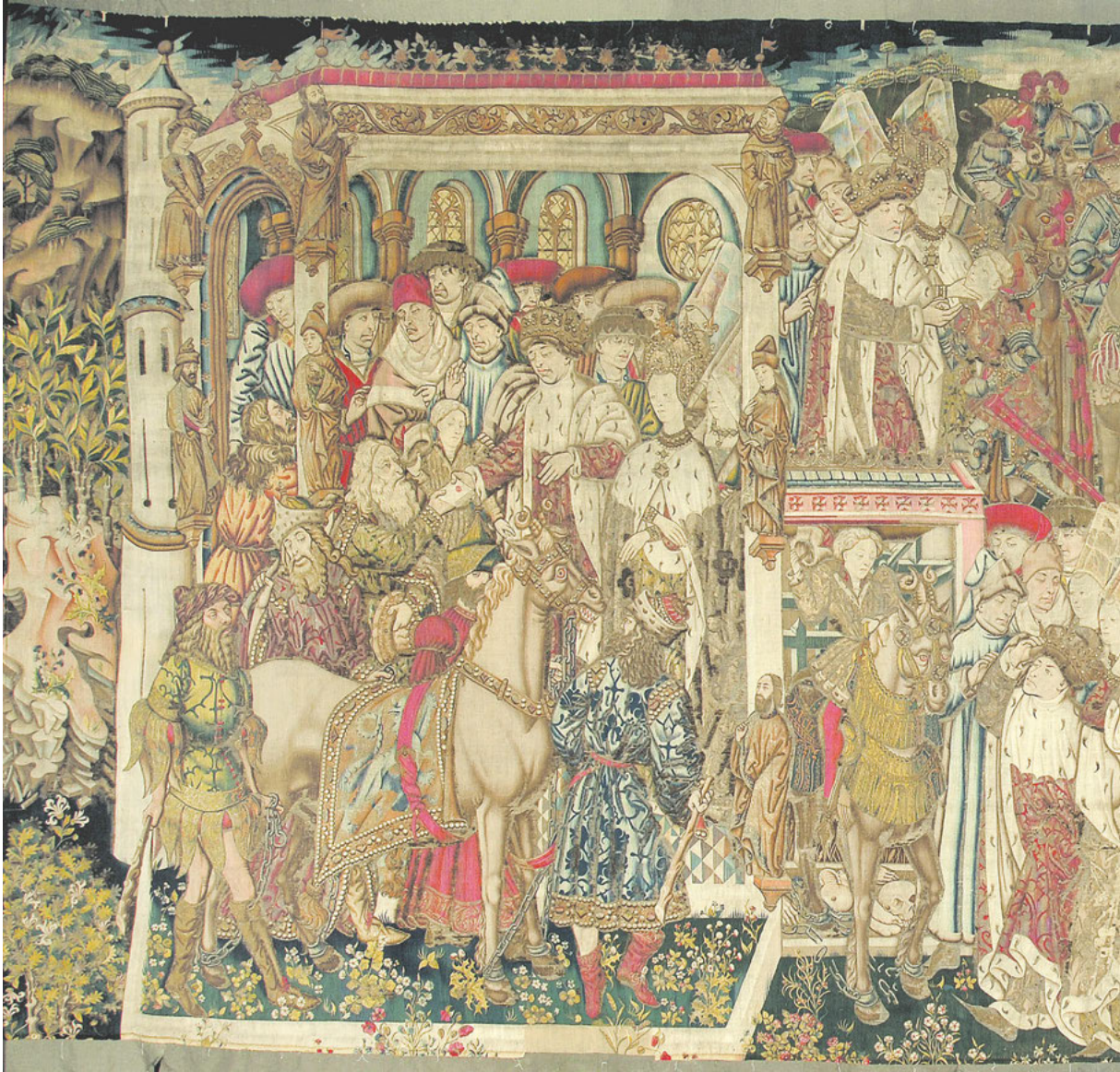
Abb. 37: Die Jugend Alexanders, Tapisserie, um 1460, Palazzo del Principe, Sammlung Doria-Pamphilj, Genua.