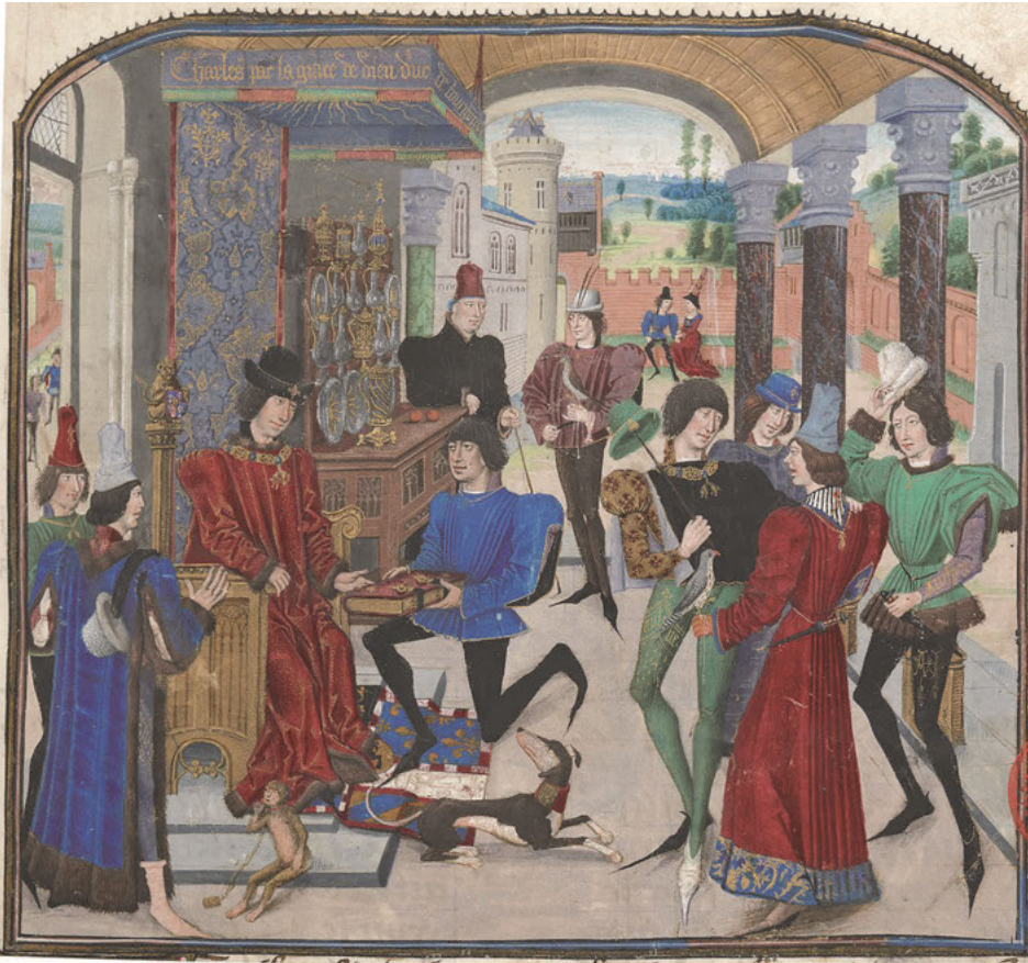
Abb. 11: Vasco de Lucena überreicht Karl dem Kühnen sein Werk, Vasco de Lucena: Les Faictz et Gestes d'Alexandre le Grand , um 1470, Bibliothèque nationale de France, Paris, Inv. Nr. ms. Fr. 22547, Fol. 1 r .

vertus et euvres chevalereuses par le monde uniuers [...] si avant manifestes “ geworden, so dass die ursprünglich angedachte Unterrichtung des Herzogs „ vous estre superflue “. Vielmehr gelange er nun zu dem Schluss, wenn Alexander „ retournast en nostre siecle vous mon tresredoubte seigneur deuriez estre exemple dalexandre “. 192 Dieser Deutung, die der portugiesische Literat als Ergebnis seiner Wahrnehmung der zahlreichen Kriege Karls in den entsprechenden Jahren darlegt, kann somit bereits zu Beginn des Textes ein signifikanter Widerspruch zu der äußerst positiven Darstellung des Helden bei Jean Wauquelin attestiert werden.