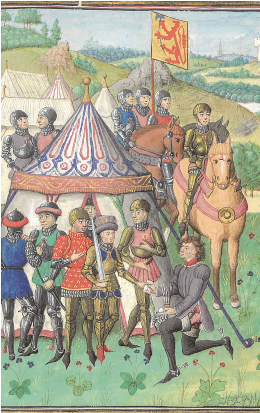
Abb. 7: Alexander empfängt eine Botschaft des persischen Königs Dareios (Ausschnitt), Jean Wauquelin: Les Faicts et les Conquestes d'Alexandre le Grand , 1448, Bibliothèque nationale de France, Inv. Nr. ms. Fr. 9342, Fol. 23 v .