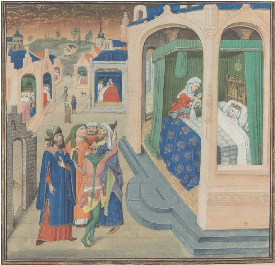
Abb. 9: Die Geburt Alexanders, Jean Wauquelin: Les Faicts et les Conquestes d'Alexandre le Grand , 1467, Petit Palais, Musée des Beaux-Arts de la Ville de Paris, Paris, Inv. Nr. ms. Dutuit 456, Fol. 10 r .

venir a quelque mal fin . 154 Wird im Folgenden „ Fortune [...] instable “ 155 für den frühen Tod Alexanders verantwortlich gemacht, so kann dies dementsprechend nicht einer Rückkehr in das ursprüngliche Heidentum des Helden, sondern vielmehr der Erklärungsnot Jean Wauquelines für das vorzeitige Ableben eines derart frommen Helden zugeschrieben werden. 156 Überantwortet Alexander somit seine „ ame a Dieu son Createur “, besteht für den Autor „ nulle doubte, [...] qu'il estoit amez