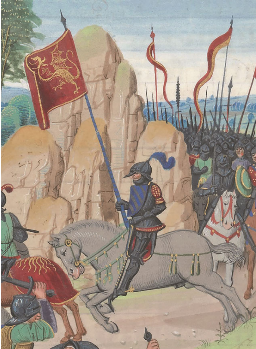
Abb. 15: Alexanders Wappen (Ausschnitt), Vasco de Lucena: Les Faictz et Gestes d'Alexandre le Grand , um 1470, Bibliothèque nationale de France, Paris, Inv. Nr. ms. Fr. 22547, Fol. 94 r .

Alexanders des Großen unmittelbar auf die Heroisierung Alexanders unter den Zeitgenossen Karls des Kühnen auswirkte und jener tatsächlich als „ ander alexander “ 239 zu verstehen ist.