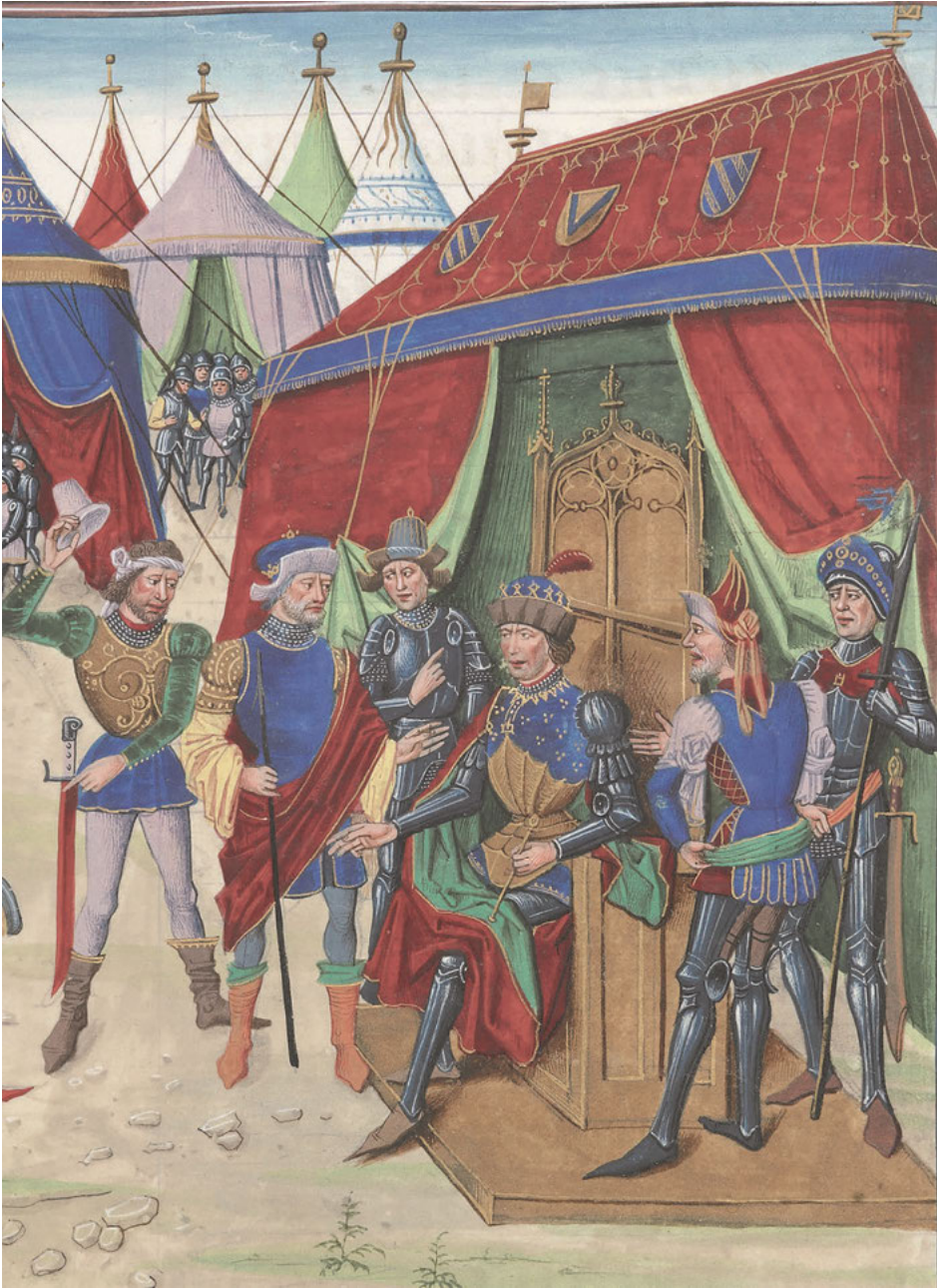
Abb. 12: Alexander vor seinem Zelt (Ausschnitt), Vasco de Lucena: Les Faictz et Gestes d'Alexandre le Grand , um 1470, Bibliothèque nationale de France, Paris, Inv. Nr. ms. Fr. 22547, Fol. 180r.