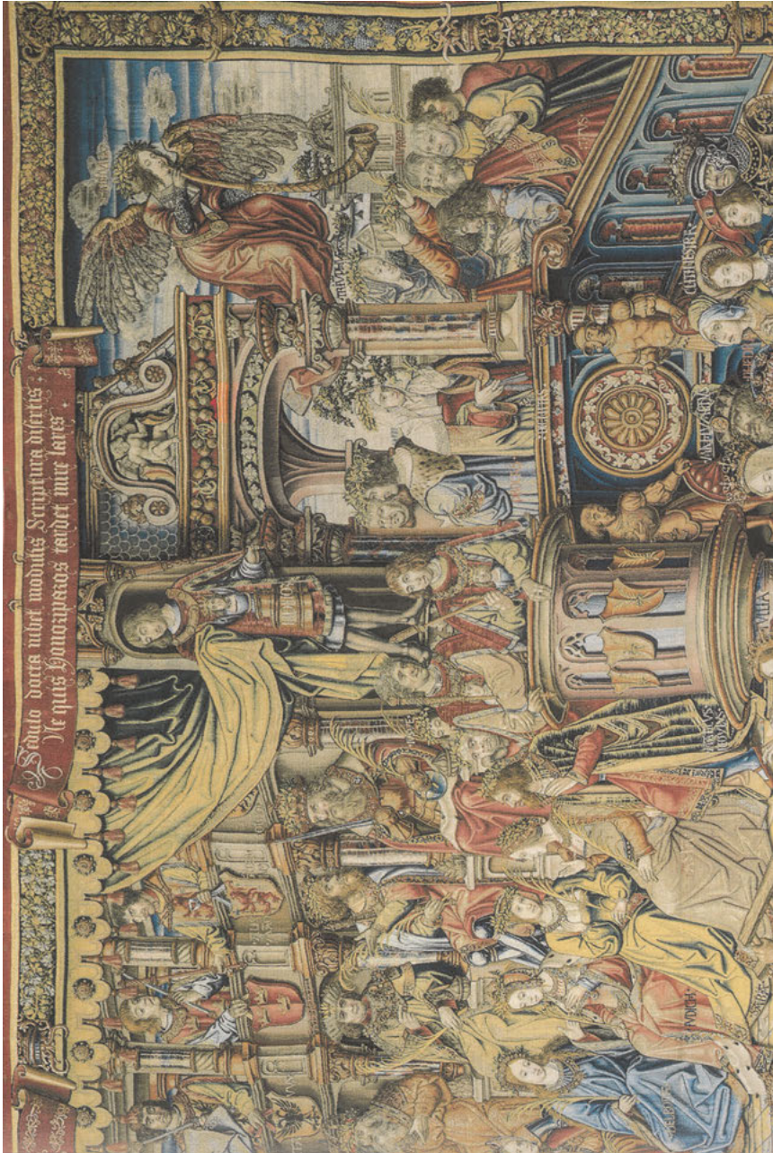
Abb. 34: Alexander im Tribunal der Ehre, Honor (Ausschnitt), Tapisserte, um 1520, Museo de Tapices, Palacio Real de la Granja de San Ildefonso, Segovia, Inv. Nr. 10026277.