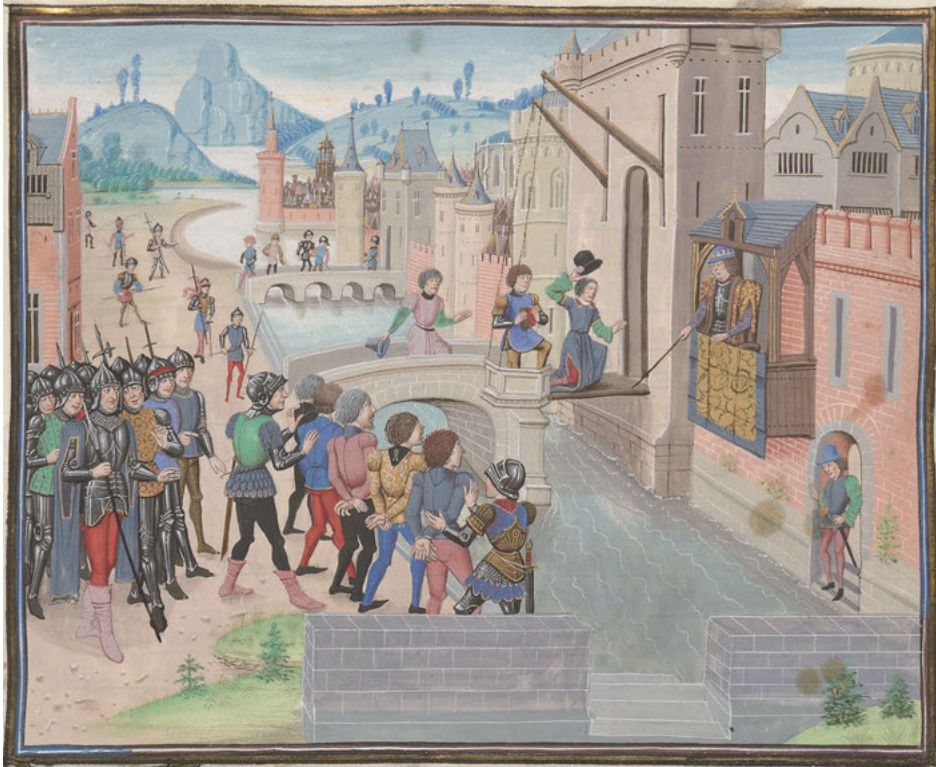
Abb. 16: Alexander bestraft Aufständische, Vasco de Lucena: Les Faictz et Gestes d'Alexandre le Grand , um 1470, Bibliothèque nationale de France, Paris, Inv. Nr. ms. Fr. 22547, Fol. 254 v .

cher im Streit mit seinem Vater nur knapp dessen geworfenem Schwert entrinnt. 42 Dadurch tritt neben die bereits bestehende homonymische Relation beider Vaterfiguren 43 eine besonders auf den Herzog zugeschnittene Ebene, denn auch Philipp der Gute „ tira une dague [...] et le [Karl] en eut feru s'il ne se en fut fuy “. 44 Hinzu kommt, dass sich nach den negativen Veränderungen des Helden Parallelen in der Herrschaftspraxis des Herzogs und Alexanders ausmachen lassen, wozu etwa der bereits angeführte Umgang mit Aufständischen zu zählen ist. Ist die Bestrafung der rebellierenden Makedonen zwar der Darstellung des Quintus Curtius entnommen, so fügt Vasco de Lucena hinzu, Alexander „ les fist noyer en ung fleuve “ 45 (vgl. dazu auch Abb. 16). Diese Szenerie scheint unmittelbar an die Rache angepasst, die Karl an den aufständischen Bürgern Lüttichs in Flandern nahm. Deren Anführer muss-