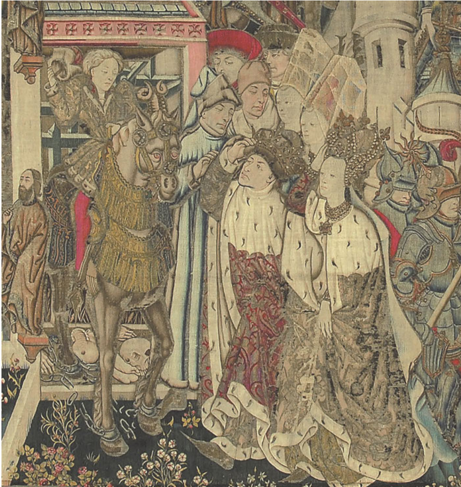
Abb. 19: Der junge Alexander bezwingt vor seinen staunenden Eltern Bukephalos, Die Jugend Alexanders (Ausschnitt), Tapiserie, um 1460, Palazzo del Principe, Sammlung Doria-Pamphilj, Genua.

ein, da die Wiederverwendung der Kartons bzw. Vorlagen zur Herstellung weiterer Teppiche für andere Fürstnhäuser üblich war und nur der Kauf der Vorlagen vor der Fertigung von Repliken schützte. 133 Wir wissen aber nur, dass Philipp der Gute zwar die patrons für seine Histoire de Gédéon erwarb, 134 für die Entwürfe zu der Alexanderserie ist aber nichts dergleichen bekannt. So erstand auch der englische König Eduard IV. um 1470 im Zuge der Hochzeit Karls und Margaretas einen Alexandertapiseriezyklus aus der Fertigung Greniers. Da dieser Handel wohl