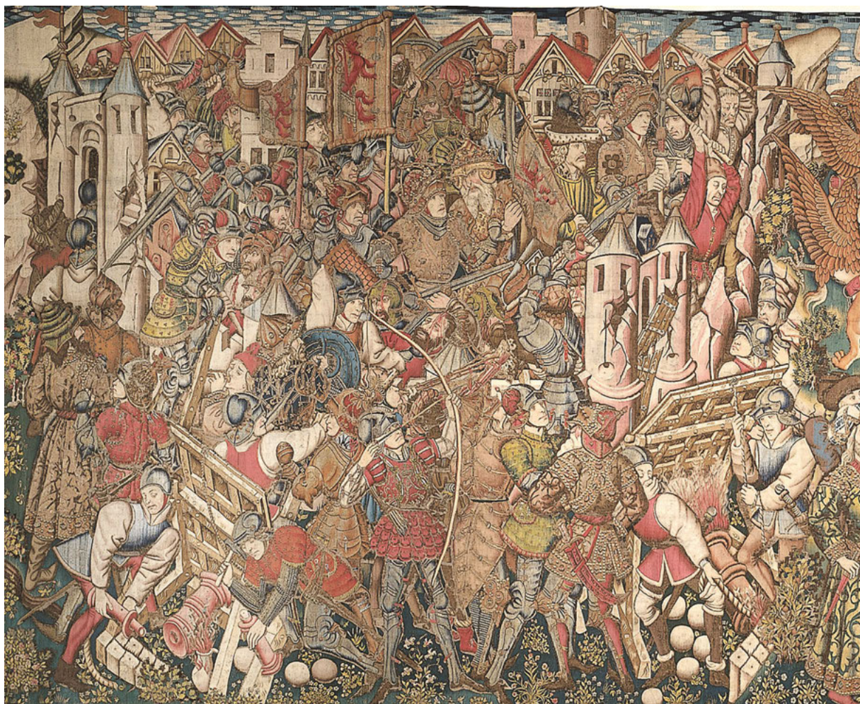
Abb. 38: Die Abenteuer Alexanders im Orient, Tapissérie, um 1460, Palazzo del Principe, Sammlung Doria-Pamphilj, Genua.