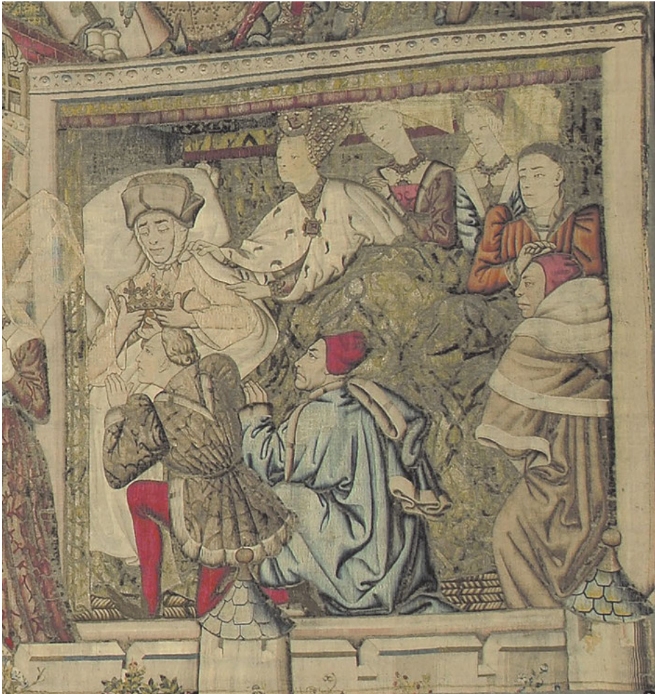
Abb. 25: Der sterbende Philipp von Makedonien krönt Alexander, Die Jugend Alexanders (Ausschnitt), Tapissierie, um 1460, Palazzo del Principe, Sammlung Doria-Pamphilj, Genua.

Königsinsignien aufweist. 172 Philipp trug bei seinem Einzug in die Stadt einen standesgemäßen Herzogshut, der, obgleich „ de pris non extimable “ 173 mit einer Vielzahl von Edelsteinen besetzt, 174 keine Krone war. Dennoch suggerierte die Präsentation Alexanders zumindest eine symbolische Krönung des Herzogs beziehungs-