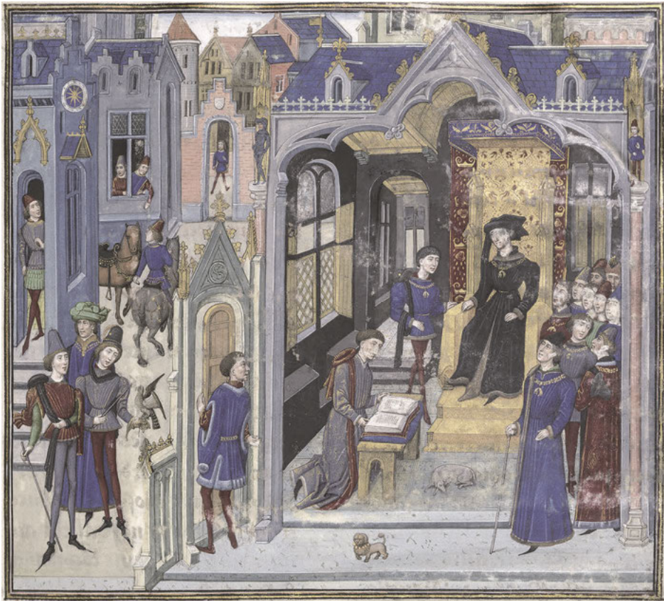
Abb. 2: Philipp der Gute und Mitglieder seines Hofes lauschen der Rezitation der Chroniques de Hainaut , Jean Wauquelin: Chroniques de Hainaut , 2. Bd., um 1450, Bibliothèque royale de Belgique, Brüssel, Inv. Nr. ms. 9243, Fol. 1 r .

Die dabei gelesene Literatur mag zwar auf individuelle Weise als magistra vitae sowie einer gewissen Nostalgie bezüglich der geschilderten vergangenen Zeiten gedient haben, wie dies in der Forschung lange Zeit angenommen wurde, 33 jedoch erfolgten die Lesungen nicht ausschließlich aufgrund einer rein an alten Erzählungen interessierten Gesinnung der Herzöge. Dafür spricht, dass die entsprechenden Heroendarstellungen bemerkenswerte Analogien zu den zeitgenössischen Personen und Situationen am burgundischen Hof aufweisen. So nutzt etwa der picardische Kalligraphist und Übersetzer Jean Wauquelin 34 im Prolog des ersten Buches seiner Faits et Conquestes d'Alexandre le Grand gleiche Attribute für die