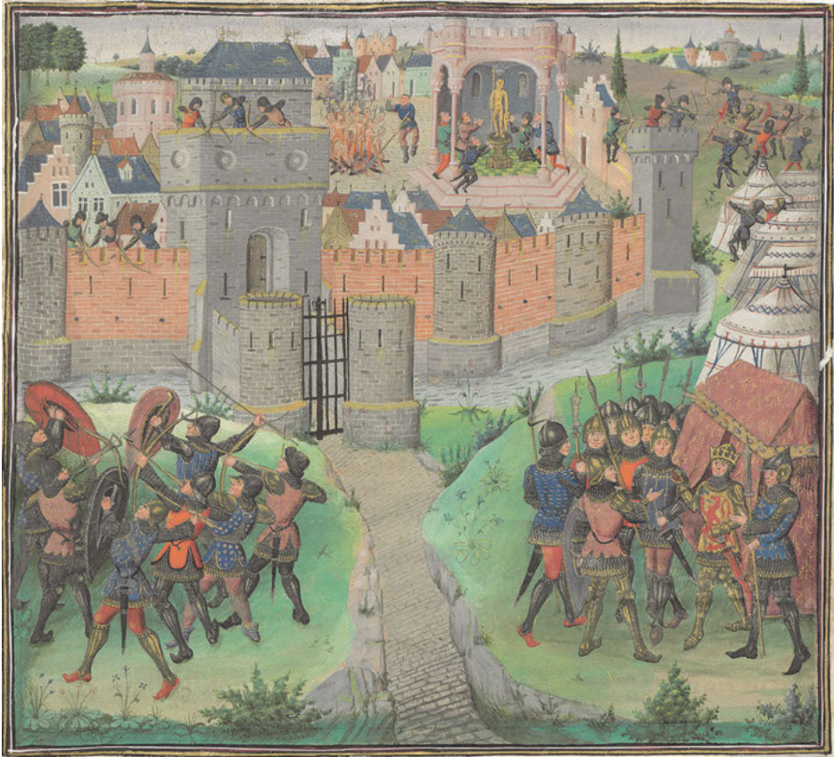
Abb. 6: Alexander überwacht die Schlacht um Babylon, Jean Wauquelin: Les Faicts et les Conquestes d'Alexandre le Grand , 1448, Bibliothèque nationale de France, Paris, Inv. Nr. ms. Fr. 9342, Fol. 194 v .

Ehrgefühl, das sich im Rahmen ritterlich-höfischer Interpretationen bewegt. Jener rächt nicht nur den Tod seines Vaters und die Bedrängnis seiner Mutter an Pausanias in Form eines turnierähnlichen Kampfes, sondern lässt seinen im Zweikampf besieigten Gegner Poros, Herrscher von Indien, ehrenhaft begraben. Er veranlasst sogar, dass die Mörder seines Feindes, des Regenten der Perser, Dareios, hingerichtet werden. 117 Diese Tendenzen setzen sich in der Darstellung der weisen und gerechten Herrschaft Alexanders fort, wobei dies nicht zuletzt der in Form einer Interpolation aus der Alexandreide des Gautier de Châtillon akzentuierten Ausbildung des Helden „ en toute science liberale et morale “ 118 geschuldet zu sein scheint. Er