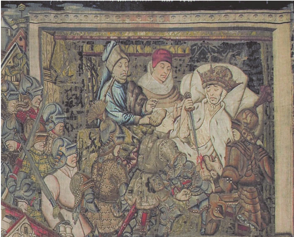
Abb. 21: Der sterbende Philipp von Makedonien tötet seinen Widersacher Pausanias, Die Jugend Alexanders (Ausschnitt), Tapiserie, um 1460, Palazzo del Principe, Sammlung Doria-Pamphilj, Genua.

hen, 137 ist deren Zusammengehörigkeit stark umstritten. 138 So muss eine Differenzierung bezüglich der inhaltlichen Thematiken vorgenommen werden, da die petit patrons im Vergleich zu den Tapisseries eine realistischere Darstellung Alexanders im Kampf mit historisch belegten Herrschern zeigen. 139 Wird ferner zwar gleichermaßen die Überlegenheit Alexanders in der Kriegsführung in zahlreichen Schlachten präsentiert – so zeigen etwa die Berner Entwürfe den Kampf und Sieg Alexanders über Poros und Dareios, vgl. dazu Abb. 22 –, manifestieren sich jedoch der Verrat Antipaters sowie der Tod Alexanders in unmittelbarem Zusammenhang mit dessen Krönung zum persischen Großkönig (vgl. Abb. 23). Diese