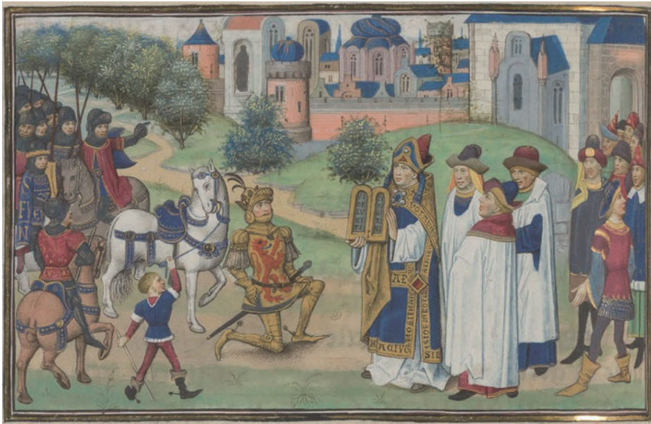
Abb. 8: Alexander trifft auf jüdische Schriftgelehrte, Jean Wauquelin: Les Faicts et les Conquestes d'Alexandre le Grand , 1467, Petit Palais, Musée des Beaux-Arts de la Ville de Paris, Paris, Inv. Nr. ms. Dutuit 456, Fol. 140 v .

rung als Gott bei den Persern 137 ergänzt wird, abwendet. Der Autor lässt Alexander selbst die Apotheose seiner Person in Form des Psalmes 115 untersagen und betonen, dass er und seine Frau wie die Anwesenden „ mortelz et corruptibles “ 138 seien.