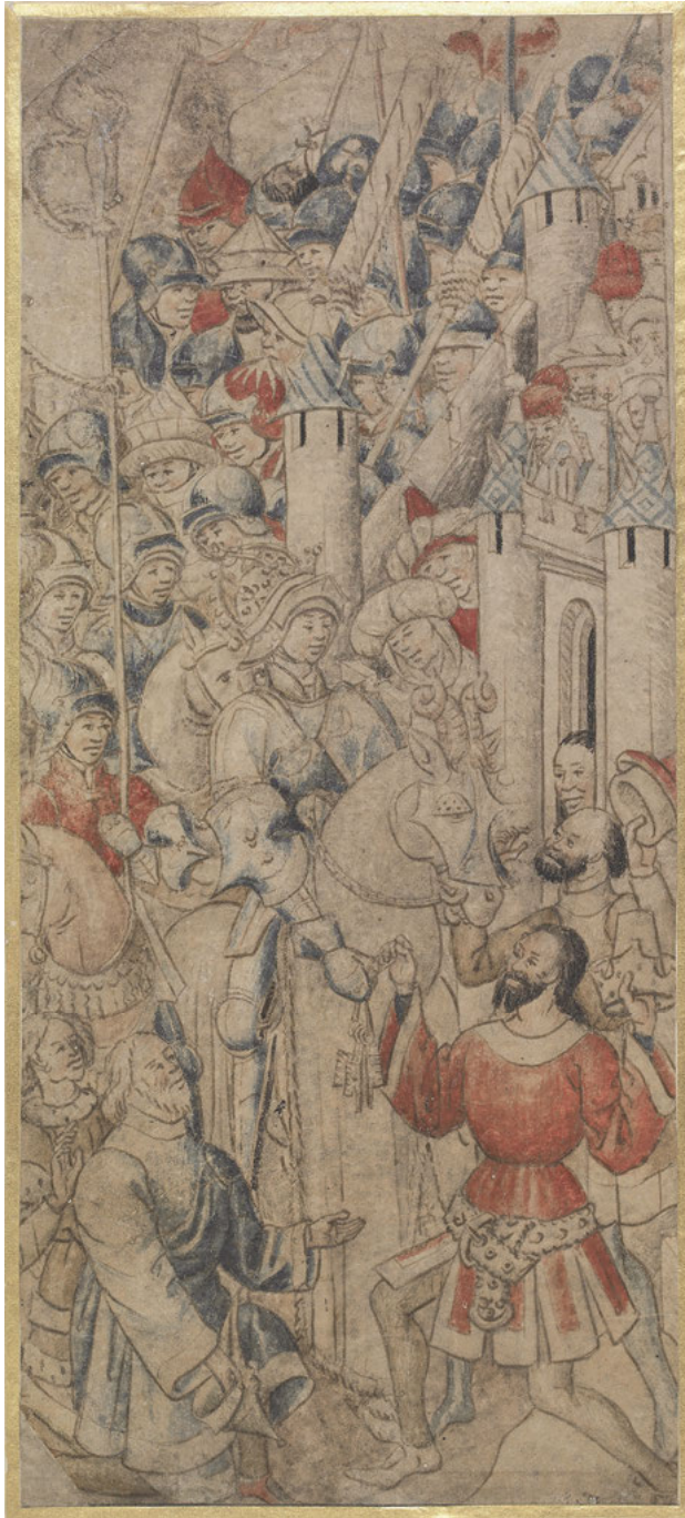
Abb. 33: Der triumphale Einzug Alexanders in Babylon, Zeichnung, um 1460, London, British Museum, Inv. Nr. 1895,0915. 893.a.