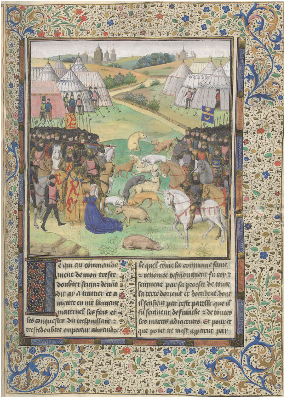
Abb. 10: Geschenk der Forés Carbonniere an die Dame Lirope, Jean Wauquelin: Les Faicts et les Conquestes d'Alexandre le Grand , 1448, Bibliothèque nationale de France, Paris, Inv. Nr. ms. Fr. 9342, Fol. 127 r .