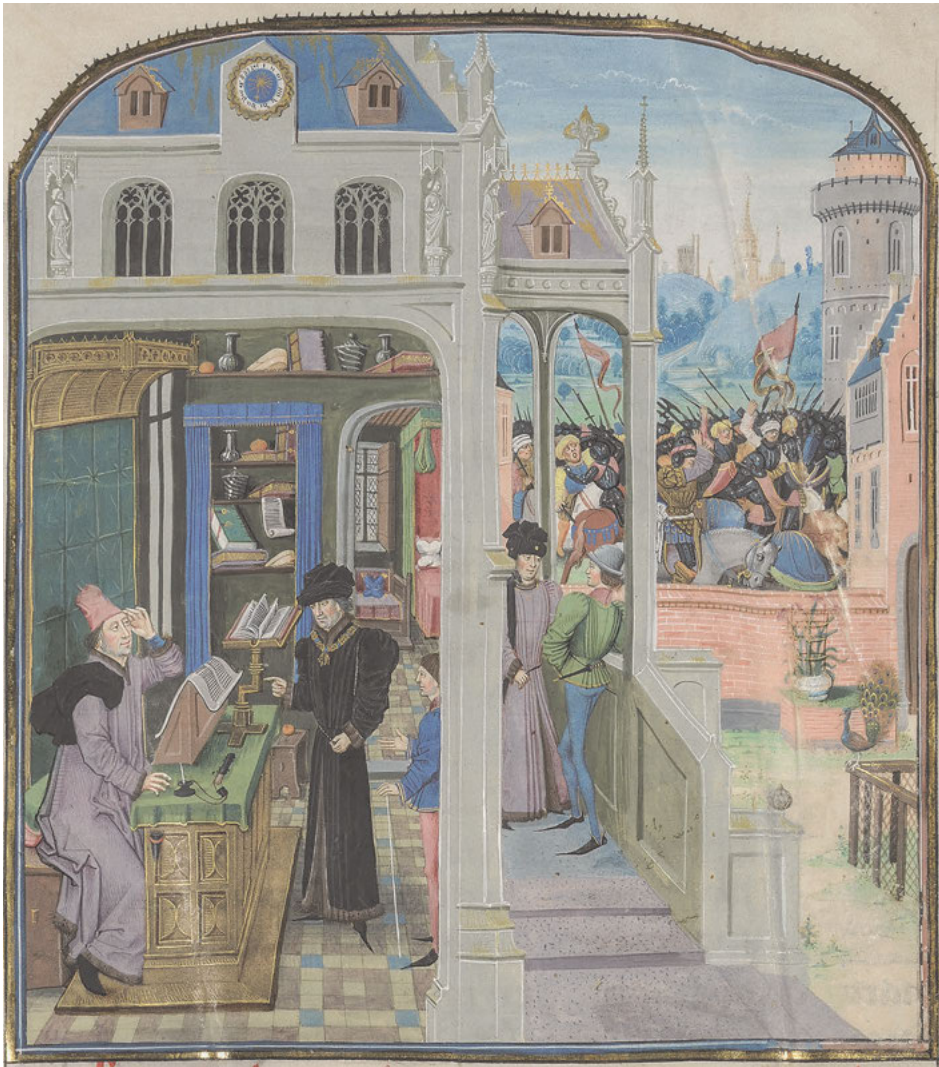
Abb. 1: Philipp der Gute überwacht die Anfertigung der Histoire de Charles Martel et de ses successeurs , David Aubert: Histoire de Charles Martel et de ses successeurs , 1463, Bibliothèque royale de Belgique, Brüssel, Inv. Nr. ms. 6, Fol. 9 r .

bevor er diese für die Illumination und Aufnahme in die fürstliche Bibliothek empfahl. 8