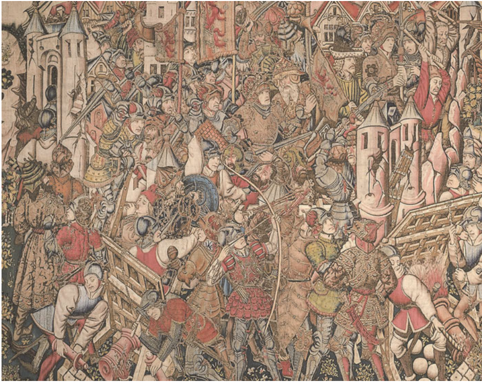
Abb. 32: Eroberung und Zerstörung einer Stadt durch Alexanders Heer, Die Abenteuer Alexanders im Orient (Ausschnitt), Tapiserie, um 1460, Palazzo del Principe, Sammlung Doria-Pamphilj, Genua.

er „ en presence d'eulx [...] coppa et deschira à son plaisir “ 216 sondern auch wie Alexander deren Mauern zerstören, die Stadt plündern und niederbrennen lassen, wie dies ebenso in Dinant 1466 217 und kurz vor dem Zusammentreffen mit den Gentern in Lüttich geschehen war. 218 Die große Präsenz dieser Ereignisse in der Volkspoesie und nicht zuletzt die darin mehrfach formulierte Warnung an die burgundischen Städte, es Lüttich und Dinant nicht gleichzutun, lässt auf ein entsprechendes Verständnis der Vertreter Gents schließen. 219 Zugleich präsentierte