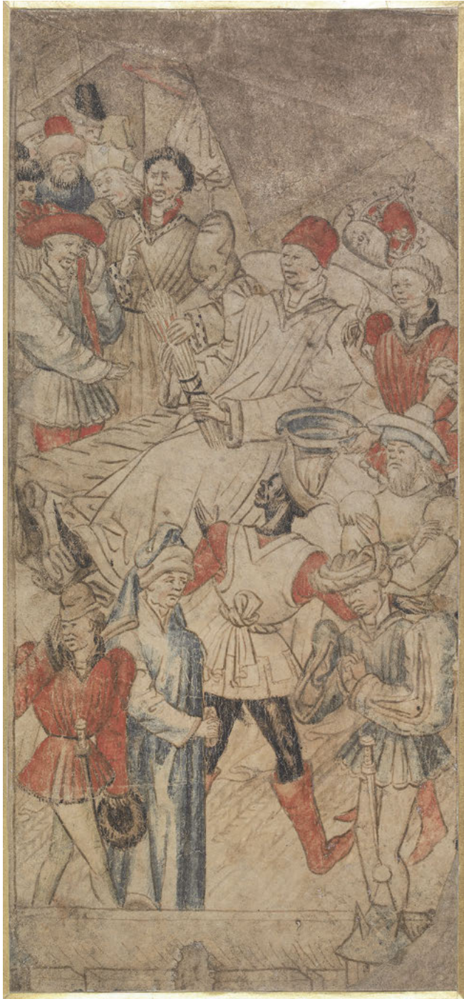
Abb. 29: Der Tod Alexanders, Zeichnung, um 1460, London, British Museum, Inv. Nr. 1895,0915.893.b.