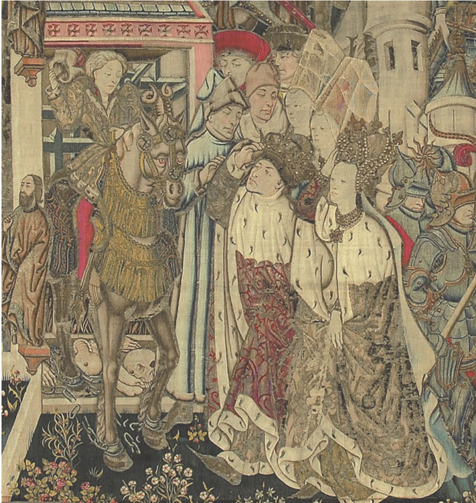
Abb. 19: Der junge Alexander bezwingt vor seinen staunenden Eltern Bukephalos, Die Jugend Alexanders (Ausschnitt), Tapiserie, um 1460, Palazzo del Principe, Sammlung Doria-Pamphili, Genua.