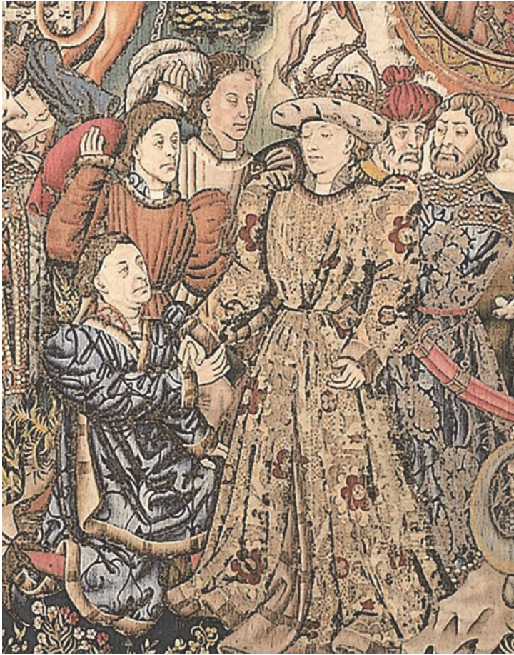
Abb.26: Alexander kehrt von seiner Luftfahrt zurück, Die Abenteuer Alexanders im Orient (Ausschnitt), Tapisserie, um 1460, Palazzo del Principe, Sammlung Doria-Pamphilj, Genua.

longuement en propos “. 178 Dies kann jedoch als fraglich eingestuft werden, da keine Quelle ein unmittelbar vergleichbares Zeugnis ablegt und ebenso ein entsprechendes Interesse des Königs in der Folgezeit kaum zutage trat. 179 Dennoch ist von einer Erwartungshaltung des Herzogs bezüglich eines Engagements Ludwigs