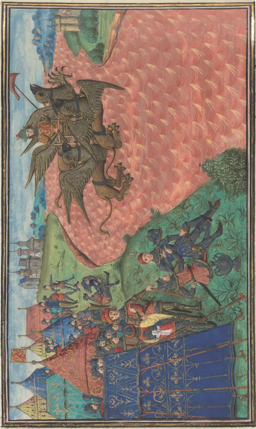
Abb. 18: Alexanders Luftreise, Jean Wauquelin: Les Faits et les Conquestes d'Alexandre le Grand , 1467, Petit Palais, Musée des Beaux-Arts de la Ville de Paris, Inv. Nr. ms. Dutuit 456, Fol. 257 v .