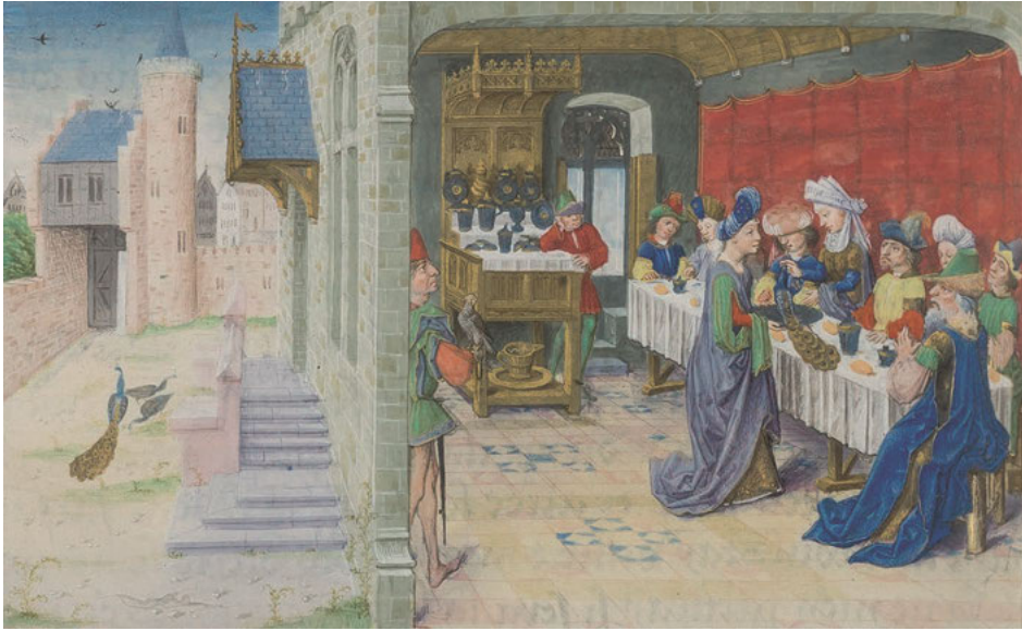
Abb. 17: Die Dame Phesonne schwört auf den Pfau, Jean Wauquelin: Les Faicts et les Conquestes d'Alexandre le Grand , 1467, Petit Palais, Musée des Beaux-Arts de la Ville de Paris, Paris, Inv. Nr. ms. Dutuit 456, Fol. 87 v .

anstatt des ursprünglichen Pfau wohl aufgrund der Verbindung jenes Vogels zu Kolchis, dem Fundort des Vlieses, da dieser, wie Isidor von Sevilla erläutert, „ a Phaside insulae Graeciae “ 41 in ebenjener Region benannt sei. Zudem gesellte Philipp „ deux chevaliers de l'ordre de la Thoison d'or “ 42 zu den Damen, welche den Schwur von den Anwesenden forderten, und ließ den Fasan durch die Personifikation des Vlieses selbst darbringen. 43 In dieser Präsentationsform der Alexanderthematik schien das Vorhaben des Herzogs in gar zweifacher Hinsicht erfolgsversprechend zu sein, konnte er sich sogar in die Tradition beider siegreichen Heroen, Jason und Alexander, stellen. Darüber hinaus konnte durch die Wahl jener bekannten Darstellung dem möglichen Zweifeln der Zeitgenossen, ob Philipp seinem Schwur tatsächliche Taten folgen lassen würde, entgegengewirkt werden. Eine derartige Kritik hatte bereits der um 1433 im Auftrag Philipps verfasste Pilgerbericht des Bertrandon de la Broquière formuliert, dass natürlich viele christliche Herrscher den Kreuzzug lediglich „ pour la vaine gloire de ce monde “ 44 verkündeten. Diese Bemerkung scheint sich trotz der bereits angeführten Bemühungen Philipps um den Zug gegen die Türken auf den Herzog zu beziehen. Denn für ihn war es politisch opportun, wenn er ge-