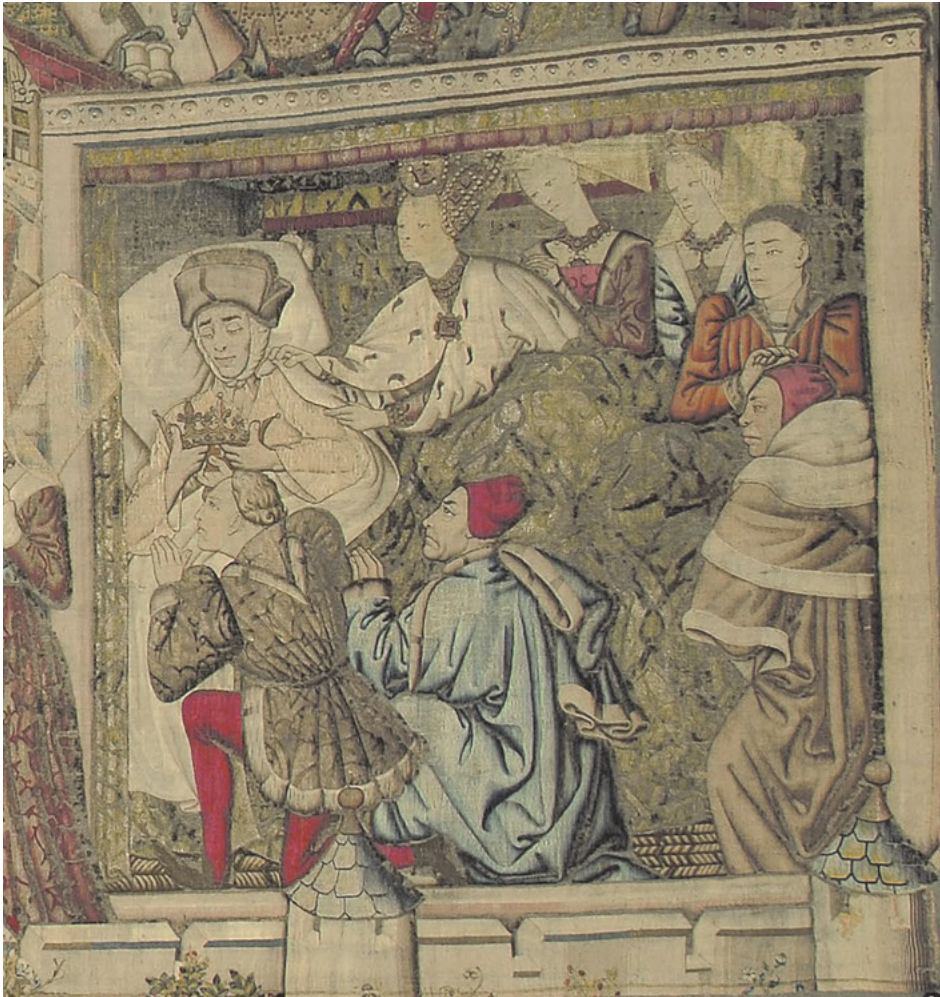
Abb. 25: Der sterbende Philipp von Makedonien krönt Alexander, Die Jugend Alexanders (Ausschnitt), Tapiserie, um 1460, Palazzo del Principe, Sammlung Doria-Pamphilj, Genua.

Königsinsignien aufweist. 172 Philipp trug bei seinem Einzug in die Stadt einen standesgemäßen Herzogshut, der, obgleich „ de pris non extimable “ 173 mit einer Vielzahl von Edelsteinen besetzt, 174 keine Krone war. Dennoch suggerierte die Präsentation Alexanders zumindest eine symbolische Krönung des Herzogs beziehungs-