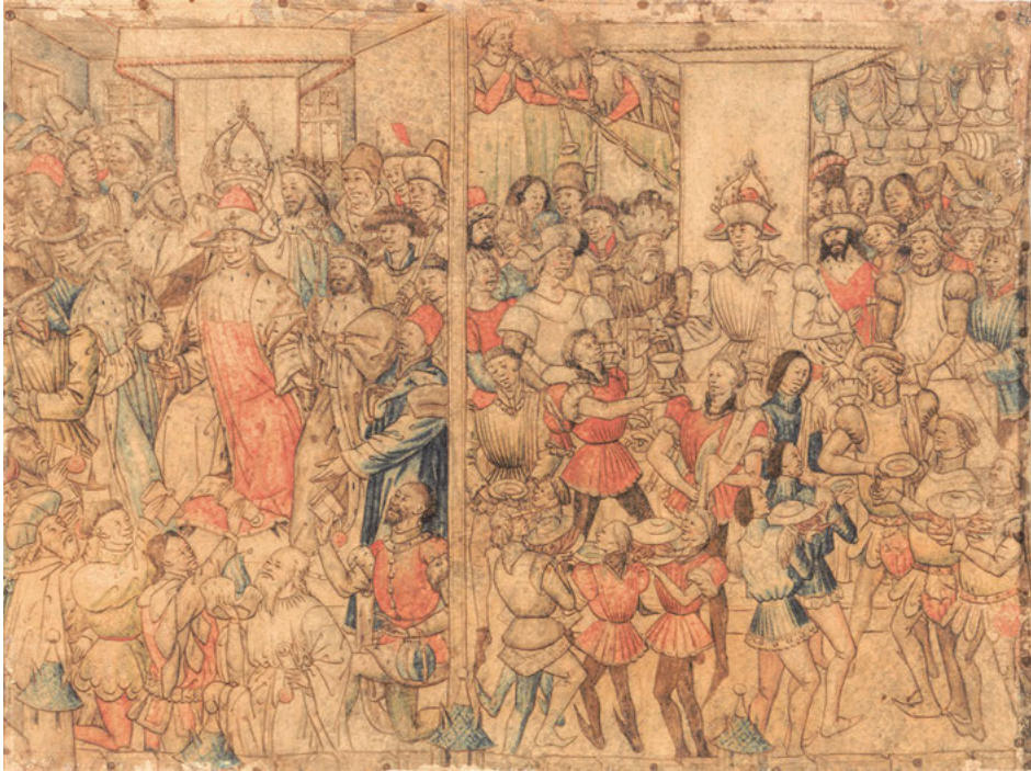
Abb. 23: Alexanders Krönung und Vergiftung, Zeichnung, um 1460, Klassik Stiftung, Weimar, Graphische Sammlung, Inv. Nr. KK 4622.

Präsentationsform setzt Alexanders Kriegszüge in direkte Verbindung mit dem frühen Ableben des Helden und scheint somit ein negatives Licht auf den Makedonen zu werfen. Obgleich dies noch nicht als Kritik am Helden Alexander zu lesen ist, wie sie danach im Werk Vasco de Lucenas erscheint, das erst nach der Anfertigung der petit patrons im Jahr 1468 vollendet wurde, weist diese Interpretation doch bereits bemerkenswerte Parallelen zu der Deutung Alexanders in der Alexandervita des portugiesischen Literaten auf. Somit lassen sich die für die burgundische Bibliothek konstatierten Veränderungen bezüglich des Alexanderbildes ansatzweise auch in den Tapisserien verfolgen. Noch ungeklärt ist aber die Frage, wie und ob solche Interpretationen bei bestimmten repräsentativen und politischen Anlässen aufgegriffen und zur Aufführung gebracht wurden und in welchem Zusammenhang der Einsatz der Tapisserien mit den literarischen und theatralischen Adaptionen des Alexanderstoffes stand. Die Nutzung von Tapisserien herrschaftlich relevanten Inhalts ist für etliche festliche und politische Anlässe erwiesen, und es existieren Belege, wie Alexandertapisserien während des Aufenthalts Philipps anlässlich der Krönung Ludwigs XI. in Paris 1461, der Unterwerfung der Genter unter Karl 1469 sowie während des Herrschertreffens mit Friedrich III. 1473 verwendet wurden.