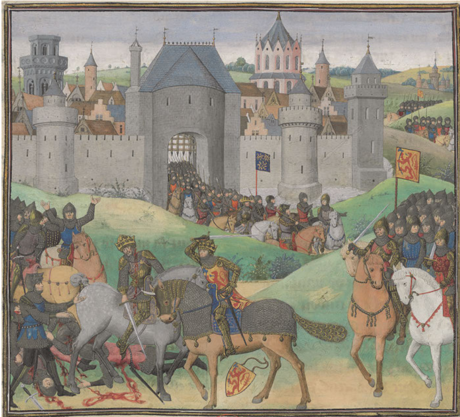
Abb. 20: Alexander rächt seinen Vater, Jean Wauquelin: Les Faicts et les Conquestes d'Alexandre le Grand , 1448, Bibliothèque nationale de France, Paris, Inv. Nr. ms. Fr. 9342, Fol. 94 v .

als Ausdruck besonderer Verbundenheit beider Herrscherhäuser getätigt wurde – zumal weitere gekaufte Werke den Thematiken von Tapisserien im herzoglichen Besitz entsprechen – deutet dies auf die nachträgliche Erstellung von Duplikaten der burgundischen Tapisserien und somit auf den Verbleib der entsprechenden patrons in der Werkstatt Greniers hin. 135