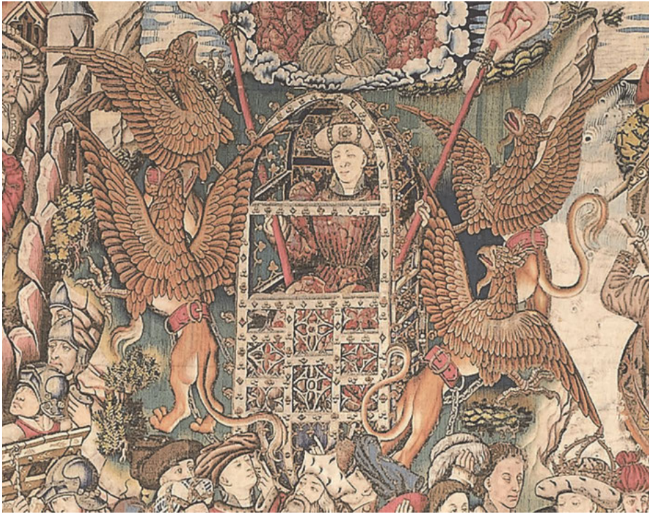
Abb. 28: Alexanders Luftreise, Die Abenteuer Alexanders im Orient (Ausschnitt), Tapisserie, um 1460, Palazzo del Principe, Sammlung Doria-Pamphilj, Genua.

Analogien zu der Ikonographie des Kampfes gegen die Ungläubigen aufweisen. Darauf deutet die Darstellung der Gegner Alexanders des Großen hin, deren Kleidung sowie Haar- und Bartracht vielfach in hohem Maße orientalisierend wirken. Während der bartlose Held und seine meist ebensolchen Mitstreiter in Rüstungen auftreten, die im Stil solchen entsprechen, die um die Mitte des 15. Jahrhunderts in den Niederlanden oder Mailand angefertigt wurden, tragen ihre Feinde meist einen gespaltenen Bart sowie Kegelhüte oder turbanähnliche Kopfbedeckungen. 182 So findet sich etwa auf der zweiten Doriatapisserie ein sarazenischer Adliger mit einem ebensolchen Erscheinungsbild in Verhandlungen mit Alexander, derweil dessen Gefolgsleute im Hintergrund immer noch mit Krummsäbeln gegen Alexanders Truppen kämpfen (vgl. Abb. 27 und 38). Ferner tritt der Makedone in besonderem Maße als Schützling Gottes auf, welcher über dessen sichere Rückkehr zur Erde und über die Kämpfe und Eroberungen des Helden zu wachen scheint. Die zentrale Positionierung Gottes im Bild vermittelt den Eindruck, Alexander führe seine Kriegszüge in dessen Auftrag aus (vgl. Abb. 28 und 38). Diese Darstellung, die im Vergleich zu anderen zeitgenössischen Abbil-