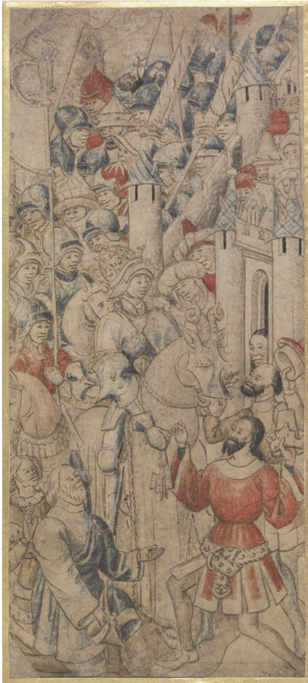
Abb. 33: Der triumphale Einzug Alexanders in Babylon, Zeichnung, um 1460, London, British Museum, Inv. Nr. 1895,0915. 893.a.