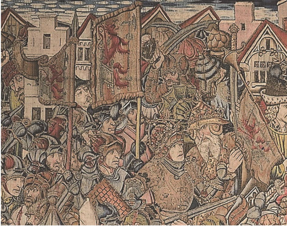
Abb. 27: Ein orientalisches gekleideter Adliger ergibt sich Alexander, Die Abenteuer Alexanders im Orient (Ausschnitt), Tapiserie, um 1460, Palazzo del Principe, Sammlung Doria-Pamphilj, Genua.

für einen Kreuzzug auszugehen, zumal dies gleichermaßen im weiteren Umfeld Philipps so wahrgenommen wurde. 180