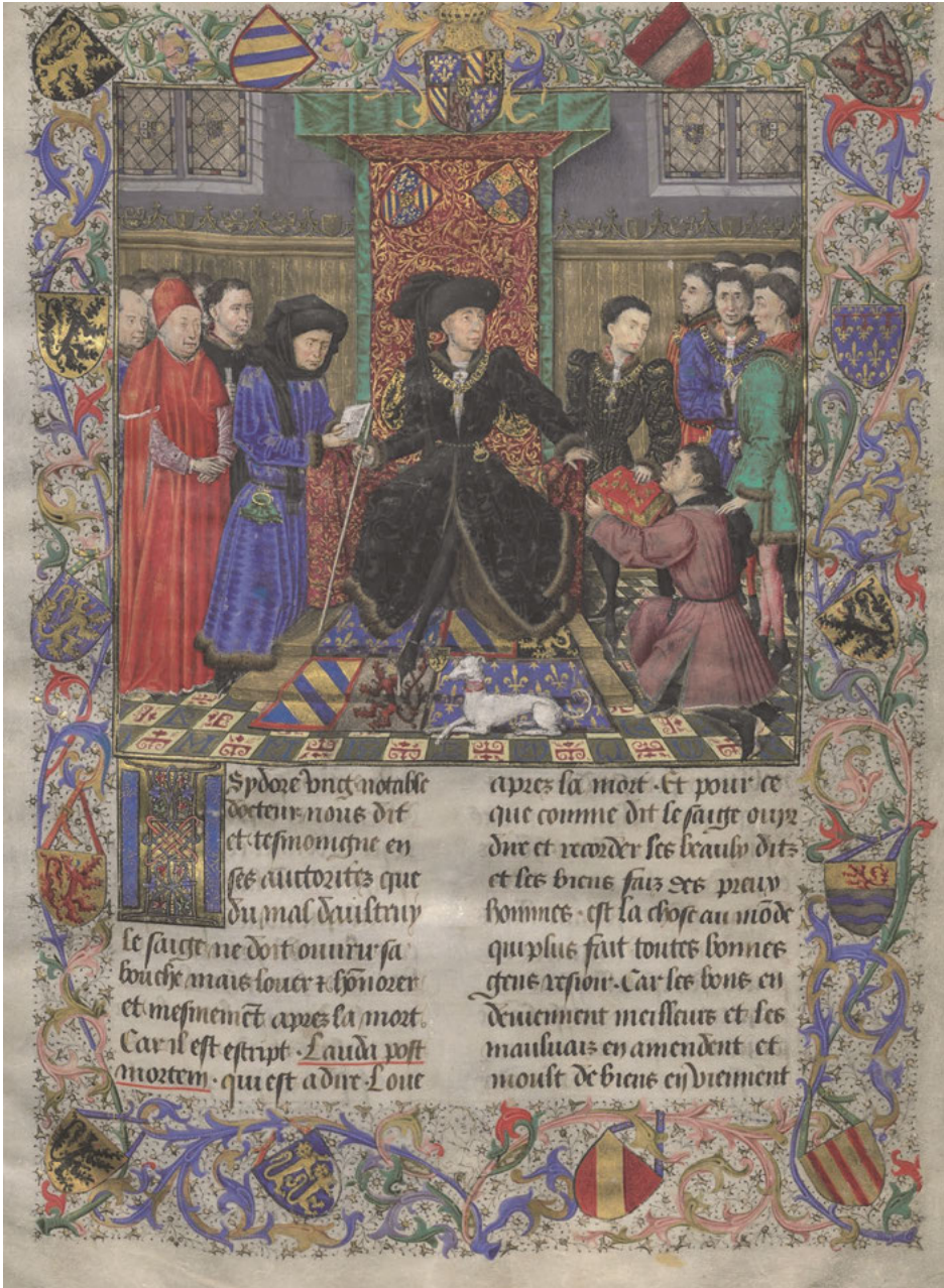
Abb. 24: Jean Wauquelin überreicht Philipp dem Guten sein Werk, Jean Wauquelin: Roman de Girart de Roussillon , nach 1448, Österreichische Nationalbibliothek, Wien, Inv. Nr. Cod. 2549 Han., Fol. 6 r .