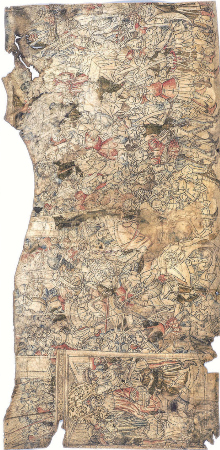
Abb. 22: Alexander nimmt Geschenke entgegen, Kampf Alexanders gegen Dareios, Tod des Dareios und Trauerzug, Alexander im Orient , Bernisches Historisches Museum, Bern, Inv. Nr. 34547.