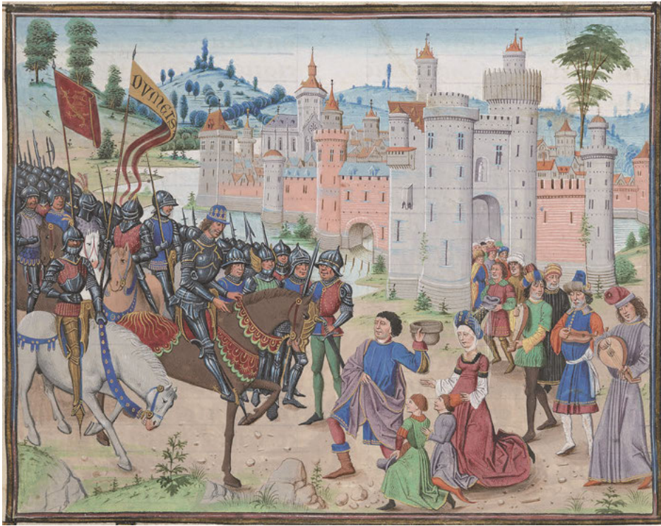
Abb. 31: Unterwerfung Babylons unter Alexander, Vasco de Lucena: Les Faictz et Gestes d'Alexandre le Grand , um 1470, Bibliothèque nationale de France, Paris, Inv. Nr. ms. Fr. 22547, Fol. 101 r .

nächst gezwungen waren, anderthalb Stunden im Schnee vor den Türen des Saales zu warten. Hinzu kam die im Vergleich zu der ersten Versöhnungsfeier am 8. August 1467 noch wesentlich größere Öffentlichkeit des Geschehens, ein „wahres Canossa“ 213 für die Genter. Dieses Argument lässt sich zusätzlich ausweiten, wird die zweite Doriatapissérie betrachtet, die nicht nur die Eroberung einer Stadt – vermutlich handelt es sich hierbei um Tyros 214 – zeigt, sondern vor allem deren Zerstörung. Die Verwendung einer solchen oder ähnlichen Tapissérie ließe sich demgemäß als Drohgebärde den Gentern gegenüber auffassen, zumal Karl laut dem in burgundischen und später französischen Diensten tätigen Chronisten Philippe de Commines befürchtete, andere Städte könnten sich ein Beispiel am Widerstand Gents nehmen. 215 Sollten jene dementsprechend dem Herzog weiterhin Widerstand leisten, so würde dieser nicht mehr nur die Privilegien, die