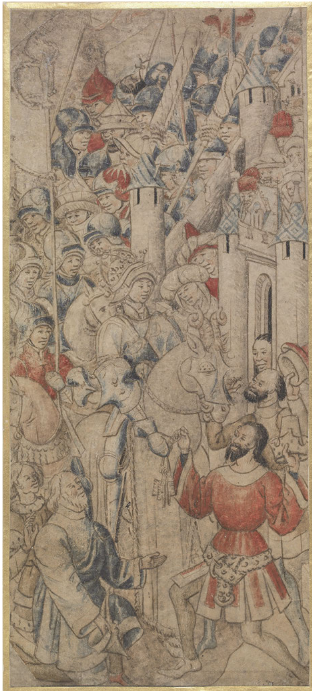
Abb. 33: Der triumphale Einzug Alexanders in Babylon, Zeichnung, um 1460, London, British Museum, Inv. Nr. 1895,0915. 893.a.