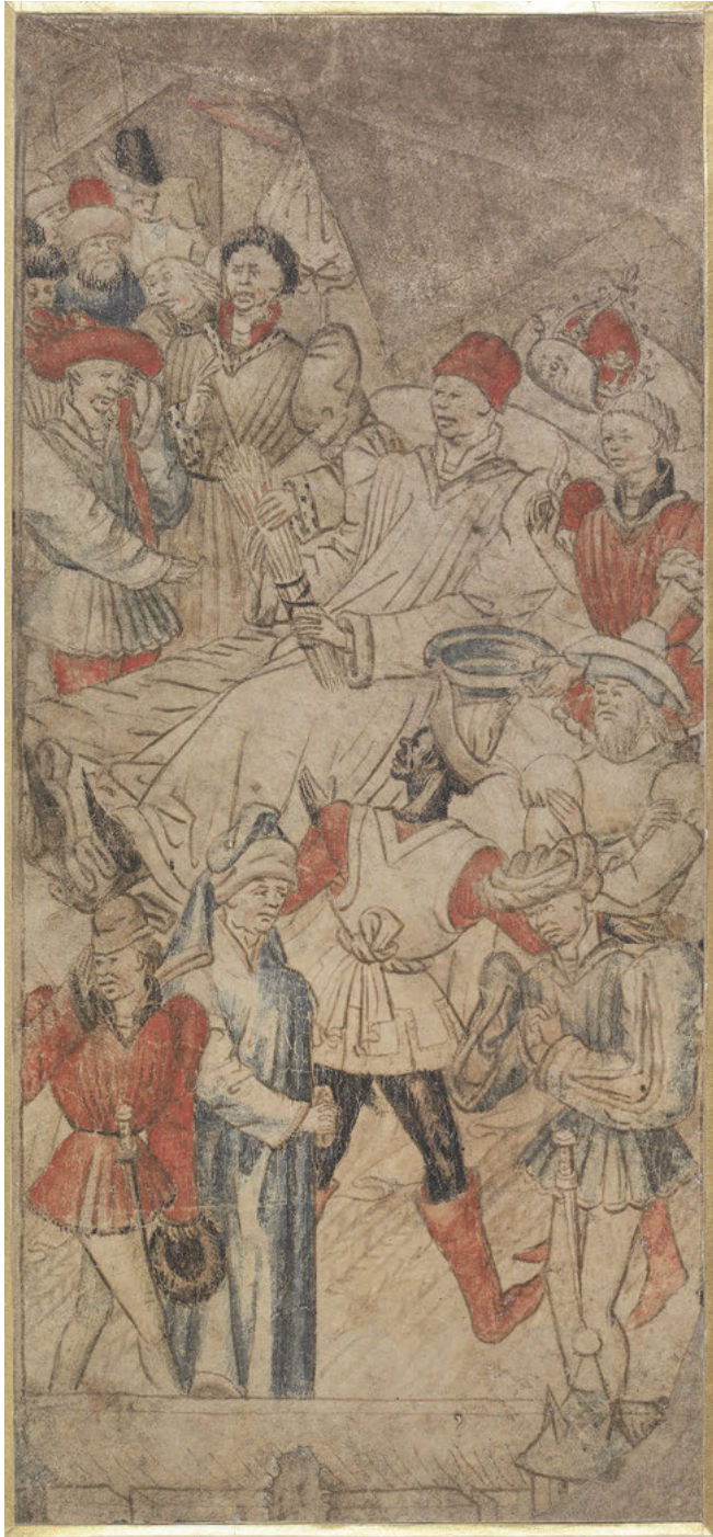
Abb. 29: Der Tod Alexanders, Zeichnung, um 1460, London, British Museum, Inv. Nr. 1895,0915.893.b.