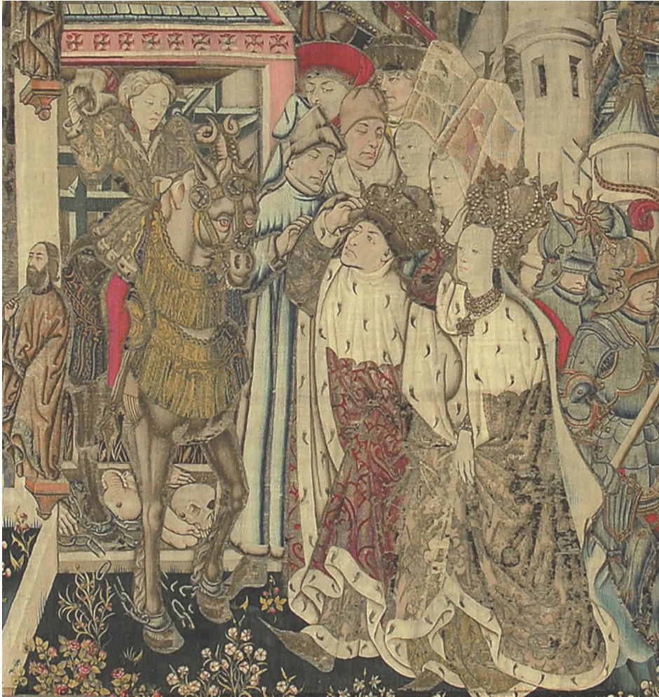
Abb. 19: Der junge Alexander bezwingt vor seinen staunenden Eltern Bukephalos, Die Jugend Alexanders (Ausschnitt), Tapisserie, um 1460, Palazzo del Principe, Sammlung Doria-Pamphili, Genua.