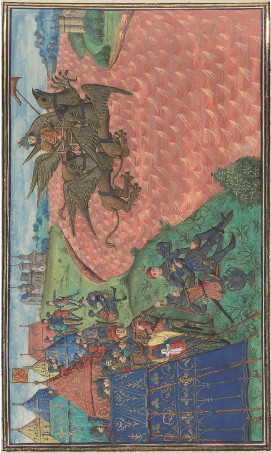
Abb. 18: Alexanders Luftreise, Jean Wauquelin: Les Faits et les Conquestes d'Alexandre le Grand , 1467, Petit Palais, Musée des Beaux-Arts de la Ville de Paris, Inv. Nr. ms. Dutuit 456, Fol. 257.