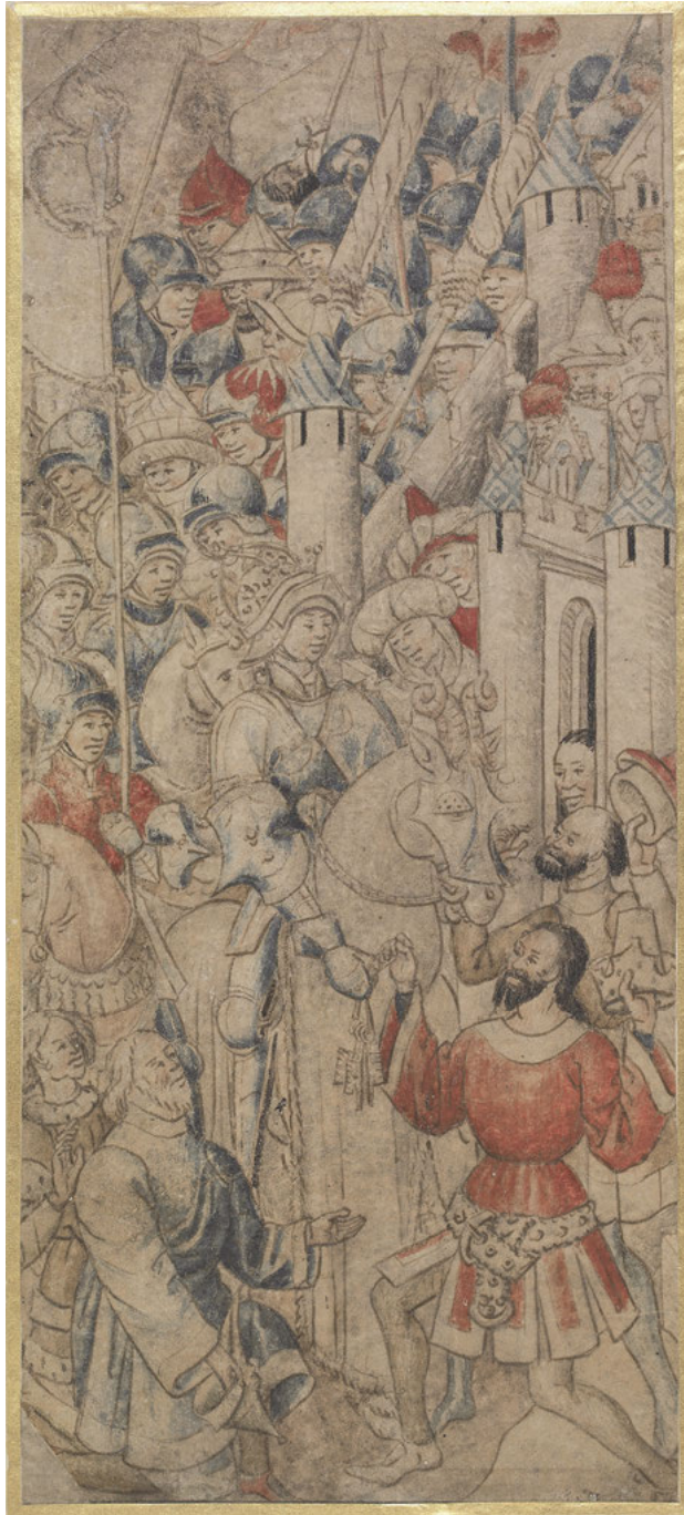
Abb. 33: Der triumphale Einzug Alexanders in Babylon, Zeichnung, um 1460, London, British Museum, Inv. Nr. 1895,0915. 893.a.