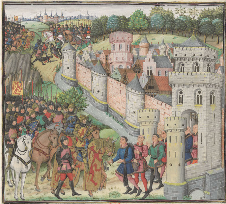
Abb. 30: Unterwerfung Babylons unter Alexander, Jean Wauquelin: Les Faicts et les Conquestes d'Alexandre le Grand , 1448, Bibliothèque nationale de France, Paris, Inv. Nr. ms. Fr. 9342, Fol. 199 v .

dass sich der Herzog nicht nur als exzellenter Feldherr inszenieren wollte, sondern spezifisch auf die Unterwerfung einer Stadt anspielte. So sind auf dem zweiten Doriateppich (vgl. Abb. 32 und 38) und auf einer der Londoner Zeichnungen (vgl. Abb. 33) explizit die Eroberung einer Stadt sowie die Schlüsselübergabe durch die besiegten Bürger dargestellt. Karl wollte so seine Machtansprüche gegenüber den Gentern zum Ausdruck bringen. 210 Dafür spricht sicherlich der demütigende Empfang der Bürger, welche sich Karl nicht nur „à coutes et à genoux“, 211 „criant tous ensamble et unanimiter très humblement merchy“ 212 nähern mussten, sondern zu-