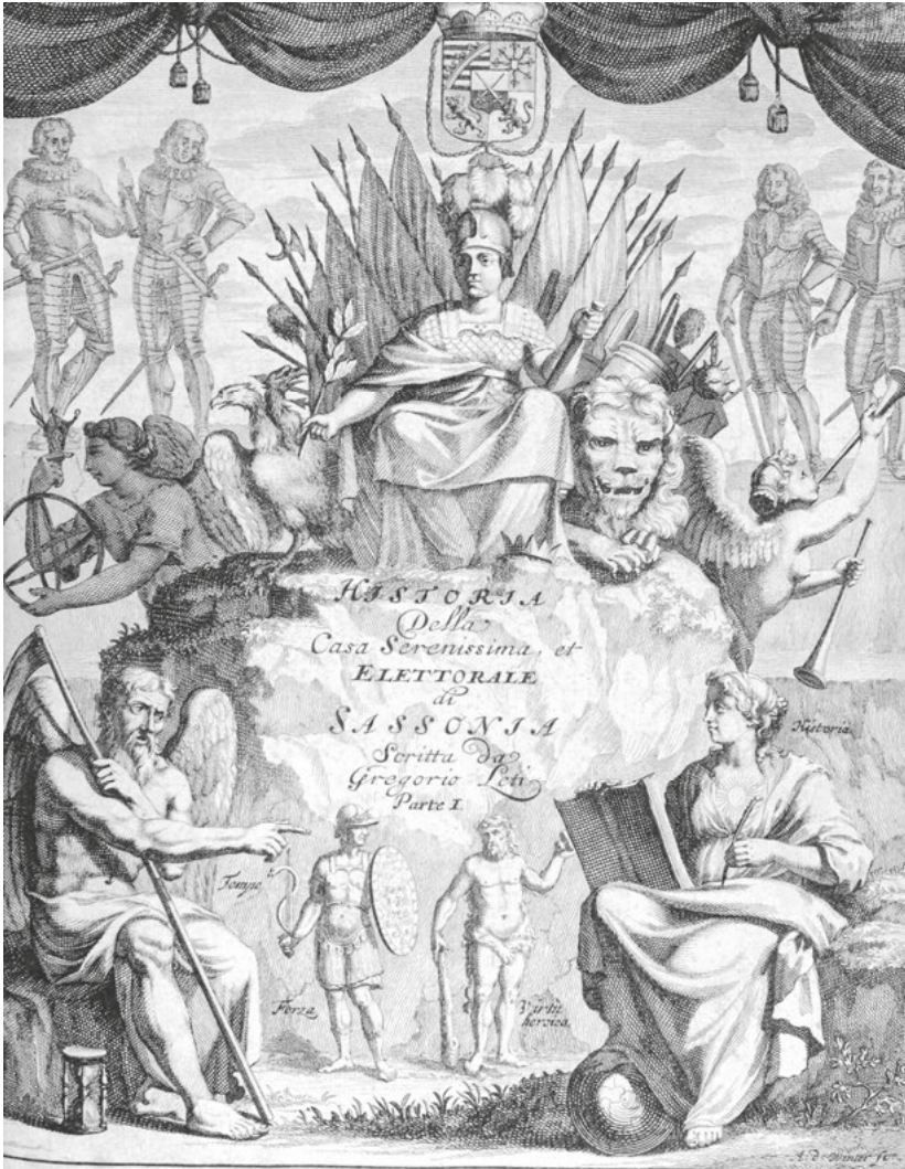
Abb. 24: Gregorio Leti, Titelblatt Ritratti Historici, Politici, Chronologici e Genealogici, Della Casa Serenissima & Elettorale di Sassonia , Bd. 1 Amsterdam 1688.

s'aggira nel Petto, vera Fucina di Grazie dell'A. V. S. più risplendente di quella che si è mai visto nel cuore di qualsisia Gran Monarca. 110