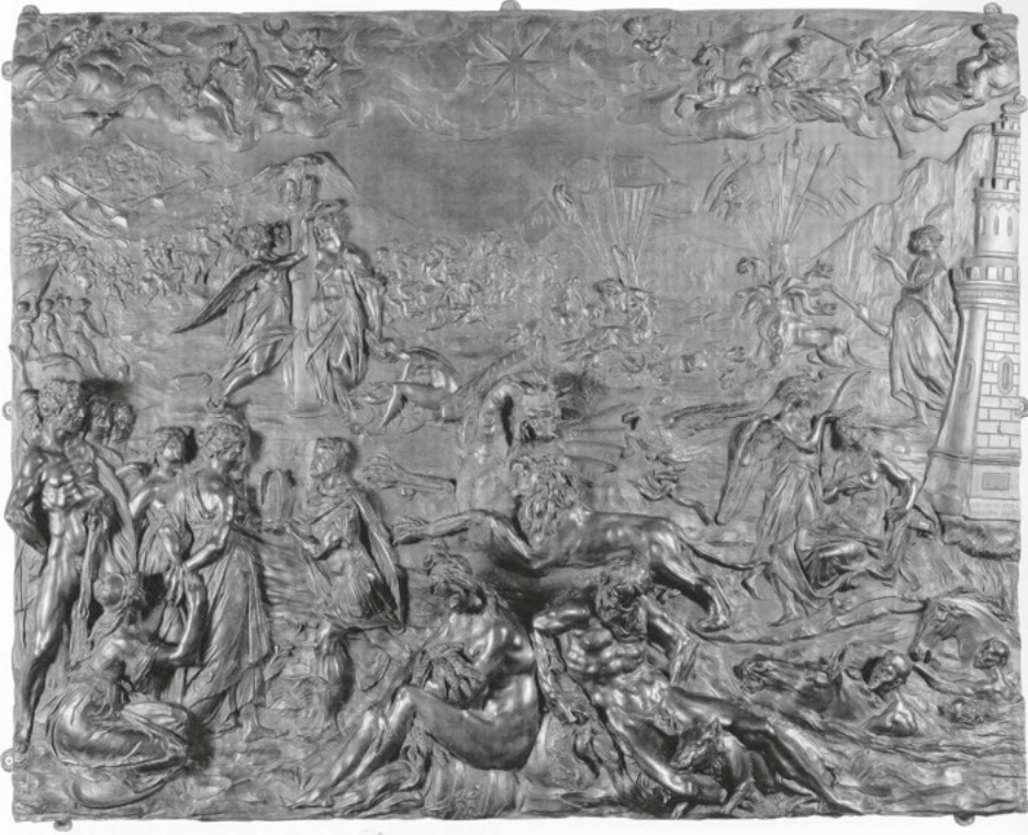
Abb. 20: Adriaen de Vries, Rudolf II. triumphiert über die Türken , Bronzerelief, um 1603, Wien, Kunsthistorisches Museum, Kunstkammer, Inv.-Nr. 5474.

ihm folgen. 53 Der Malerei überreicht er ein Geschenk, während er mit seinem Pferd den Neid zertritt. Diese Handlung wird im Hintergrund rechts gespiegelt durch Herkules, der einen Satyr mit erhobener Keule festhält. Im Hintergrund ist ein Rundtempel mit Minerva auszumachen. An den Rändern im Vordergrund sind ein Flussgott mit Löwe (als Personifikation der Moldau mit dem Wappentier des Königreichs Böhmen) und eine Fama als Liege- bzw. Sitzfigur gezeigt. Adler und Capricorn erscheinen als Verweise auf Augustus. Mit dem Pendant des Reliefs, einer Allegorie auf den Türkenkrieg in Ungarn (Abb. 20), 54 das die kriegerischen Leistungen Rudolfs glorifiziert, erscheint Rudolf in diesen Kunstwerken in der Verbindung von siegreichem Retter der Christenheit und Förderer der Künste und Wissenschaften. 55 Die Einheit der Kunstwerke symbolisiert die Zusammengehörigkeit von arma et litterae bzw. Arte et Marte . Die Pendants machen ebenfalls