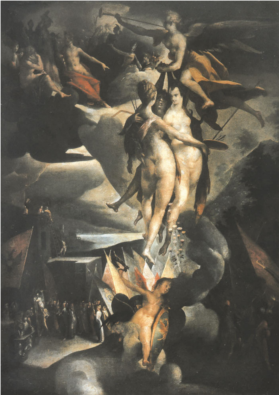
Abb. 17: Bartholomäus Spranger, Fama führt die Künste in den Olymp , Öl auf Leinwand, um 1596, Prag, Nationalgalerie.