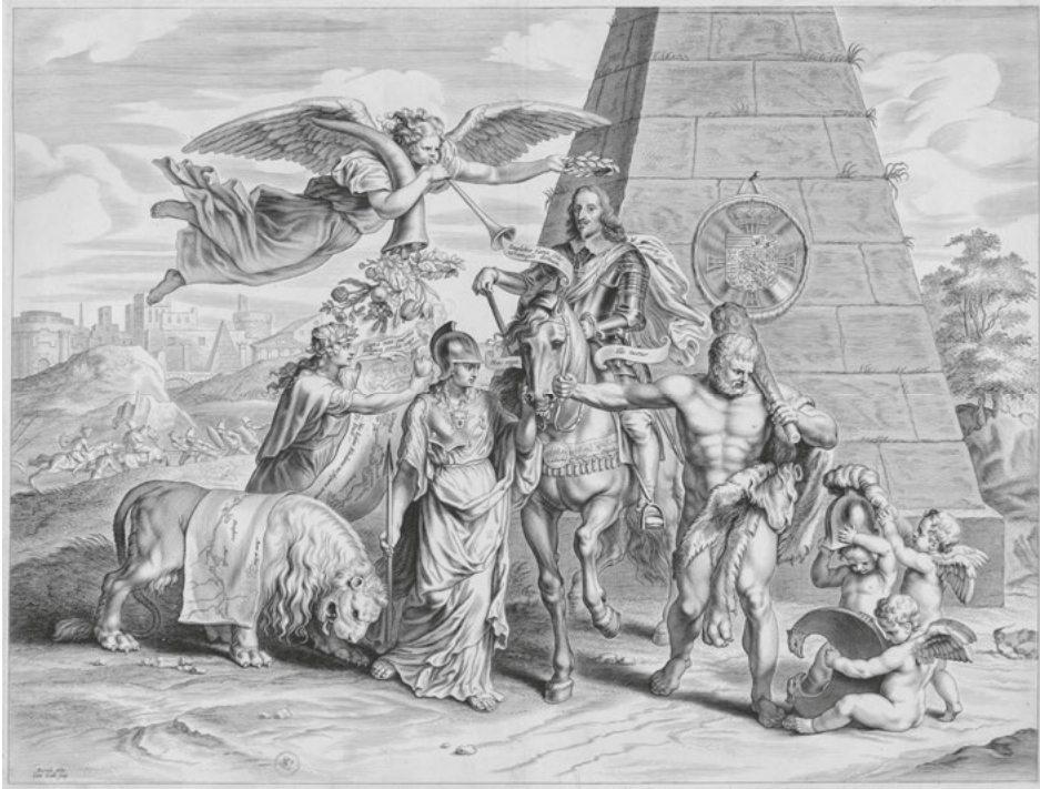
Abb. 22: Cornelis II. Galle, Leopold Wilhelm flankiert von Minerva und Herkules , Kupferstich, 17. Jh., Paris, Bibliothèque Sainte-Geneviève.

zung vorbildlichen Handelns präsent. Die Motivation, einen gerechten Krieg zur Erlangung eines christlichen Friedens zu führen, gehört ebenso wie die Qualitäten Stärke, Mut und Weitsicht zum tugendhaften Handeln des Herrschers, das ihm Ruhm und Ehre einbringt. Die typische Einkleidung in Rüstung und mit dem Deutschmeisterorden in Schelte a Bolswerts Stich wirkt vor diesem Hintergrund dokumentarisch und dem Anlass gemäß. Doch die denkmahlhafte Isolierung der Figur, die scheinbar unbeteiligt den Weg der huldigenden Allegorien nimmt und als einzige Bildfigur historisch-real ist, bewirkt eine „Auratisierung des Herzogs“. 82