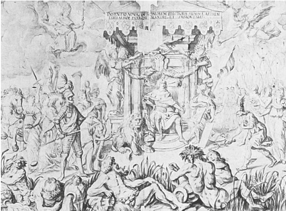
Abb. 27: Christian Schiebling, Inventio zu einer Allegorie auf Friedrich Wilhelm , Federzeichnung, 1652, Berlin, Staatliche Museen, Kupferstichkabinett.

ebenfalls alludiert, wenn von links Leuchter und Schalen von römischen Soldaten und Sklaven gebracht werden. Der Kurfürst ist in dem Relief präsent, das die Personifikation der Bildhauerei mit der Inschrift „HERCVLI MVSAR[UM]“ vollendet. Seine ruhmvolle Memoria wird damit ebenso in die Überzeitlichkeit erhoben wie die antiken Kunstwerke Zeugen ihrer Vergangenheit sind und durch weitere Medien – repräsentiert durch den alten Mann rechts am Bildrand mit Buch und Medaille – bewahrt werden.