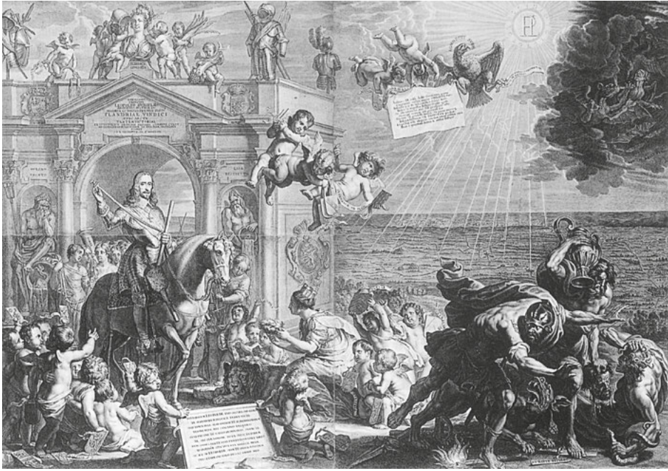
Abb. 21: Schelte a Bolswert (nach Erasmus Quellinus), Flandria liberata , Kupferstich, 1653, Gent, Stadtarchiv.

des Erzherzogs zu betonen. In Brüssel begann Leopold Wilhelm zugleich den Aufbau seiner Kunstsammlung, deren Ausbau später sein politisches Geschick überstrahlen sollte.