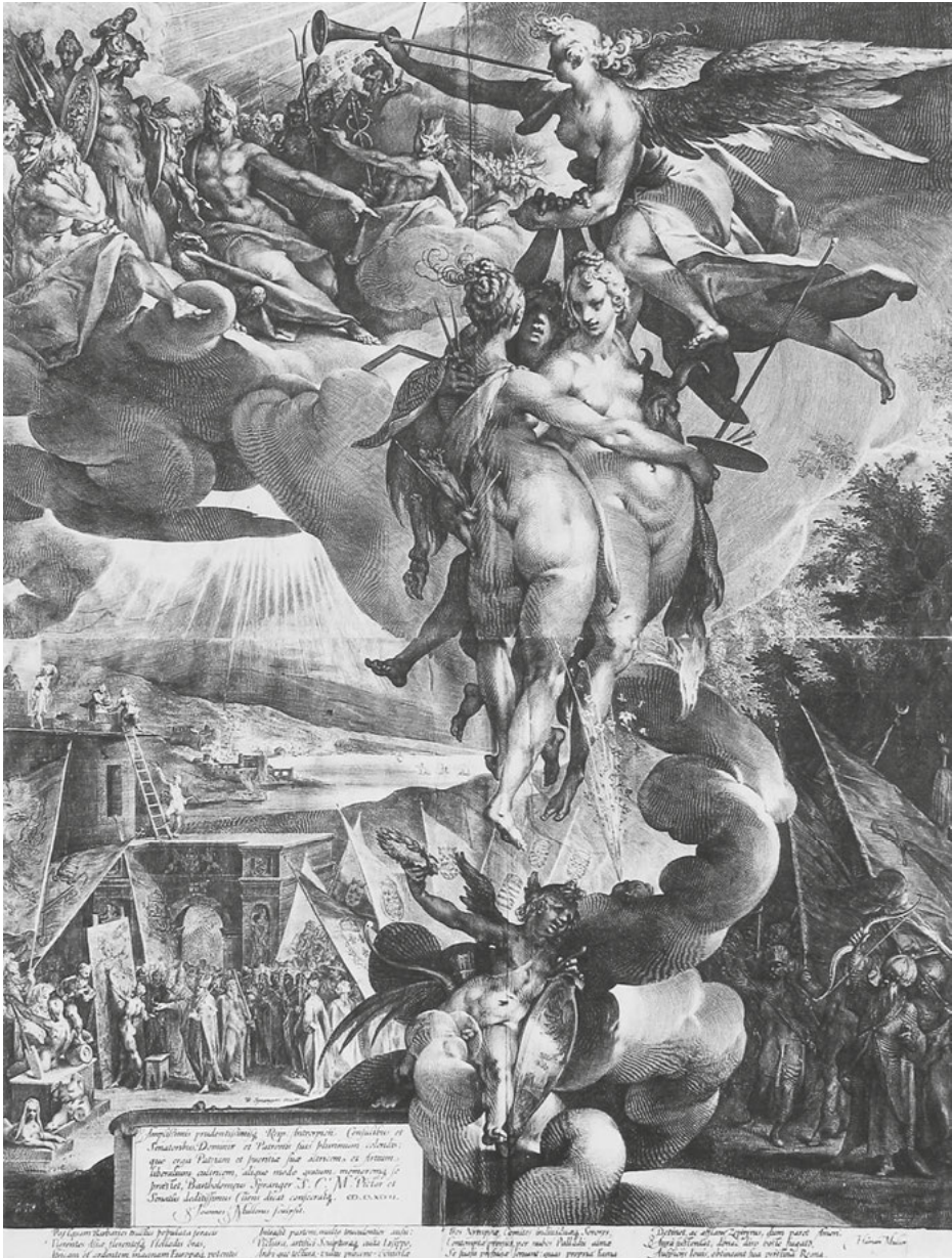
Abb. 18: Jan Harmensz Muller, Fama führt die Künste in den Olymp (Allegorie der Künste) , Kupferstich, 1597, Amsterdam, Rijksmuseum.

Rand hingewiesen (Abb. 18). Dieser Stich von 1597 deutet auf die Dominanz des herrscherlichen Images als Türkenbezwinger, damit Friedensbringer und Kunstförderer, das weite Verbreitung finden sollte. Hinter dem im linken Bildhintergrund noch tätigen Maler haben sich geistliche und weltliche Würdenträger als