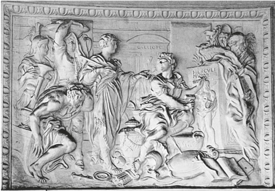
Abb. 26: Johann Friedrich Eosander von Göthe, Der Imperator läßt Trophäen in einen Musentempel einbringen (Allegorie auf die Förderung der Schönen Künste) , Relief im oberen Saal, um 1710, Berlin, Schloss Charlottenburg.

Im erhaltenen Skizzenbuch von Christoph Pitzler ist auch die Decke des Alabastersaales beschrieben, die Rahmungen in den Vouten nehmen noch einmal direkten Bezug zur engen Verbindung des Kurfürsten als Kriegsherr und Musenfürst, denn es waren gezeigt „die Künste als Arch(itettura) mit Pozdam, Pittura mit des Churfürsten) und contref(ait) des alten, Fortif(icazione) mit Berlin, Scultura mit des Churfürsten) contref(ait) des alten“. 118