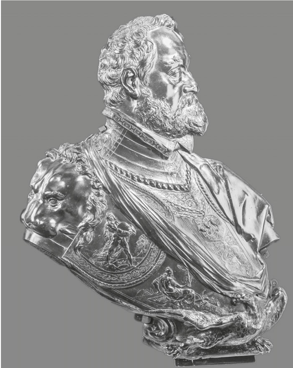
Abb. 16: Adriaen de Vries, Rudolf II. , Bronze, 1609, London, Victoria and Albert Museum.

gründung formal-äußerlich vermitteln kann. Unterhalb der Herkules-Szene ist eine Minerva mit einer Viktoria-Statuette auf Waffen ruhend in den Harnisch getrieben, wodurch die inhaltliche Komponente der Herkules-imitatio weiter ausgestaltet werden kann und eine Verbindung zu einem durch Stärke erlangten Frieden und dem Träger der Rüstung als Schutzherrn der Künste geschlagen wird.