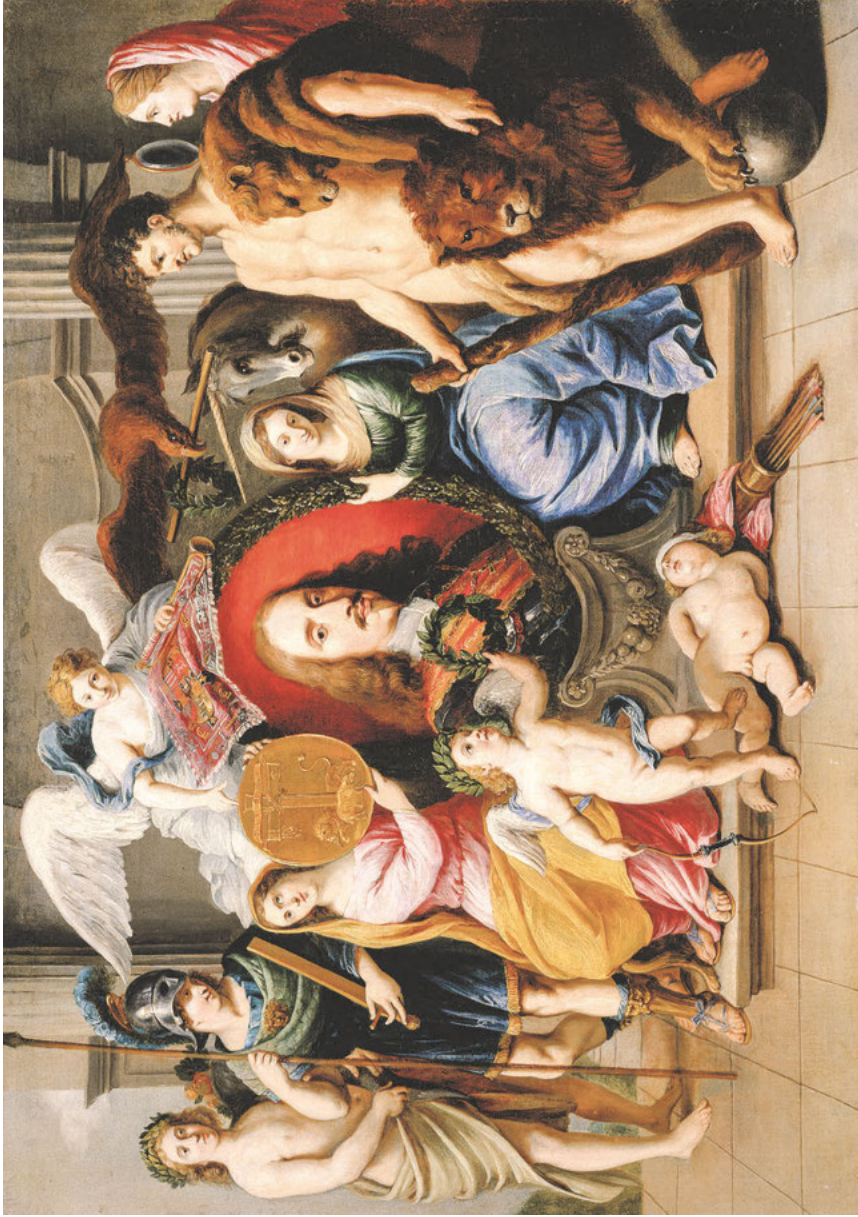
Abb. 23: Jan van den Hoecke, Allegorie auf Erzherzog Leopold Wilhelm als Patron der Künste , Öl auf Leinwand, um 1650, Wien, Kunsthistorisches Museum, Inv.-Nr. GG_9682.