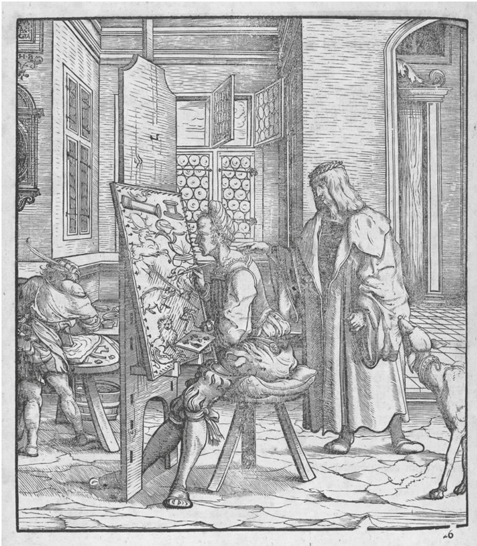
Abb. 15: Hans Burgkmair, Maximilian I. als Alexander d. Gr. in der Werkstatt des Apelles , Holzschnitt/Kupferstich (1516), Titelblatt, Faksimiledruck in Max Treitzsauerweins Der Weißkunig , Wien 1775.

Dieses Motiv wird nicht mehr aufgenommen, stattdessen wird im übrigen Teil des Buches über sämtliche Schlachten, Kriege und militärischen Erfolge des Weißkunig berichtet. Nimmt man jedoch die anfängliche Behauptung ernst, die Grundlage dafür liege in der Kunstausübung bzw. -kenntnis, dann kommt ihr eine eminente Rolle im Staate zu, die sich in den herausragenden Taten des Weißkunig manifestiert. In der ‚hagiographischen Biographie‘ des Weißkunig wird zudem berichtet, dass Maximilian auch die Malerei, die Steinbaukunst und das