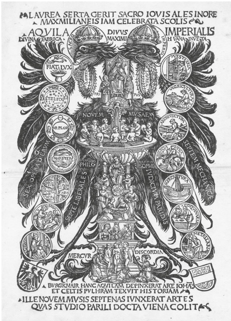
Abb. 13: Hans Burgkmair d. Ä., Der allegorische Reichsadler des Konrad Celtis , Holzschnitt, um 1507, Wien, Albertina, Inv.-Nr. DG1934/149.

beide für Kunst, Wissenschaft und Taten für das Gemeinwohl Neigung und Befähigung hätten – so Conrad Peutinger, der Maximilian und Herkules somit in eine somatisch-dynastische Beziehung zueinander setzt. 17 Celtis hingegen argu-