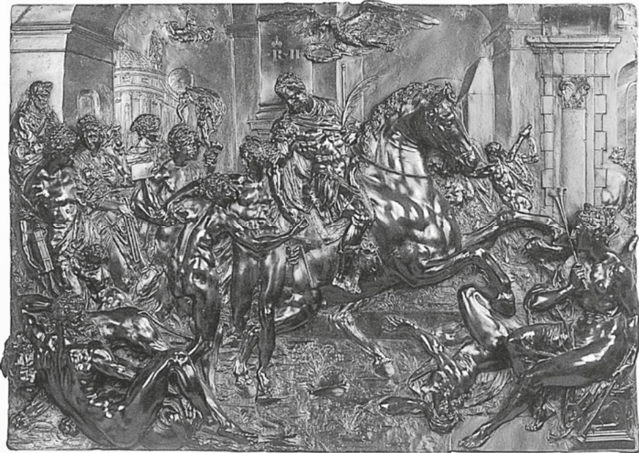
Abb. 19: Adriaen de Vries, Rudolf II. führt die Künste in Böhmen ein , Bronzerelief, 1609, Windsor Castle, Sammlung Ihrer Majestät Elizabeth II.

Zuschauer, Förderer und Schutzherren versammelt, unter ihnen Rudolf II. Doch auch in dieser Szene im Bild ist der bedrohte Zustand der Künste präsent durch die kaiserlichen Verbündeten Spanien, Frankreich, Venedig, Florenz, England, Burgund, Sachsen, Pfalz und Brandenburg, deren Auftreten auf das Kriegsgeschehen hinweist. Im Gegensatz zur Gemäldefassung von Spranger, bei der die Sonne als Symbol für Christus (und hier übertragen auf Rudolf den christlichen Streiter gegen die Ungläubigen) das Wappenschild Amors zierte und so die politische Dualität von Kunstfreunden und -feinden betont wurde, ersetzt Muller die Sonne durch das Herrschaftssymbol des Adlers.