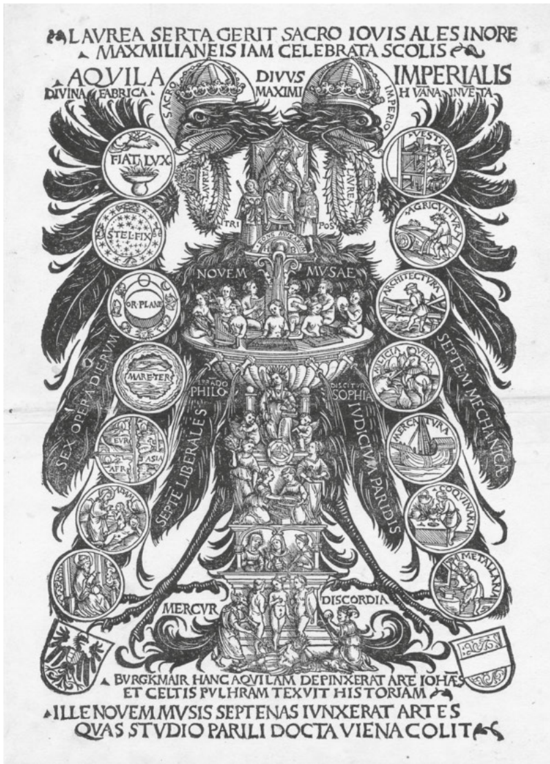
Abb. 13: Hans Burgkmair d. Ä., Der allegorische Reichsadler des Konrad Celtis , Holzschnitt, um 1507, Wien, Albertina, Inv.-Nr. DG1934/149.

beide für Kunst, Wissenschaft und Taten für das Gemeinwohl Neigung und Befähigung hätten – so Conrad Peutinger, der Maximilian und Herkules somit in eine somatisch-dynastische Beziehung zueinander setzt. 17 Celtis hingegen argu-