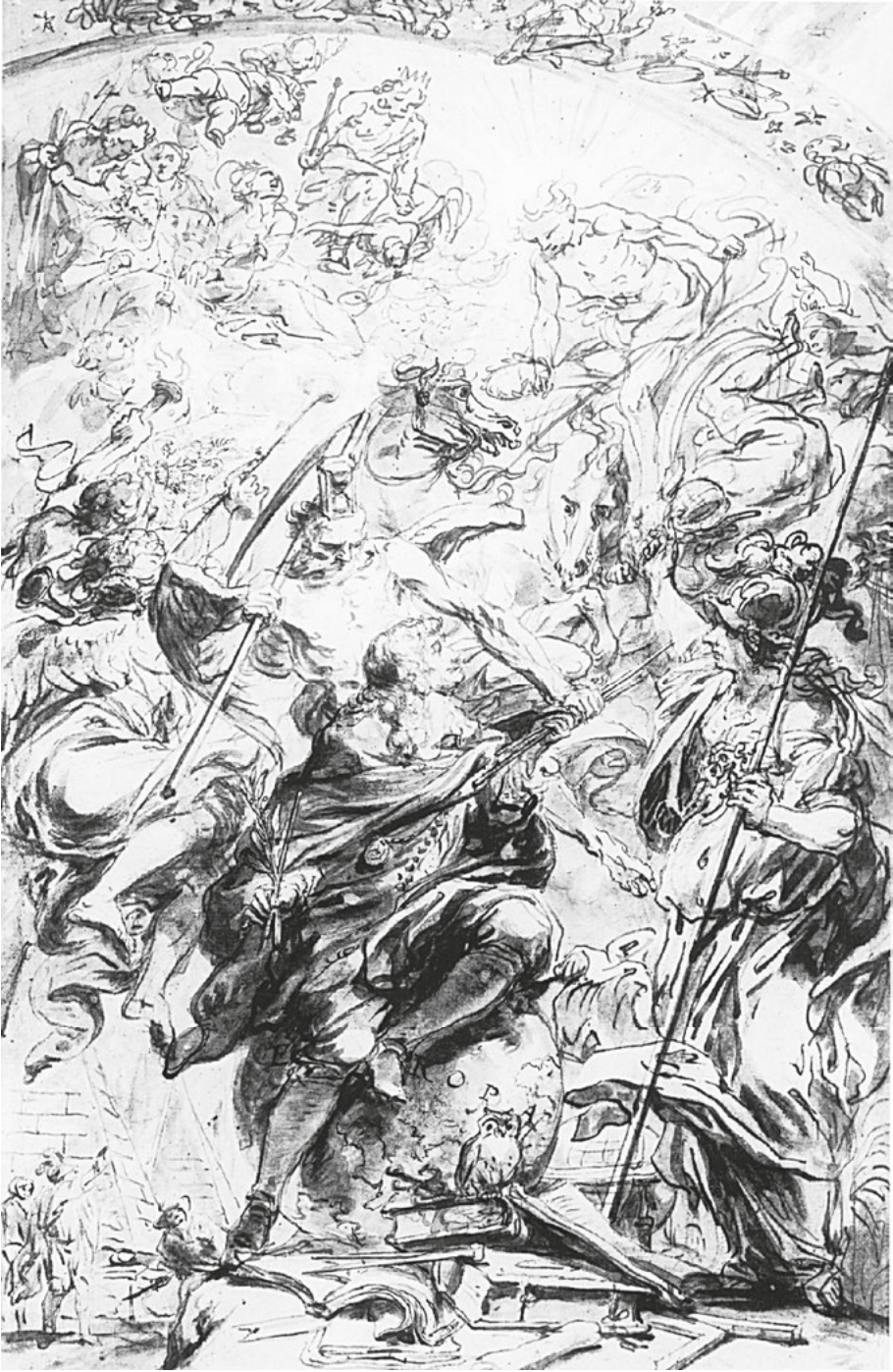
Abb. 70: Michael Willmann, Allegorische Huldigung Joachim von Saurdarts , Federzeichnung, 1682, Wien, Grafische Sammlung Albertina.