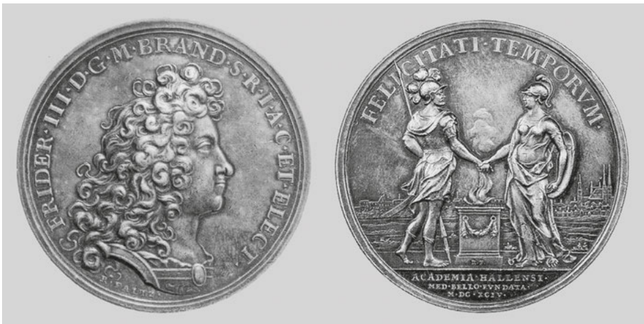
Abb. 65: Raimund Faltz, Medaille der Akademie bzw. Universität in Halle, Fridericana, auf ihren Stifter Friedrich III., Silber, 1694, Berlin, Staatliche Museen, Münzkabinett.

1763 Apoll im Strahlenkranz auf Wolken über einer Flusslandschaft mit den Flussgöttern Rhein und Neckar (Abb. 66). 38 Das Zusammenwirken dieser Götter wird durch die Umschrift als „glückliche Vereinigung“ bezeichnet und somit das Musenreich in die Lande Carl Theodors transferiert, der als Profilbildnis – in Rüstung mit Fellmantel und Perücke – das Avers einnimmt. Die zwei getrennten Bilder des Kurfürsten – als Staatsmann und in Verkörperung seines Wesens durch