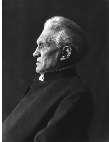
Abb. 3: George im Profil (1928)

Der Vergleich von Gundolfs Cäsar-Zeichnung mit Fotografien Georges (Abb. 2 und 3) liegt insofern nahe, als George seinen Kopf bevorzugt im Profil ablichten ließ. 4 Robert Boehringers Beschreibung der Physiognomie Georges passt auch auf den Cäsar-Kopf: Er verweist auf den „stillen“ Blick und die „tiefliegenden Augen“, auf die „durchgearbeitete, unten vorgebaute, durchfurchte Stirn“, die „fleischlose Wange“ und „tiefliegende Gramesfalte“. 5 George zeige sich in der Fotografie im Pförtnerhaus „nach innen gekehrt, sinnend“, ganz „im Bewußtsein seines Rangs ohne Zutun oder Gebärde“. 6 Die Ähnlichkeiten zwischen der Zeichnung und den Fotografien lassen sich im Profil besonders gut erkennen: Das markante Haar Georges ersetzt den Lorbeerkranz. Die physiognomischen Merkmale (wulstige Stirn, markantes Kinn, magere Wangen) deuten ebenso wie der nachdenkliche Blick auf eine Angleichung der beiden Männer im Bildnis. Gundolfs Zeichnung projiziert die Züge des alternden George auf Cäsar und steht damit in einer Tradition, die George selbst begründete. Indem George sich auf Kostümfesten als Cäsar (Abb. 4) oder Dante (Abb. 5) inszenierte, förderte er den Vergleich mit herausragenden historischen Figuren. 7 Auch eine Vision der Überblendung von Cäsar und George, die Edgar Salin 1914 in Gundolfs Ar-