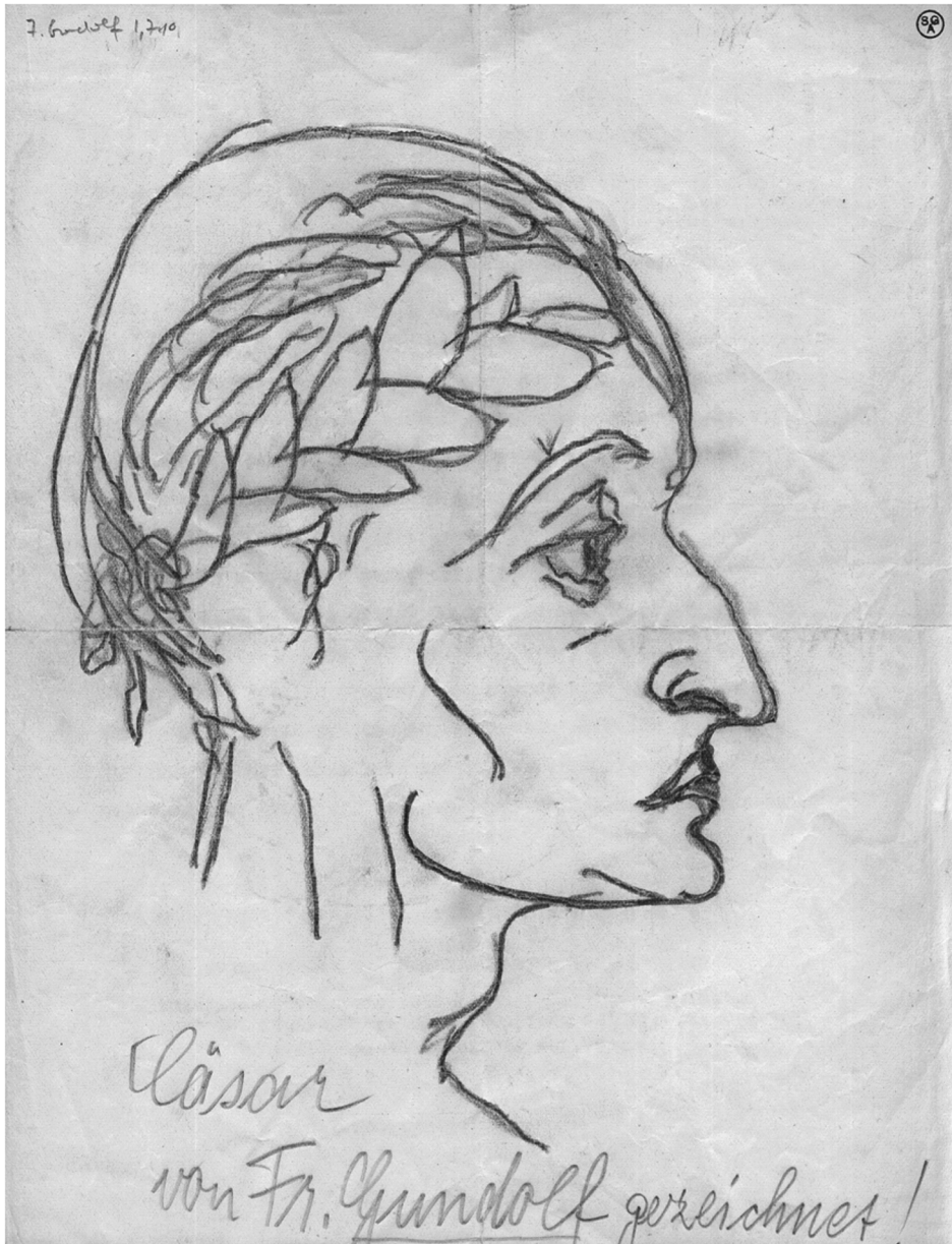
Abb. 1: Cäsar von Friedrich Gundolf gezeichnet!