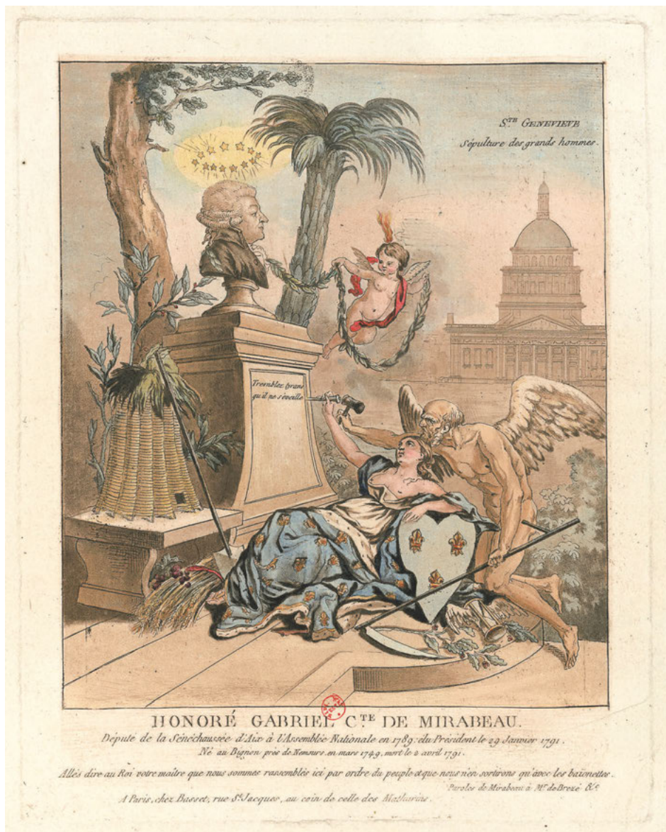
Abb. 2: Honoré Gabriel c.te de Mirabeau: député de la Sénéchaussée d'Aix à l'Assemblée nationale en 1789 [...].