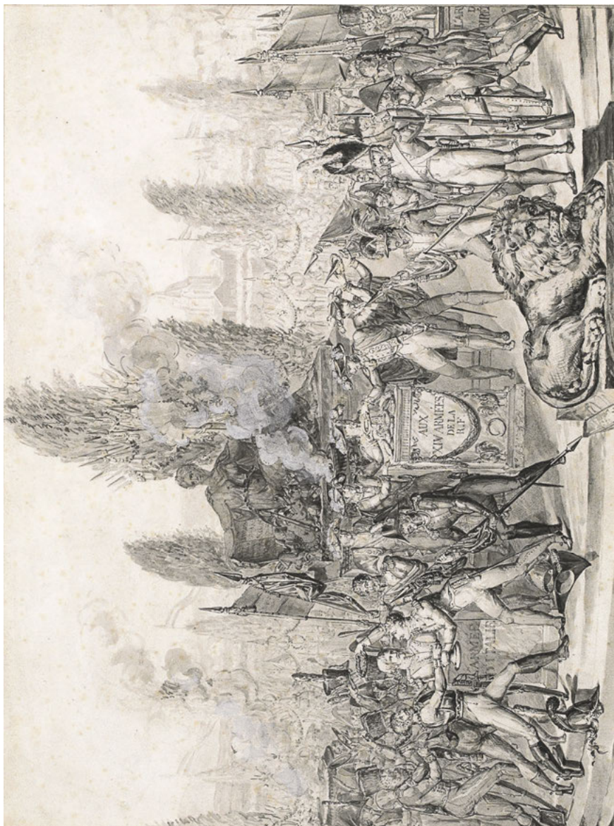
Abb. 4: Fête des Victoires au Champ-de-Mars, le 10 prairial an VI.