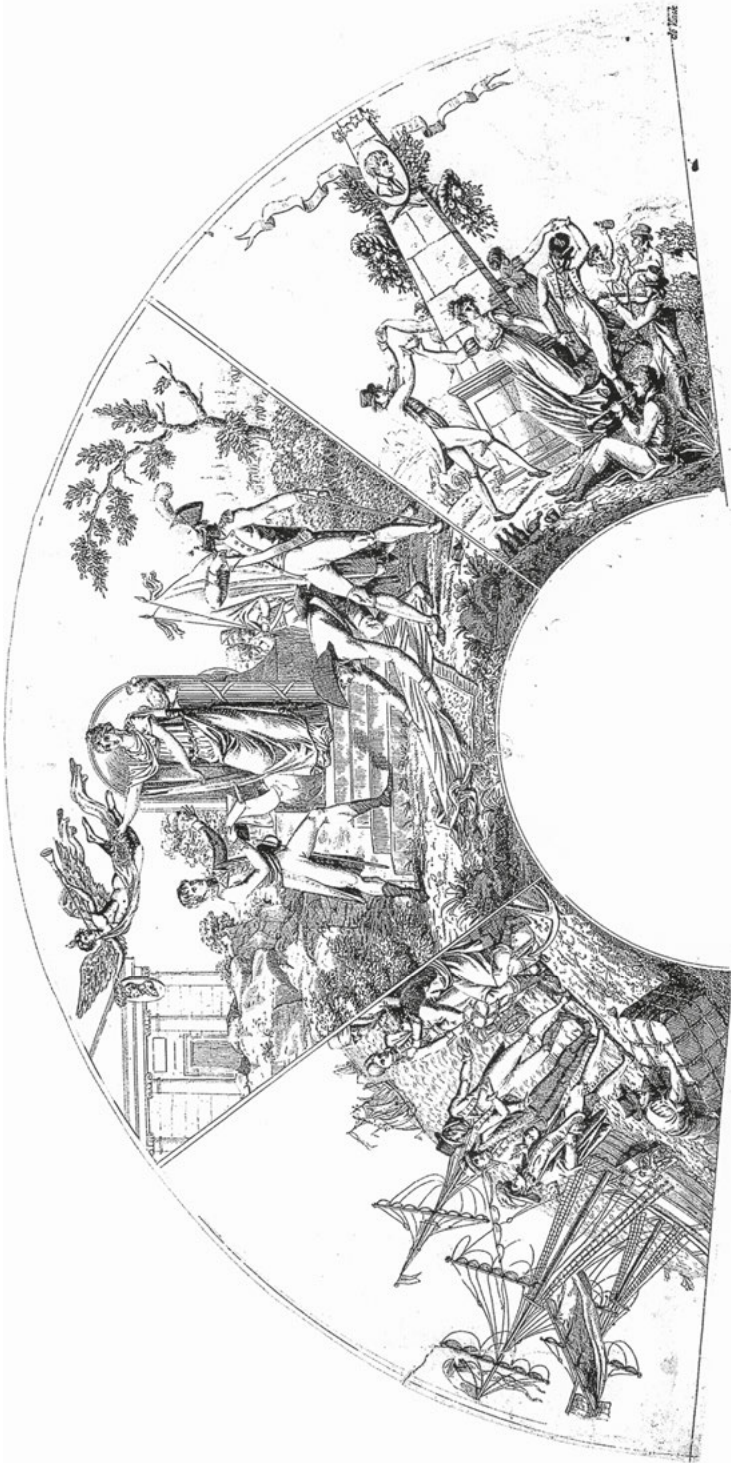
Abb. 5: Eventail publié à l'occasion du traité de Campo-Formio (17 octobre 1797), o. O. o.J.