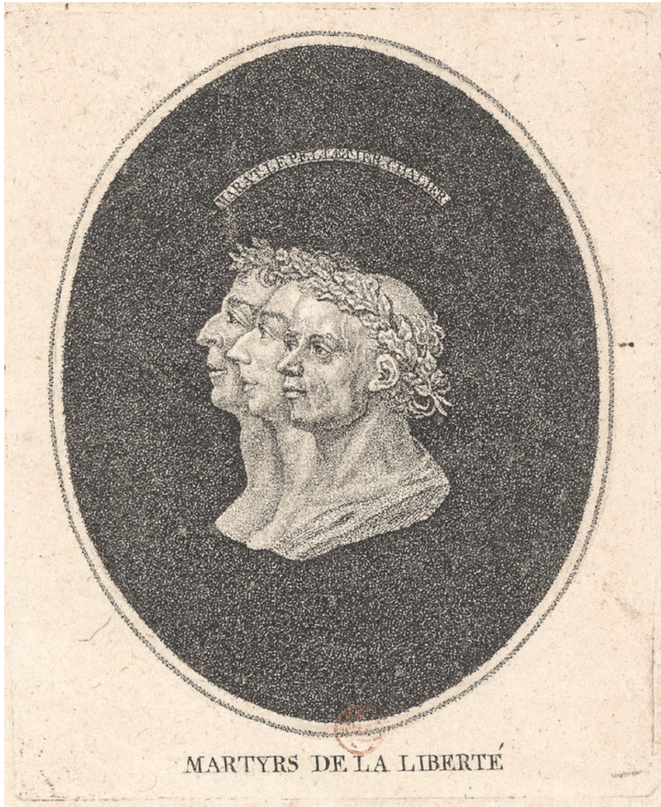
Abb. 3: Martyrs de la liberté: Marat Le Pelletier Chalier, o.O., o.J.