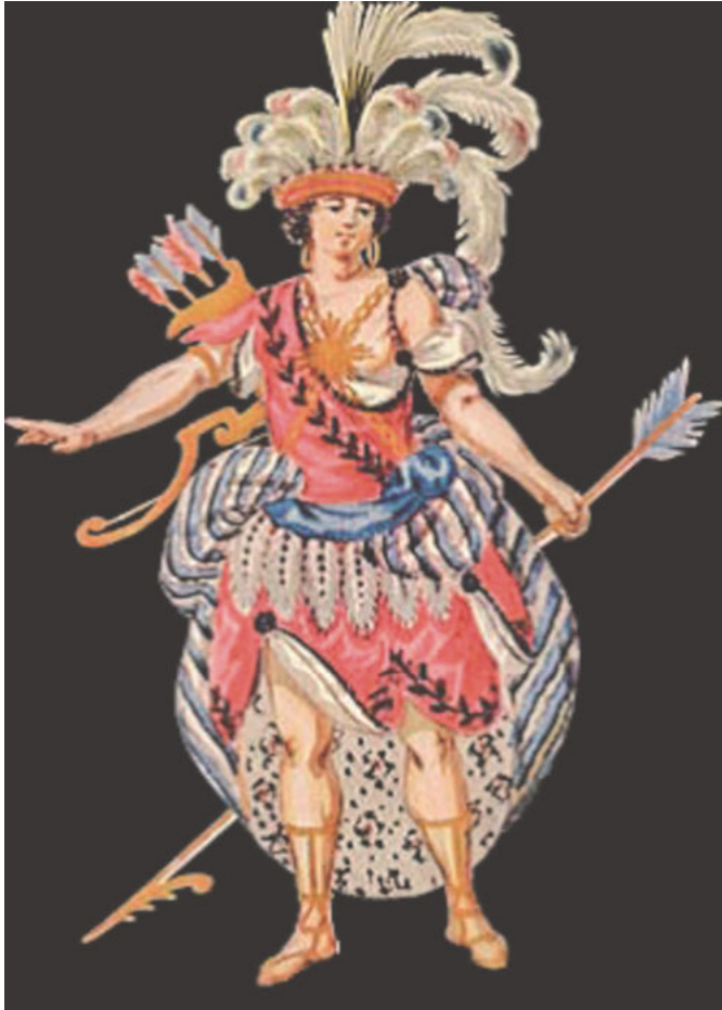
Abb. 2: Carl Friedrich Fehhelm: Re Americano, Figurine für den mexikanischen Kaiser Montezuma, 1754, Berlin, Sammlung Louis Schneider.

Bühne in Konfiguration, Handlung und Sprache zum Ausdruck. Sie setzen innerhalb des Figurenpersonals neben einer moralisch vorbildlichen Gestalt ein Kollektiv voraus, das den Helden verehrt, und einen Gegenspieler, der ihn – ex negativo – kontrastiv verherlicht. Da die oft typologisch markierte heroische Konfiguration erst in der Inszenierung ihre performative Dynamik gewinnt und durch die Handlung wie sprachliche Kommunikation beglaubigt wird, ergibt sich ein gezieltes close reading als Vorgehen: Ob und wie Montezuma und seine Braut in Friedrichs Tragödie heroisiert werden, wird zunächst auf der Handlungsebene untersucht und durch die Analyse der Diskursebene perspektiviert.