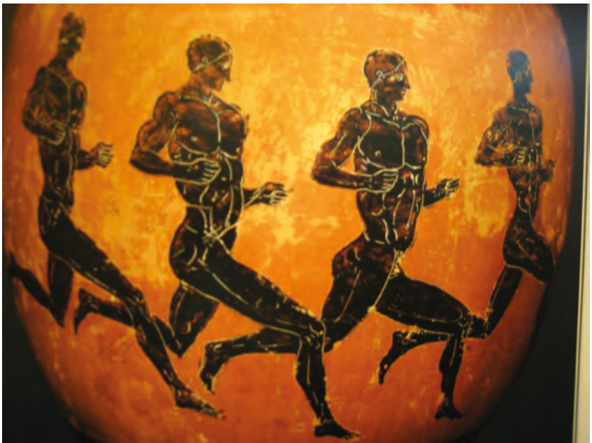
Abbildung 9: Antike Langläufer

formulierte und von Pierre de Coubertin propagierte Wahlspruch „Citius – Altius – Fortius“ verrät deutlich, dass sich die ihm zugrundeliegende Vorstellung vom Sport vorwiegend an der Messung in Zentimeter, Gramm und Sekunden orientierte. Nicht nur der Sieg , sondern auch der absolute Rekord gehörten nach Coubertin zu den wesentlichen Sinnelementen des Olympismus. Im 20. Jahrhundert hat man durch Normierung und Optimierung von Wettkampfstätten, Sportkleidung und Sportgeräten sowie durch die wissenschaftliche Erforschung der Trainingswirkungen in den meisten Sportarten die absoluten Rekorde ständig verbessert, bis man in den letzten Jahren an Leistungsgrenzen gestoßen zu sein scheint, die nur noch durch massive Manipulation der natürlichen Ressourcen des menschlichen Organismus weiter herausgeschoben werden können.