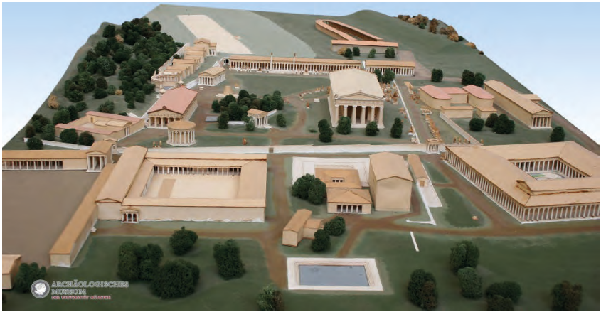
Abbildung 2: Modell des antiken Olympia mit seinen Kult- und Sportstätten

(Archäologisches Museum der WWU Münster, Inv. AM 1)