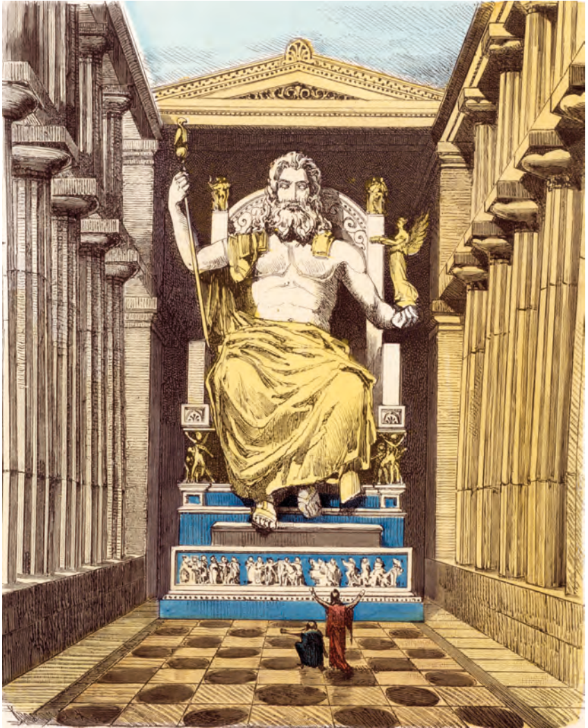
Abbildung 4: Die Zeusstatue des Phidias, eines der sieben Weltwunder der Antike. Versuch einer Rekonstruktion