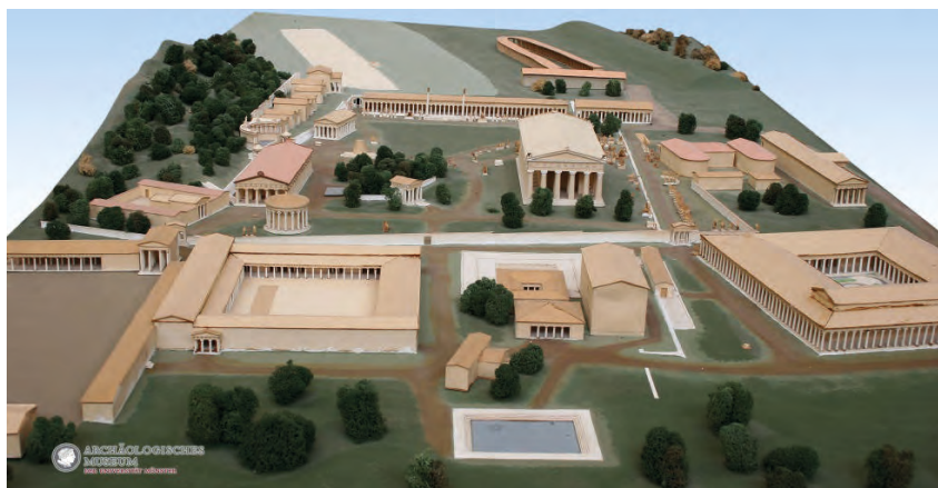
Abbildung 2: Modell des antiken Olympia mit seinen Kult- und Sportstätten

(Archäologisches Museum der WWU Münster, Inv. AM 1)