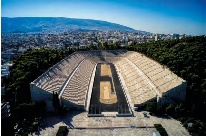
Abbildung 13: Das Stadion der ersten Olympischen Spiele der Neuzeit 1896 in Athen