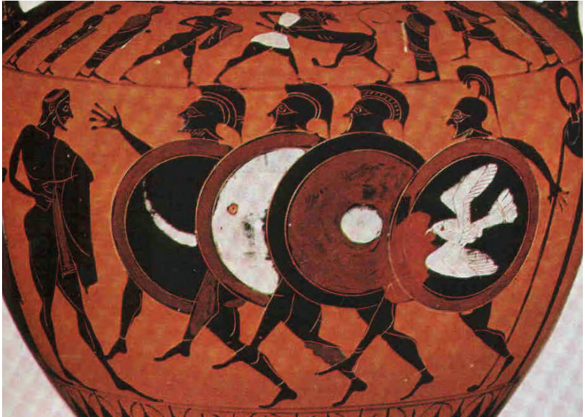
Abbildung 1: Der Waffenlauf – ein Zeichen für den kriegerischen Ursprung der griechischen Athletik