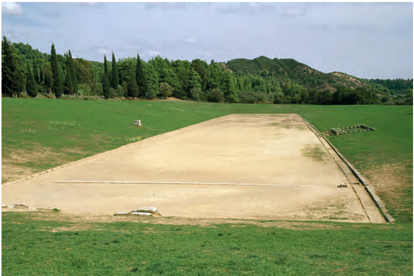
Abbildung 12: Das antike Olympiastadion – eine überraschend schlichte Anlage