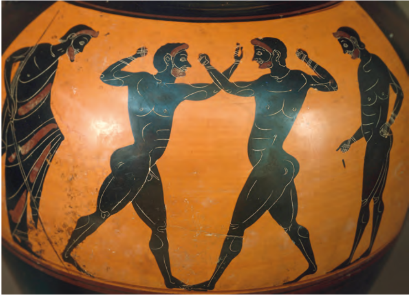
Abbildung 11: Antike Boxer mit umwickelten Fäusten