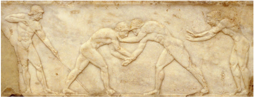
Abbildung 7: Relief mit trainierenden antiken Fünfkämpfern