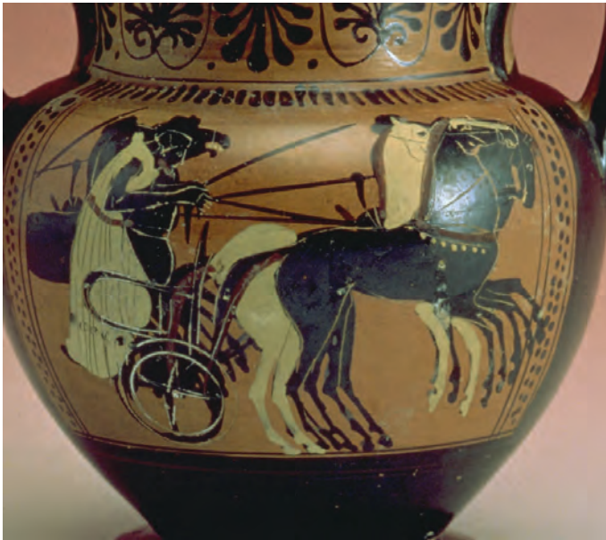
Abbildung 5: Das Rennen mit dem Viergespann – der Höhepunkt der Wettbewerbe im Pferdesport

der Olympischen Spiele ist pure Fiktion. Die Olympic Truce bedeutete kein Ende aller Kriege, sondern sicherte die Veranstaltung der Spiele trotz der Kriege. Während die modernen Olympischen Spiele in ihrer 100-jährigen Geschichte bereits dreimal Kriegen zum Opfer fielen, wurden die antiken Spiele länger als 1100 Jahre ohne eine einzige Unterbrechung gefeiert. Sie waren jedoch mit keiner friedensstiftenden Idee oder Programmatik verbunden. Der Gedanke, internationale sportliche Wettkämpfe planmäßig in den Dienst der Völkerverständigung und des Friedens zu stellen, geht vielmehr ebenfalls auf Pierre de Coubertin zurück.