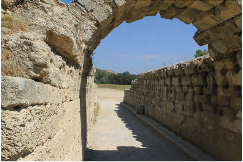
Abbildung 3: Der tunnelartige Zugang zum Stadion von Olympia