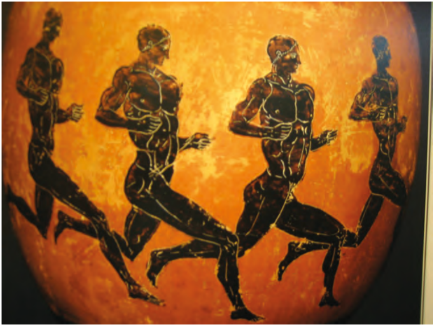
Abbildung 9: Antike Langläufer

formulierte und von Pierre de Coubertin propagierte Wahlspruch „Citius – Altius – Fortius“ verrät deutlich, dass sich die ihm zugrundeliegende Vorstellung vom Sport vorwiegend an der Messung in Zentimeter, Gramm und Sekunden orientierte. Nicht nur der Sieg , sondern auch der absolute Rekord gehörten nach Coubertin zu den wesentlichen Sinnelementen des Olympismus. Im 20. Jahrhundert hat man durch Normierung und Optimierung von Wettkampfstätten, Sportkleidung und Sportgeräten sowie durch die wissenschaftliche Erforschung der Trainingswirkungen in den meisten Sportarten die absoluten Rekorde ständig verbessert, bis man in den letzten Jahren an Leistungsgrenzen gestoßen zu sein scheint, die nur noch durch massive Manipulation der natürlichen Ressourcen des menschlichen Organismus weiter herausgeschoben werden können.