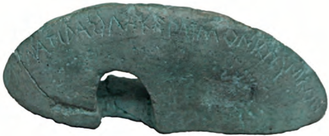
Abbildung 8: Sprunggewicht des Spartaners Akmatidas nach seinem staublosen Sieg im Fünfkampf