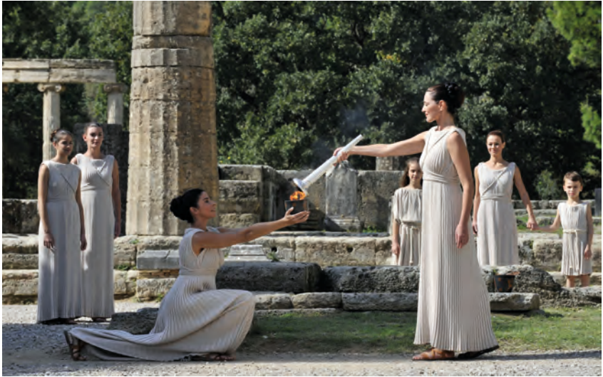
Abbildung 6: Vor den Ruinen des Hera-Tempels wird das Olympische Feuer der modernen Olympischen Spiele entzündet