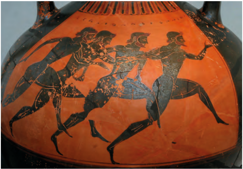
Abbildung 10: Eine dynamische Szene mit Sprintern