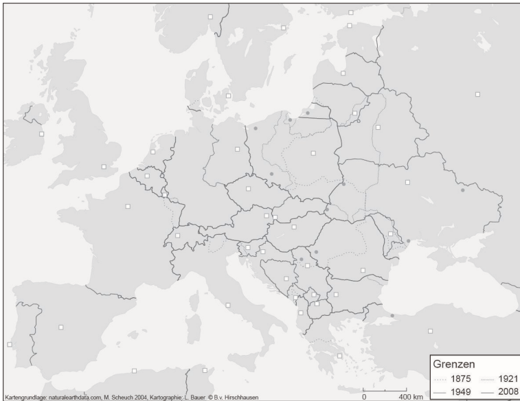
Abb. 3: Palimpsest der Grenzen Ostmittel- und Südosteuropa 1875–2014