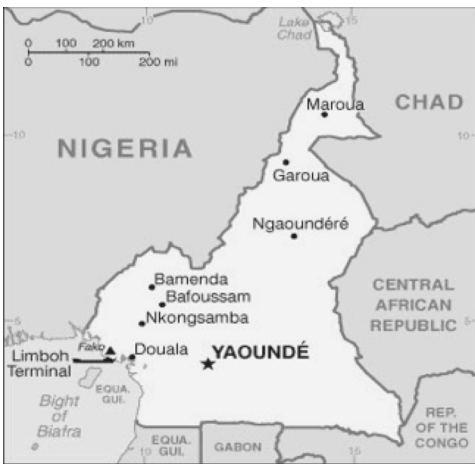
Figure 1 : Carte géographique du Cameroun

Avec une population de près de 25 millions d'habitants répartie sur 475,650 km 2 , le triangle national camerounais légèrement au-dessus de l'équateur s'étire en longueur de la 2e à la 14e latitude Nord, sur une largeur allant de la 8e à la 16e longitude Est. Compte tenu de la variété du climat et de la végétation que l'on y retrouve, le Cameroun qui appartient aux quatre zones suivantes : la zone soudano-sahélienne, la savane, la zone côtière et la forêt tropicale, font de lui, une Afrique en miniature.