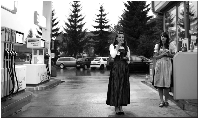
Abb. 1: »[Tiroler] Rennen nur in Trachten rum Das stimmt nicht, obwohl es manchmal praktisch wäre. So ein Dirndl ist auch im Sommer luftig leicht (außer die traditionellen Trachten, welche meist aus schweren Stoffen genäht sind) und steht jeder Frau, ob rund, dünn, alt oder jung. Und die waschresistenten Lederhosen sind sowieso der Hit. Auf Zeltfesten und Prozessionen aber ist das Tiroler Gewand für jeden traditionsbewussten Einheimischen ein Muss. vielerorts im Gastgewerbe unter den Kellnerinnen und Kellnern auch. Hier nicht immer ganz freiwillig.«

Bemerkenswert ambivalent sind die aktuellen Botschaften der Tiroler Tourismuswerbung in ihrem Blog. Während teilweise unverhohlen »Noch heute ist Tracht und Tirol untrennbar verbunden« 13 proklamiert wird, wird an anderer Stelle die Vorstellung, alle Tiroler »rennen nur in Trachten rum« als zwar populäres aber unzutreffendes Vorurteil zurückgewiesen, allerdings auf der Bildebene in Form einer pseudodokumentarischen Werbefotografie zugleich wieder aufgerufen: 14