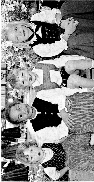
Geliebte Integration: Der Tiroler Trachtenverband will Kinder und Jugendliche in das soziale Leben der jeweiligen Gemeinden eingliedern und Kontakte über regionale Grenzen hinaus knüpfen.

„Wir distanzieren uns ganz klar von nationalsozialistischem Gedankengut“, stellt Gredler im Gespräch mit der Tiroler Tageszeitung unmissverständlich fest. „unsere Aufgaben sind die Pflege, Erhaltung und Weitergabe von Volkskultur und Brauchtum. Wir sind nicht die Träger eines nationalistisch geprägten Wertesystems. Gegen diese durch die Rechtsprechung durch die Verdächtigung verwehrt werden wir uns mit aller Deutlichkeit.