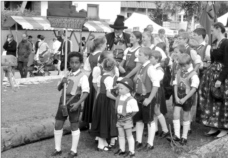
Abb. 3: Handwerksfest Seefeld, 14. September 2014

Noch deutlicher, weil zugleich performativ eingebettet und situativ erlebbar, erscheint dieser Effekt im Kontext einer Aufnahme, die in einer feldforschenden Beobachtungssituation bei einem Umzug auf einem Handwerksfest in Seefeld, einer Tiroler Gemeinde in der Nähe von Innsbruck entstand. Auf dieser dokumentarischen Fotografie ist zu sehen, wie die Trachtengruppe »D’Koasara Kufstein« von einem dunkelhäutigen Buben als Schildträger angeführt wird: