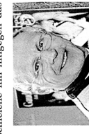
Wir distanzieren uns ganz klar von nationalsozialistischem Gedankengut.“