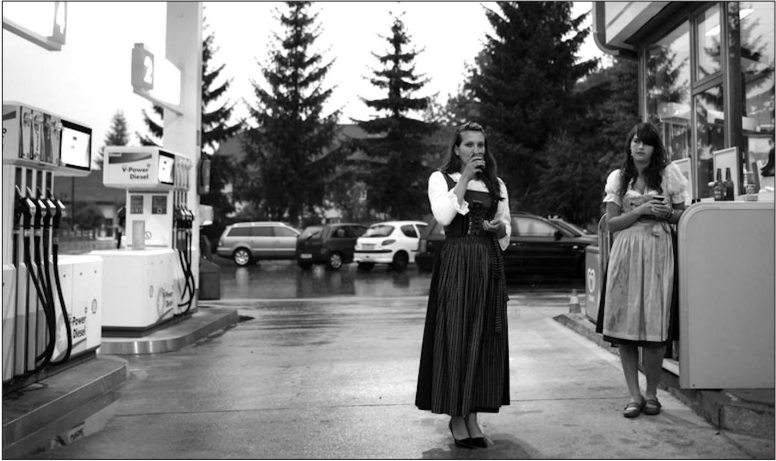
Abb. 1: »[Tiroler] Rennen nur in Trachten rum Das stimmt nicht, obwohl es manchmal praktisch wäre. So ein Dirndl ist auch im Sommer luftig leicht (außer die traditionellen Trachten, welche meist aus schweren Stoffen genäht sind) und steht jeder Frau, ob rund, dünn, alt oder jung. Und die waschresistenten Lederhosen sind sowieso der Hit. Auf Zeltfesten und Prozessionen aber ist das Tiroler Gewand für jeden traditionsbewussten Einheimischen ein Muss. vielerorts im Gastgewerbe unter den Kellnerinnen und Kellnern auch. Hier nicht immer ganz freiwillig.«

Bemerkenswert ambivalent sind die aktuellen Botschaften der Tiroler Tourismuswerbung in ihrem Blog. Während teilweise unverhohlen »Noch heute ist Tracht und Tirol untrennbar verbunden« 13 proklamiert wird, wird an anderer Stelle die Vorstellung, alle Tiroler »rennen nur in Trachten rum« als zwar populäres aber unzutreffendes Vorurteil zurückgewiesen, allerdings auf der Bildebene in Form einer pseudodokumentarischen Werbefotografie zugleich wieder aufgerufen: 14