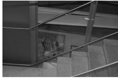
Abb. 6: Gebäudeinternes Fenster hinter Handlauf

Wandstellen, durch Teile der Decke hindurch etc. (Abb. 5 bis 8). Zweifellos dienen die ungewöhnlichen Blickmöglichkeiten bestimmten instrumentellen Funktionen, wie etwa einer ausreichenden Belichtung der weiter im Inneren bzw. unter dem äußeren Bodenniveau befindlichen Räume. Dessen ungeachtet haben sie aber auch Bedeutung.