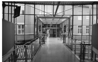
Abb. 4: Altbau vom Durchgang zum Zubau aus