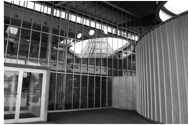
Abb. 12: Fassade rechts

Effekt einer linear gebrochenen Fortsetzung des den Eingang umgebenden Bildes. Er erinnert an jenen eines Vergrößerungsglases, das über eine Buchseite geführt wird und in dem die Buchstaben vergrößert aber zugleich an den Rändern verzerrt erscheinen. Der Eingang empfiehlt sich so ästhetisch als der strategische Eintrittspunkt in das gesamte inszenierte Geschehen.