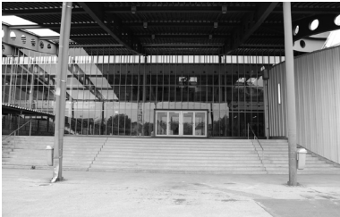
Abb. 9: Gebäudefront