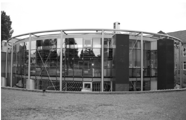
Abb. 3: Schulgebäude – Zubau

Den im Weiteren untersuchten Binnen-Fenstern ist zunächst gemeinsam, dass sie sich nicht an solchen Stellen befinden und/oder solche Formen aufweisen, wie dies für Fenster traditionellerweise üblich ist. Normalerweise durchbricht ein Fenster eine Wand auf jener Höhe, die der durchschnittlichen Augenhöhe aufrecht sich aufhaltender oder bewegender Menschen entspricht. Dies ergibt sich zunächst aus dem banalen Umstand, dass auf diese Weise das Durchblicken am einfachsten zu bewerkstelligen ist und es gibt sich ein solches Fenster damit zugleich unmittelbar als Vorrichtung zu erkennen, die der Funktion des Durchblickens gewidmet ist. Ganz anders verhält es sich mit den hier in Rede stehenden Fenstern. Sie geben den Blick frei an Stellen und in Richtungen, die für einen an durchschnittlich gestalteten Räumlichkeiten gewöhnten Nutzer nicht wie selbstverständlich erwartbar sind, so etwa durch den Fussboden, nach schräg unten oder oben, an überhohen