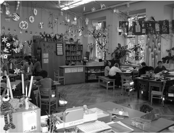
Abb. 2: Klassenzimmer

jene einer großen Eigenständigkeit der sinnlichen Anmutung gegenüber der instrumentellen Funktion. Man kann einen solchen Eklektizismus aber auch als Hinweis darauf lesen, dass es sich hier um eine nachträgliche Adaption eines Raumes handelt, die dessen ursprünglichem Programm in gewisser Weise entgegen tritt, dabei aber mangels ausreichender Ressourcen weitgehend auf Fassadenrhetorik beschränkt bleibt.