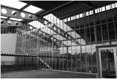
Abb. 11: Fassade links