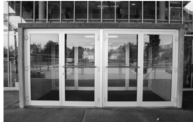
Abb. 10: Eingang

jedenfalls die optische Offenheit, die zarte Binnengliederung der Glasfläche durch das Rahmenwerk und das Fehlen allen farblichen oder raumgestischen Imponiergehaves ins Treffen zu führen. Auch die dekorlosen graublau gefärbten Stützen und Säulen, das silbrige Blechkleid der Anbauten ebenso wie der zwischen Vordach und Gebäude sichtbare Himmelsstreifen dementieren entschieden jede protzige Illusionierungssabsicht. (Dies wird noch deutlicher, wenn man das Gebäude aus größerer Entfernung betrachtet.) Trotz ihrer Dominanz wirkt die Fassade daher eher ruhig und zurückhaltend, für manchen Betrachter vielleicht sogar bescheiden.