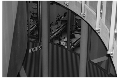
Abb. 8: Einblick von oben über eine undurchsichtige Raumwand hinweg

Machtgefüge der Institution betreffen. Dies könnte etwa nachlässiges oder undiszipliniertes Verhalten betreffen, im schlimmsten Falle so etwas wie Vandalismus oder im harmlosesten auch ganz einfach nichts weiter als unproduktives Nichtstun. Man könnte dies als den – in einem weiten Sinne – politischen Aspekt der allgegenwärtigen Möglichkeit des Beobachtetwerdens nennen. Ihre Relevanz besteht weniger in der tatsächlichen (wohl kaum je praktizierten, wenngleich prinzipiell möglichen) gezielten Observierung der Gebäudenutzer, als in deren Schicksal, ständig und unausweichlich unbemerkt sichtbar zu agieren. Dabei ist für ein präzises Verständnis der politischen Implikationen der Anordnung von zentraler Bedeutung, dass die Beobachtungsmöglichkeit keine hierarchische ist, sondern tatsächlich ›jeder jeden‹ mehr oder minder unerwartet sehen oder mehr oder minder heimlich beobachten kann. So sind etwa selbst die Lehrerzimmer von den Stiegenaufgängen aus (in der Blickrichtung von schräg oben) so gut wie vollständig einsehbar.