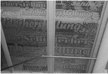
Abb. 7: Gebäudeinternes Fenster mit Schriftzeichen