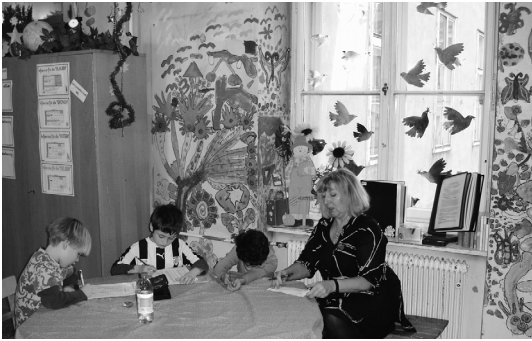
Abb. 1: Fenster

Fensterscheiben sind nämlich fliegende Vögel gemalt, die man durch geeignete Fokussierung des Blicks als dem Gemälde zugehörig sehen kann, auf dem auch die anderen Vögel und Pflanzen abgebildet sind. Dann drücken sie in den Raum herein, da sie ja größer und detaillierter dargestellt sind als die den übrigen Schwarm bildenden Exemplare. Man kann sie aber auch dem äußeren Raum des natürlichen Himmels zugehörig wahrnehmen, wenn man sie als Einheit mit ihrem fernräumlichen Hintergrund ausgliedert, vor dem sie sich abheben und gegen den sie sich bei Bewegungen des Beobachters – eben wie fliegende Vögel – plastisch verschieben. Es handelt sich dann eben um sehr große Vögel, die aber außerhalb des Gebäudes fliegen.