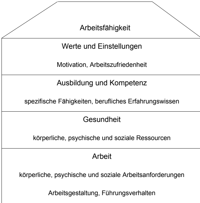
Abb. 1: Haus der Arbeitsfähigkeit nach Ilmarinen und Tempel (2002); eigene Darstellung

Lebensweltorientierung, Bezüge zur Bevölkerungsstruktur und Reflexion institutioneller Faktoren sind nicht zu trennen. Wenn dann beispielsweise die Aufmerksamkeit für die Wirkungen alternder Belegschaften 19 steigt, addieren sich zugleich weitere Vielfaltsfaktoren, wie Sinnesleistungen (Sehen, Hören etc.), Bewegungsabläufe (Gehen, Greifen eines Gegenstandes, Sitzen etc.), mentale Leistungen (Erinnern, Konzentrieren, Reflektieren etc.) und kommunikative Leistungen (Informieren, Unterhalten, Beraten etc.), in Wechselwirkung mit Kontextfaktoren, die fähigkeitsgerechte