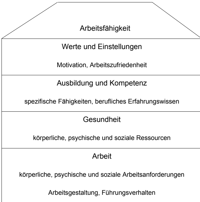
Abb. 1: Haus der Arbeitsfähigkeit nach Ilmarinen und Tempel (2002); eigene Darstellung

Lebensweltorientierung, Bezüge zur Bevölkerungsstruktur und Reflexion institutioneller Faktoren sind nicht zu trennen. Wenn dann beispielsweise die Aufmerksamkeit für die Wirkungen alternder Belegschaften 19 steigt, addieren sich zugleich weitere Vielfaltsfaktoren, wie Sinnesleistungen (Sehen, Hören etc.), Bewegungsabläufe (Gehen, Greifen eines Gegenstandes, Sitzen etc.), mentale Leistungen (Erinnern, Konzentrieren, Reflektieren etc.) und kommunikative Leistungen (Informieren, Unterhalten, Beraten etc.), in Wechselwirkung mit Kontextfaktoren, die fähigkeitsgerechte