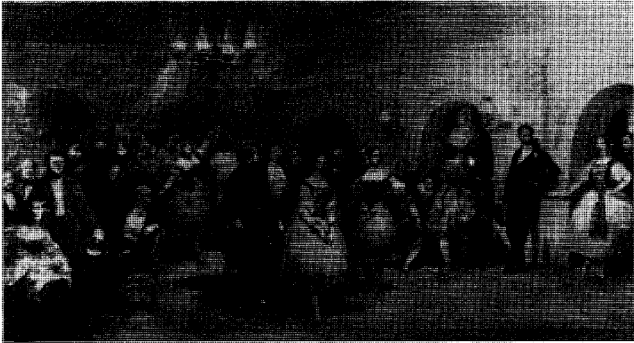
Abb. 1: Foyer de la Danse der Pariser Opéra, Ölgemälde von Eugène Lami, um 1840