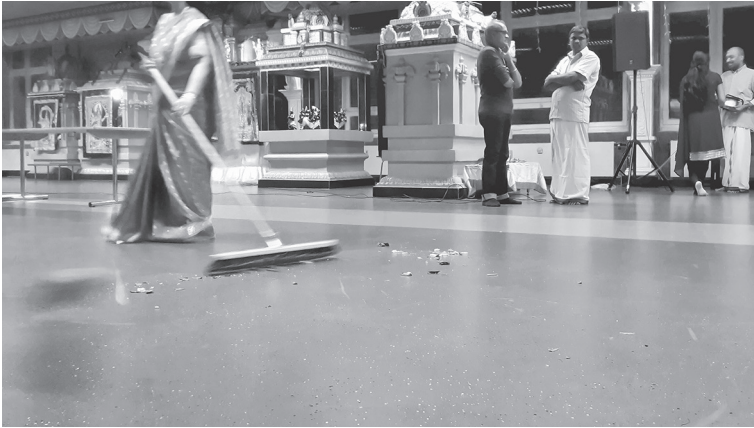
Abbildung 5.3: Eine Frau wischt an Śivaratri den Boden

terschied machen kann. Erst wenn der Tempelraum, die Schreine, das Pūjā -Tablett usw. geputzt wurden, kann im praktischen Vollzug neue bzw. andere Materialität (z. B. frische Blumen) ihre Wirkung entfalten.