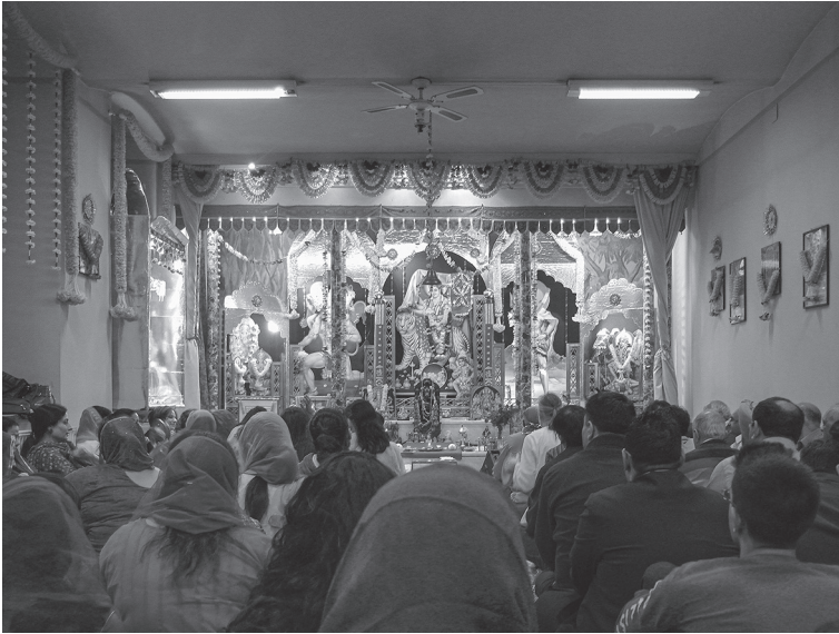
Abbildung 4.4: Der Tempel der Hindu Mandir Association anlässlich des Holi-Festes 2014

Metall oder Holz und Gegenstände für die Durchführung des Āratī , wie bspw. das Muschelhorn oder ein Tablett mit kleinen Ghee-Lampen. Nebst Girlanden und Lichtern schmücken frische Blumen den Schrein. Direkt vor dem Schrein in der Mitte des Raumes hängt eine Glocke an der Decke, die von den Gläubigen angestoßen wird, wenn sie beim Betreten des Tempels vor den Schrein treten. Die Räumlichkeiten hinter dem Tempelraum umfassen eine Küche, eine Garderobe sowie einen Aufenthaltsraum, der gleichzeitig auch als Lagerraum dient. Dass diese Räumlichkeiten nicht ideal für eine Nutzung als Tempel sind, ist wiederholt Thema in Gesprächen und Interviews. Das Projekt eines Neubaus oder eines neuen Tempels in einem bereits bestehenden Gebäude wurde mehrmals aufgeworfen. Schließlich hat der Vorstand am Diwali Mela (hindi) 2016 den Kauf eines eigenen Grundstückes im 21. Wiener Gemeindebezirk verkündet.