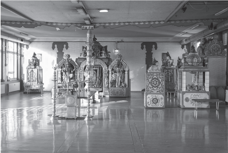
Abbildung 4.1: Der Arulmigu Sivan Kovil 2013

zur Finanzierung des Tempels bei und bilden insbesondere an speziellen Festtagen wie dem jährlichen Tempelfest eine wichtige Einnahmequelle. Ansonsten finanziert sich der Tempel über private Spenden, Mitgliedschaftsbeiträge oder über Cateringdienste für tamilische Feste. An die 1.000 Mitgliederfamilien hat der Tempelverein in Glattbrugg laut dem Vorstand (IUU, Z193). Ein Priester ist angestellt, alle anderen Aufgaben werden von Freiwilligen übernommen. Zu den aktuell genutzten Räumlichkeiten gehören ein Büro und gleichzeitiger Aufenthaltsraum des Priesters, eine Küche, Waschräume und Räume im Souterrain, die der Aufbewahrung unterschiedlicher Gegenstände dienen und auch mal von den Jugendlichen als Rückzugsort während dem Tempelfest genutzt werden (vgl. Z08, Z34ff.). Außerdem stehen auf dem Platz, der an den Tempel grenzt, gut verpackt die Tempelwagen für das Jahresfest.