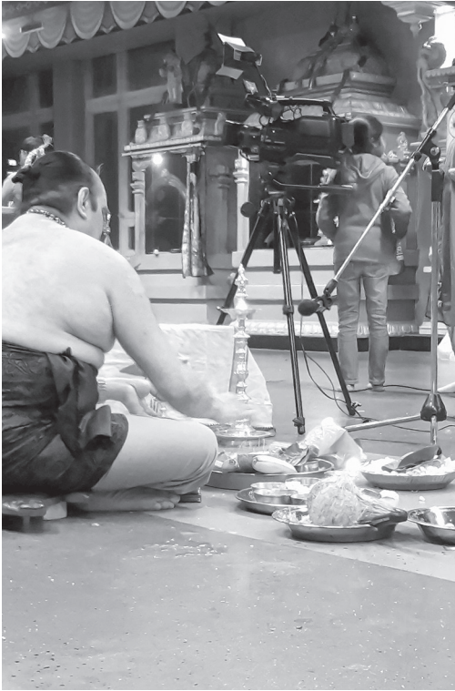
Abbildung 5.11: Der Priester bei der Pūjā-Vorbereitung, Śivaratri 2015

„Die Mūrti wird geschultert und die Menschen stehen auf, um dem sich formierenden Umzug, bestehend aus Flammenträgerinnen, Scheinwerferhalter (inzwischen bin ich mir ziemlich sicher, dass das keine technische Frage ist, um das Bild für die Kameras auszuleuchten, sondern dass das Licht eine religiöse Funktion erfüllt), Musikern und Träger der Gottheit Platz zu machen“ (Z13, Z55-59).