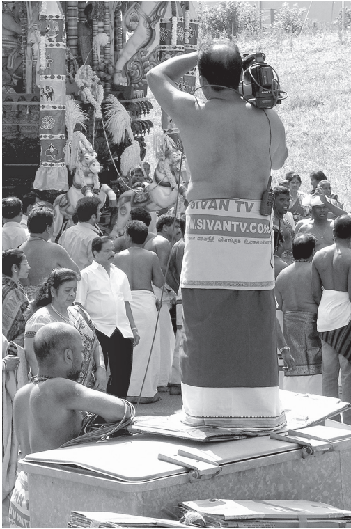
Abbildung 5.10: Ein Team von SivanTV beim Wagenfest 2013

Zudem ist nicht selten eine zweite Person dabei, die aufpasst, dass sich die Kabel der Kamera nicht verheddern. Dabei wird die Kamera nicht immer so weit weg vom Geschehen positioniert, wie dies auf Abbildung 5.10 sichtbar ist, sondern sie wird in der Regel, gerade innerhalb der Tempelräume, inmitten des Geschehens platziert (vgl. Abb. 5.11).