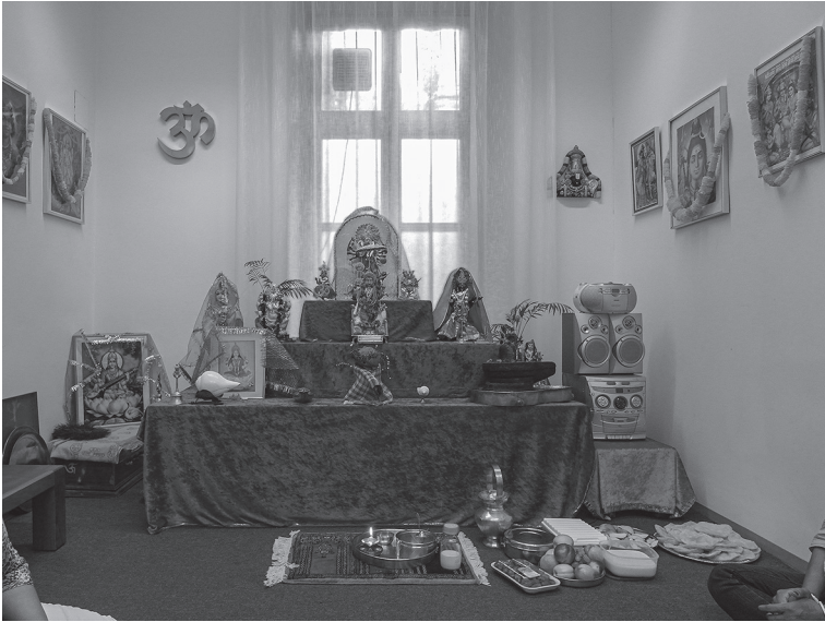
Abbildung 4.3: Der Tempelraum im Afroasiatischen Institut 2013

ditionen von Hindus aus Westbengalen und Bangladesch (Fell McDermott 2005, S. 826). 92 Wenn die Gläubigen sich am Samstag im Tempel im Afroasiatischen Institut versammelten, sangen sie Bhajans , zelebrierten in der Regel Āratī und aßen anschließend gemeinsam prāsada .