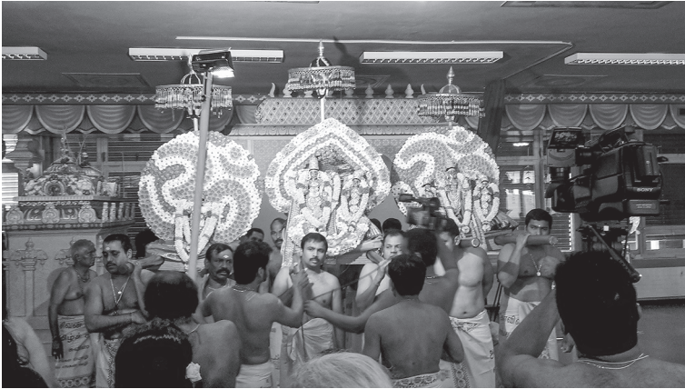
Abbildung 5.12: Kamera und Licht als Teil der Pūjā

text der spezifischen Situation auch Anlass für Irritationen des Sozialen sein: Ein kurzer Unterbruch ritueller Praktiken oder ein Abbruch der Filmaufzeichnung sind kurzfristige Folgen.