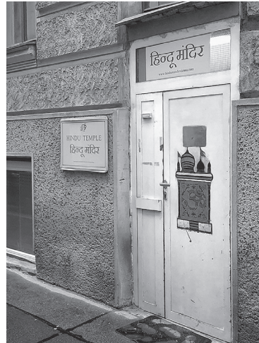
Abbildung 5.2: Die gleiche Tür mit neuem Anstrich, 2016