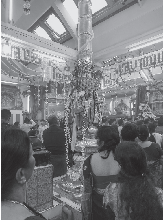
Abbildung 4.2: Der festliche geschmückte Tempelmast des Sri-Sivasubramaniam-Tempels in Adliswil anlässlich des Tempelfestes 2014

Auch der Tempel in Adliswil verfügt über eine Internetpräsenz. Die Sprachenvielfalt (Tamil, Deutsch, Englisch) der Website ist weiter ausgebaut als beim Tempel in Glattbrugg. Zwar gibt es erst seit 2017 eine Mediendatenbank mit Filmaufnahmen der eigenen Feste, 51 ähnlich wie sie der Tempel in Glattbrugg unterhält, dafür weist aber die Website ausführliche Erläuterungen zur „Hindu-Religion“ auf, deren Verfasser, Gregor Vonarburg, sich lange Jahre im Umfeld des Hare-Kṛṣṇa-Tempels am Zürichberg engagiert hat (vgl. IGvA). Die politische