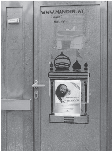
Abbildung 5.1: Eingangstür des Tempelraums der HMA in Wien, 2013