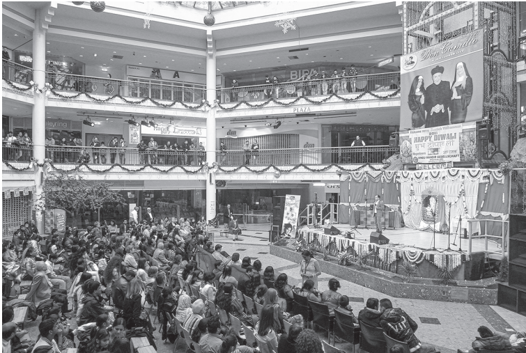
Abbildung 5.9: Diwali-Mela 2013 in der Lugner City

Durch ein großes Banner an der Wand hinter der Bühne wird bei dieser Feier darauf hingewiesen, dass es sich um das 25-Jahr-Jubiläum des Bestehens der Hindu Mandir Association handelt; auf dem Plakat wird das „silver jubilee“ verkündet.