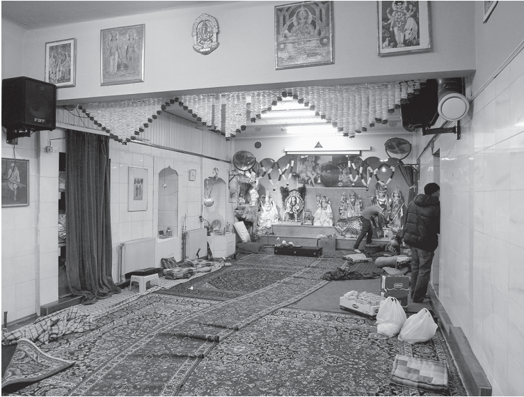
Abbildung 5.4: Der Tempel in der Herbststraße während der Vorbereitungsarbeiten