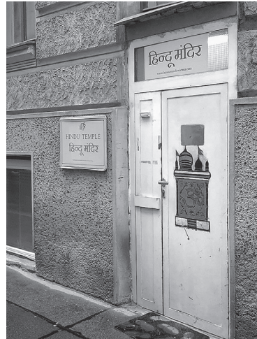
Abbildung 5.2: Die gleiche Tür mit neuem Anstrich, 2016