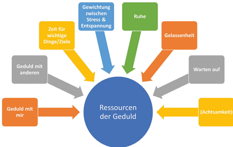
Abbildung 24: Ressourcen der Geduld, eigene Darstellung (Siebert-Blaesing 2020c)

Die qualitative Untersuchung der Geduld im Kontext des FSJ belegt jedoch, dass sich Geduld in einem Zusammenspiel des individuellen Erlebens der Zeit, des Wartens auf wichtige Dinge und Ziele, dem Erleben von Ruhe und Gelassenheit, der Wahrnehmung der Geduld mit sich und der Geduld mit anderen und der passenden Gewichtung im Umgang mit Stress und Entspannung ereignet (vgl. Abb. 24 Ressourcen der Geduld).