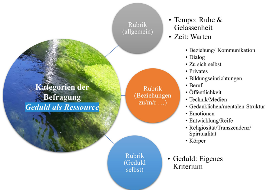
Abbildung 22: Kategorien der Geduld – eigene Darstellung (Siebert-Blaesing 2020c)

ce den weit gefassten Kategorien in der Dimension ‚Tempo‘ mit den Zuständen der ‚Ruhe‘ und ‚Gelassenheit‘ sowie zu der Dimension ‚Zeit‘ mit dem Zustand des ‚Wartens‘ zugewiesen. In der zweiten Rubrik werden die Kategorien in Ebenen genauer gebildet. Hierbei gibt es die „Ebenen“ der ‚Beziehung/Kommunikation‘, ‚im Dialog‘, ‚in Beziehung zu sich selbst‘, ‚in privaten Beziehungen‘, ‚Beziehungen zu Bildungseinrichtungen‘, ‚Beziehungen im Beruf‘, ‚zur Öffentlichkeit‘, ‚zur Technik/Medien‘. Es wird eine Ebene zur ‚gedanklichen Struktur‘, zum ‚Umgang mit Emotionen‘, zur ‚Entwicklung/Reife‘, zur ‚Religiosität/Spiritualität/Transzendenz‘ und zum ‚Körper‘ gebildet. Zur dritten Rubrik zählen Nennungen, die ‚Geduld als eigenes Merkmal‘ verstehen.