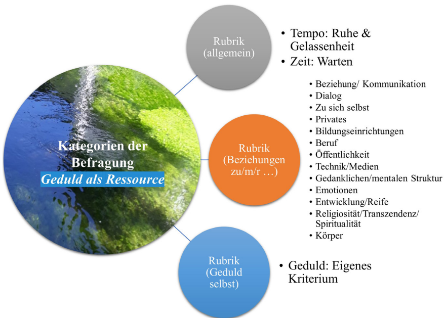
Abbildung 22: Kategorien der Geduld – eigene Darstellung (Siebert-Blaesing 2020c)

ce den weit gefassten Kategorien in der Dimension ‚Tempo‘ mit den Zuständen der ‚Ruhe‘ und ‚Gelassenheit‘ sowie zu der Dimension ‚Zeit‘ mit dem Zustand des ‚Wartens‘ zugewiesen. In der zweiten Rubrik werden die Kategorien in Ebenen genauer gebildet. Hierbei gibt es die „Ebenen“ der ‚Beziehung/Kommunikation‘, ‚im Dialog‘, ‚in Beziehung zu sich selbst‘, ‚in privaten Beziehungen‘, ‚Beziehungen zu Bildungseinrichtungen‘, ‚Beziehungen im Beruf‘, ‚zur Öffentlichkeit‘, ‚zur Technik/Medien‘. Es wird eine Ebene zur ‚gedanklichen Struktur‘, zum ‚Umgang mit Emotionen‘, zur ‚Entwicklung/Reife‘, zur ‚Religiosität/Spiritualität/Transzendenz‘ und zum ‚Körper‘ gebildet. Zur dritten Rubrik zählen Nennungen, die ‚Geduld als eigenes Merkmal‘ verstehen.