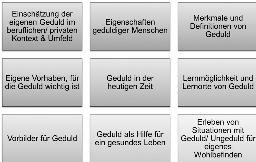
Abbildung 23: Themen der Befragung, eigene Darstellung (Siebert-Blaesing 2020c)