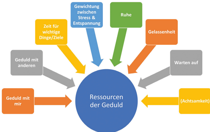
Abbildung 24: Ressourcen der Geduld, eigene Darstellung (Siebert-Blaesing 2020c)

Die qualitative Untersuchung der Geduld im Kontext des FSJ belegt jedoch, dass sich Geduld in einem Zusammenspiel des individuellen Erlebens der Zeit, des Wartens auf wichtige Dinge und Ziele, dem Erleben von Ruhe und Gelassenheit, der Wahrnehmung der Geduld mit sich und der Geduld mit anderen und der passenden Gewichtung im Umgang mit Stress und Entspannung ereignet (vgl. Abb. 24 Ressourcen der Geduld).