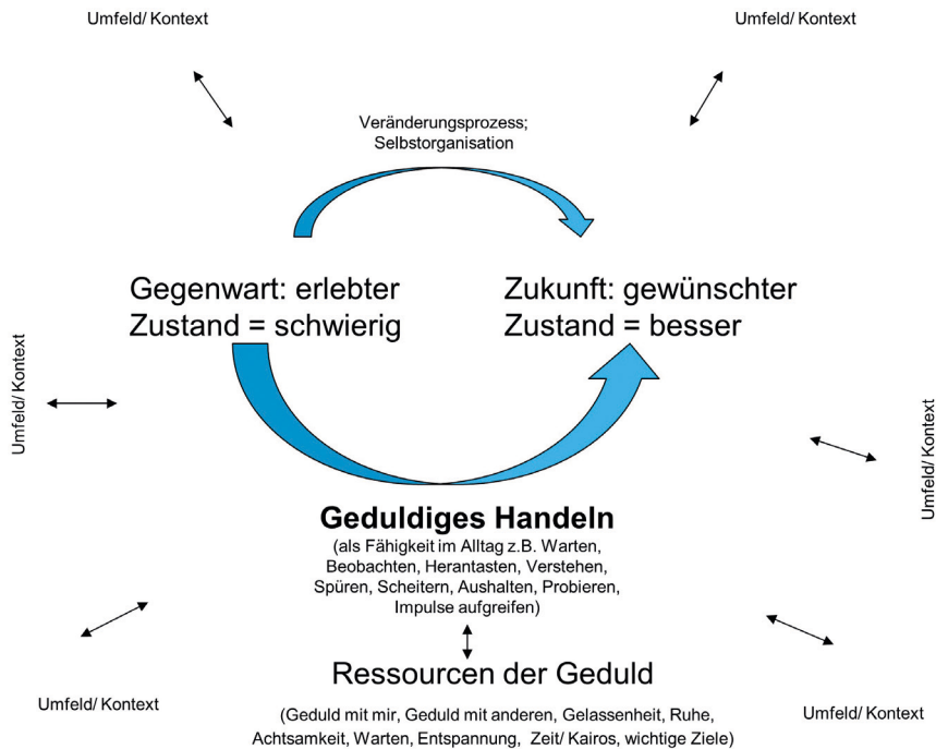
Abbildung 21: Geduldiges Handeln als Prozess, eigene Darstellung (Siebert-Blaesing 2020d)