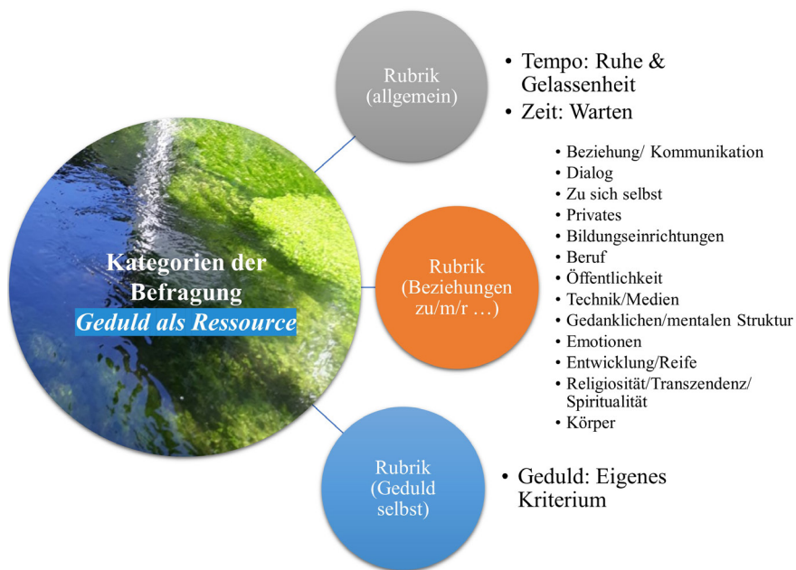
Abbildung 22: Kategorien der Geduld – eigene Darstellung (Siebert-Blaesing 2020c)

ce den weit gefassten Kategorien in der Dimension ‚Tempo‘ mit den Zuständen der ‚Ruhe‘ und ‚Gelassenheit‘ sowie zu der Dimension ‚Zeit‘ mit dem Zustand des ‚Wartens‘ zugewiesen. In der zweiten Rubrik werden die Kategorien in Ebenen genauer gebildet. Hierbei gibt es die „Ebenen“ der ‚Beziehung/Kommunikation‘, ‚im Dialog‘, ‚in Beziehung zu sich selbst‘, ‚in privaten Beziehungen‘, ‚Beziehungen zu Bildungseinrichtungen‘, ‚Beziehungen im Beruf‘, ‚zur Öffentlichkeit‘, ‚zur Technik/Medien‘. Es wird eine Ebene zur ‚gedanklichen Struktur‘, zum ‚Umgang mit Emotionen‘, zur ‚Entwicklung/Reife‘, zur ‚Religiosität/Spiritualität/Transzendenz‘ und zum ‚Körper‘ gebildet. Zur dritten Rubrik zählen Nennungen, die ‚Geduld als eigenes Merkmal‘ verstehen.