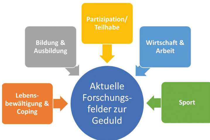
Abbildung 5: Forschungsfelder, eigene Darstellung (Siebert-Blaesing 2020c)