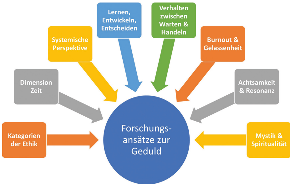
Abbildung 4: Forschungsansätze zur Geduld, eigene Darstellung (Siebert-Blaesing 2020c)